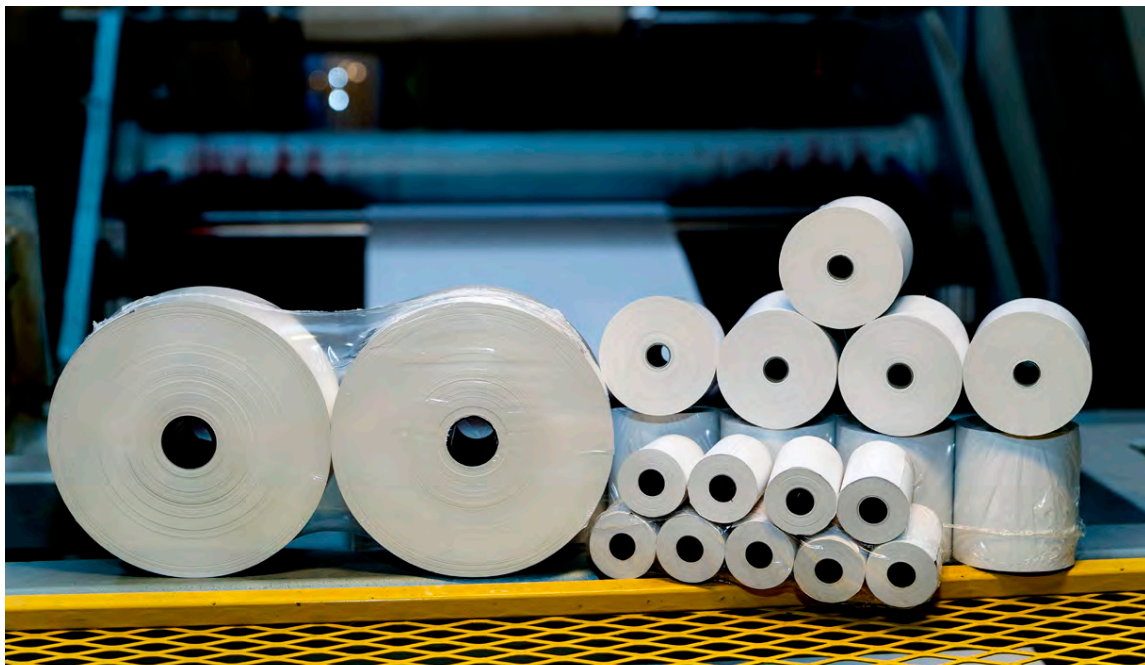
Á undanförunum 15-20 árum hefur nánast öll notkun á kassa- og posarúllum færst yfir í svokallaðan „thermal“ pappír.