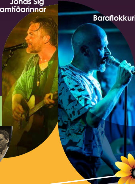
Baraflokkurinn ásamt Lost