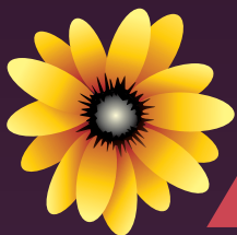
Jónas Sig og Ritvélar framtíðarinnar

Allt um viðburði í bænum á www.visitakureyri.is