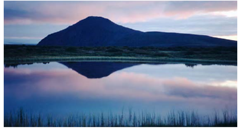
Mývatn er einn vinsælasti ferðamannastaður landsins.