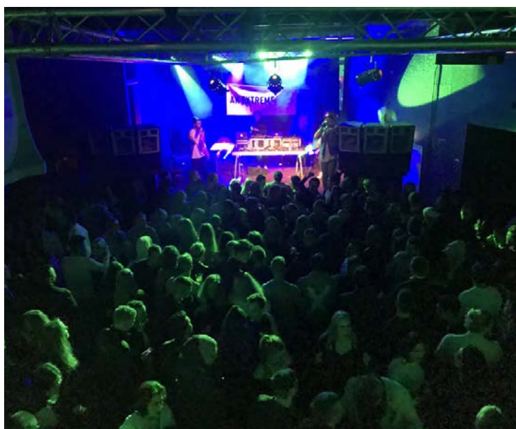
Það er fjör í Sjallanum þegar AK Extreme fer fram.

Auk íþróttaviðburðanna verður öflugt skemmtanalíf í bænum á meðan hátíðin stendur yfir. „Í ár ætlum við aftur að hefja hátíðina