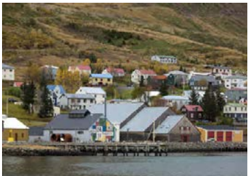
Sildarminjasafnið er heimsóknarinnar virði.

Fyrir saltþækilinn: Blandið öllu saman í potti og náid upp suðu. Kælið þækil alveg niður og setjið síldina í pottinn. Látið hana marinerast í 5 klst. Takið síldina úr þæklinum og látið þorna. Fyrir reykingu: Raðið kolum í hálfhring í botninn á kúlulaga kolagrilli. Hafið röðina tvo kolamola á breidd og tvo á hæð. Raðið viðarbútum ofan á kolin. Kveikið í fimm öðrum kolamolum og þegar þeir eru orðnir gráir og heitir, setjið þá þétt upp við annan endann á kolaröðinni. Setjið álform með vatni í hinn hluta grillsins og leggið grindina ofan á. Raðið fiskunum með magann niður, þannig að þeir snúi uppréttir, á þann hluta grillsins þar sem kolin eru ekki. Lokið grillinu og heitreykið síldina í um 4-6 tíma. Berið fram með t.d. kartöflusalati og ofnsteiktu grænmeti. Heimild: www.hidblomlegabu .