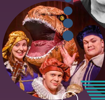
Sjeikspír eins og hann leggur sig