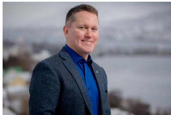
Njáll Trausti Friðbertsson, þingmaður Sjálfstæðis- flokks.

Njáll Trausti Friðbertsson hóf formlega afskipti af bæjarmálum á Akureyri árið 2010 sem varabæjarfulltrúi og fjórum árum síðar sem bæjarfulltrúi. Hann settist á þing árið 2016 fyrir Sjálfstæðisflokkinn og segir stóra málið vera uppbyggingu meginflutningskerfis raforku á Norðurlandi. „Sú ótrúlega staða sem komin er upp hér á Norðurlandi í þessum málaflokki er með hreinum ólíkindum. Lélegt dreifikerfi hefur haft afar slæm áhrif á atvinnuuppbyggingu á svæðinu undanfarinn