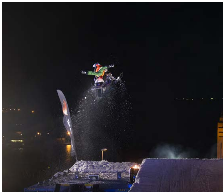
Eimskips gámostökkið er stærsti viðburðurinn.

á Græna hattinum með tónleikum og partí á fimmtudagskvöldinu. Þar ætla Une Misère og Dr. Spock að bomba í nokkur desíbel,“ segir Hreggviður. „Þannig að eftir gott hlé verður hið ógleymanlega byrjunarpartí AK Extreme haldið aftur. Þetta hafa verið epísk kvöld eins og elstu menn muna. Það hefur líka aldrei verið eins ódýrt inn á Græna hattinn eins og þetta kvöld, það kostar bara 1.500 kall.“