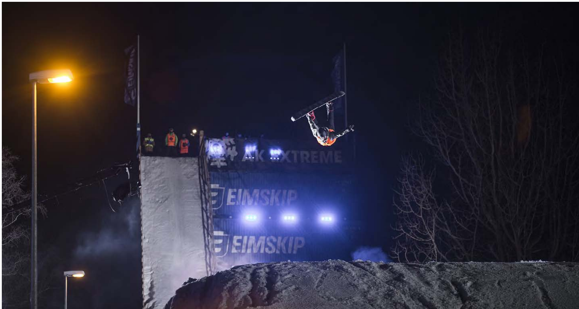
Eimskips gámostökkið er stærsti viðburður hátíðarinnar.