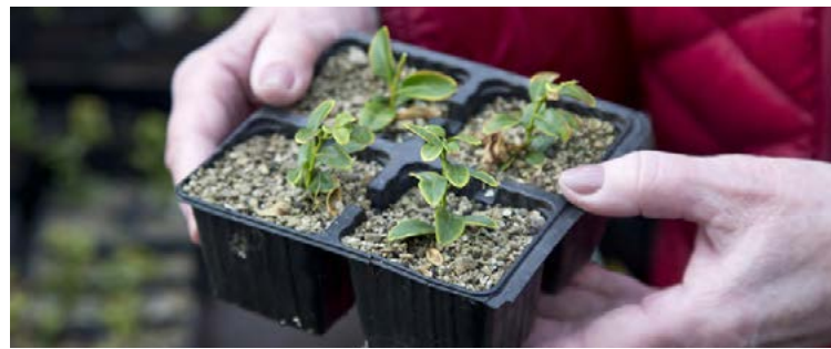
Hér má líta græðlinga sem brátt fá að skjóta rótum úti í garði.

tegundum. Það má segja að þetta sé skrautgarður með fjölæringum. Við erum búin að búa hér í bráðum fimmtíu ár og fengum mjög fljótlega garðáhuga svo við erum búin að breyta garðinum, erum