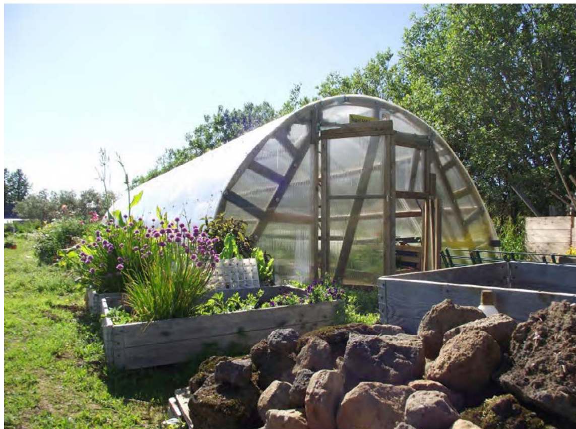
Hópur fólks ræktar grænmeti í Seljagarði í Breiðholti. Í sumar verður hægt að vera í áskrift, fá fræðslu og uppskeru.

Bókabúð Forlagsins | Fiskislóð 39 | www.forlagid.is Opíð alla virka daga 10–19 | Laugardaga 11–16