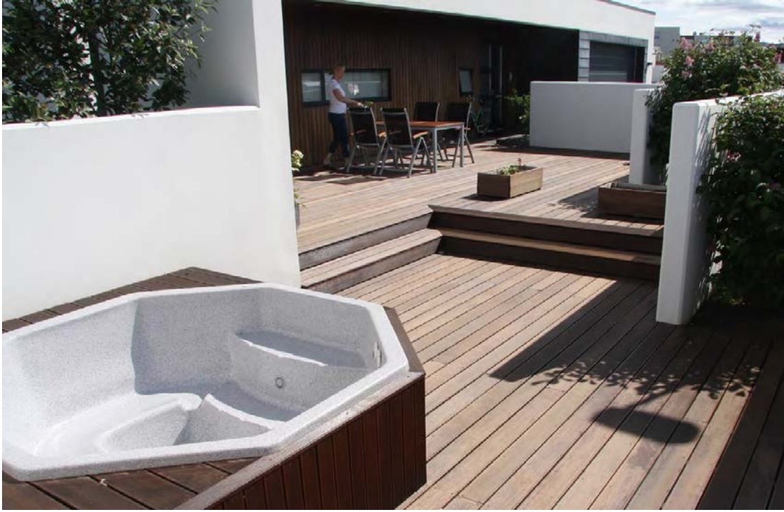
Gott samræmi milli húss og garðs. Veggirnir eru framhald af húsinu. Pallurinn tónar vel við klæðningu og gluggalista.