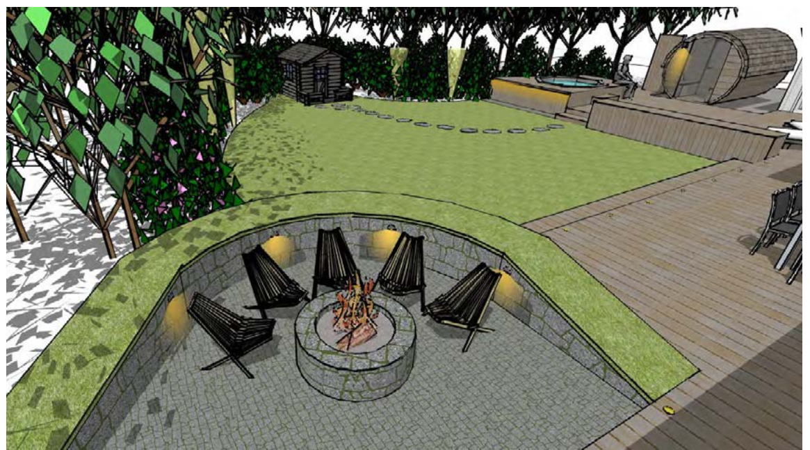
Með því að hanna í þrívídd sést samspil allra þátta vel. Hér má sjá hvernig lýsingin á sumarhúsalóðinni er hugsuð.

Hugmyndir þurfa að gerjast og garðeigandinn þarf að mæta það í hugarum hvernig lífið í nýja garðinum geti orðið.