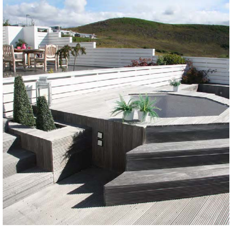
Viðhaldsfriir pallar. Skemmtilegt útsýni er úr pottinum yfir fallegt svæðið.

ingar, gróðurplan og staðsetningu ljósa. Oft er stuðst við hugmyndir sem garðeigandinn hefur fundið á netinu eða jafnvel séð erlendis í sumarfríinu.