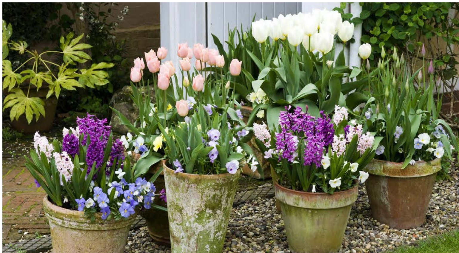
Það er fallett að hafa blóm og matjurtir í pottum.

Þegar hann er spurður um áburðargjöf, svarar hann: „Það er að öllu leyti best að nota lífrænan áburð. Maður fær kannski ekki eins mikla uppskeru en í mínum huga er betra að fá bragðgott kál heldur en fljótsprottið. Lífrænn áburður er matur fyrir plönturnar en tilbúinn er vítamín.“