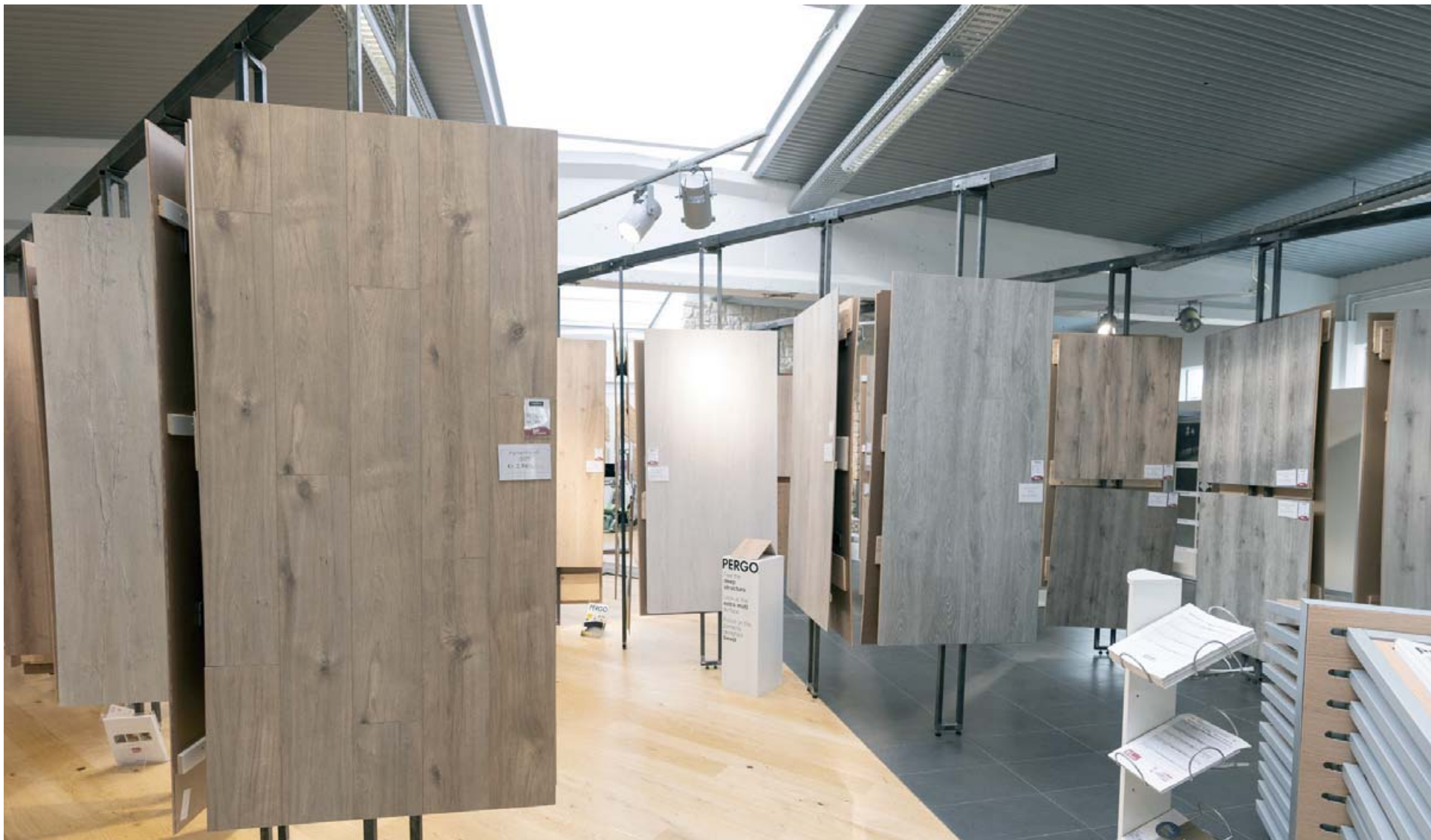
Hjá Agli Árnasyni ehf. er hægt að fá vönduð gólfefni fyrir allar aðstæður.