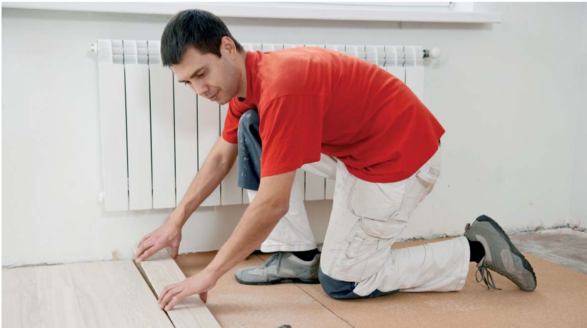
Ljós parketgólf hafa verið vinsæl undanfarið.