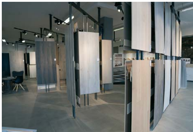
Harðparket frá Quick-Step má nota í eldhúsi og baðherbergjum.