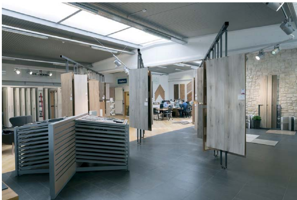
Í verslun Egils Árnasonar ehf. er hægt að skoða mikið úrval gæðagólfefna.