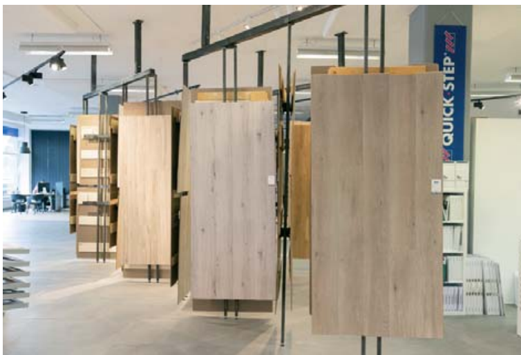
Harðviðarval selur meðal annars hágæða parket frá Quick-Step

Pressan í kjarna efnisins getur verið misjöfn og það skiptir máli að hún sé mikill. Því meiri sem hún er, því meira er höggþol efnisins og heildarstyrkur. Læsingar á efninu þurfa einnig að vera stórar og öflugar til að koma í veg fyrir gliðnun á lásun. Ef fólk skoðar alla eiginleika Quick-Step harðparketsins eru fá efni sem toppa það. Til gamans má geta að við erum með Quick-Step harðparket á stórum hluta í sýningarsalnum okkar þar