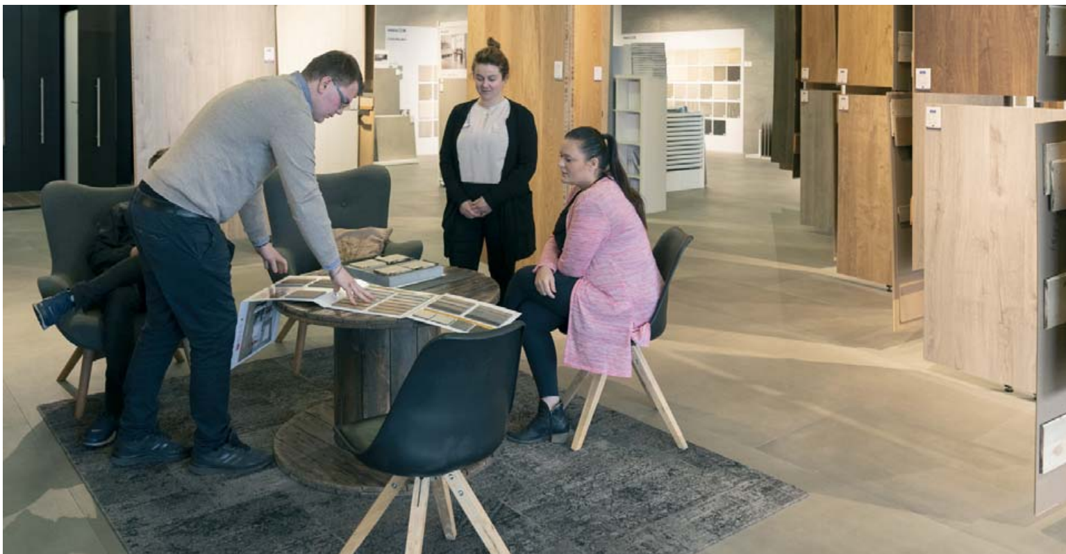
Viðskiptavinir fá faglegar ráðleggingar um val á gólfefnum hjá starfsfólki. „Við lánum heim heila pakka ef fólk vill skoða gólfefnið betur í réttu umhverfi.“