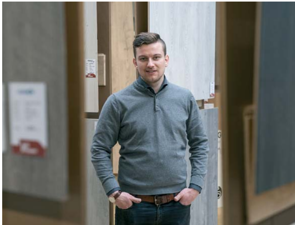
Auðunn segir að harðparketið frá Pergo uppfylli allar gæðakröfur.

„Við getum svo líka bent fólki á iðnaðarmenn sem við þekkjum til og höfum góða reynslu af, þannig að það er ekkert mál að kíkja til okkar til að fá ráðleggingar og nafnspjöld,“ segir Auðunn.