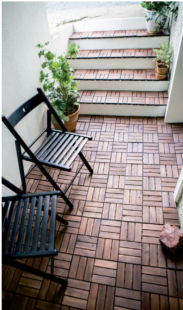
Stiklurnar setja hlýlegt yfirbragð á innganginn hjá Filippíu þar sem notalegt er að setjast niður í bliðviðri sumarsins innan um fallegar jurtir og steina.

„Þetta getur ekki verið betra dæmi um „fyrir og eftir“ að mínu mati og ég er alsæl með útkomuna.“