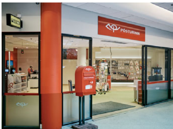
Meðal þjónustaaðila í Firðinum er Pósturinn.