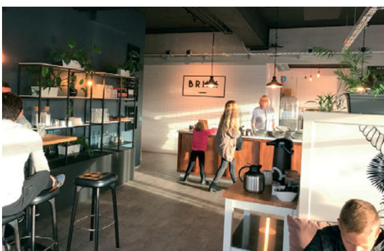
Brikk, kaffihús og bakari við Norðurbakkann hefur verið mjög vinsæll áningarstaður hjá Hafnfirðingum og nærsveitamönnum.

Rósa segir að miðbær Hafnarfjarðar hafi ávallt verið nokkuð líflægur en engu að síður hafi á undanförunum misserum orðið mikil breyting. „Ég má til með að nefna að tvö ný og sérlega metnaðarfull veitingahús, VON mathús og