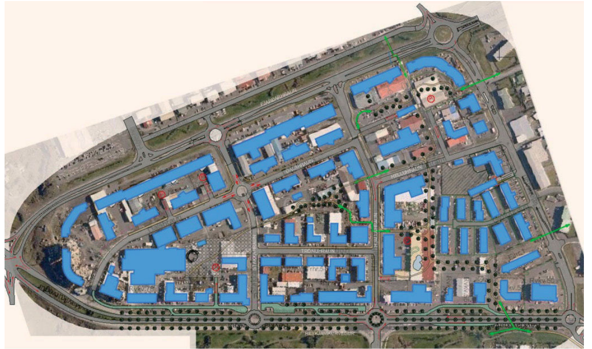
Hverfið fékk á hönnunarstiginu viðurnefnið „Fimm mínútna hverfið“ en sú hugmynd gengur út á að íbúar hverfisins geti fengið flesta þá þjónustu sem nauðsynleg er í ekki meira en fimm mínútna fjarlægð frá miðju hverfisins.