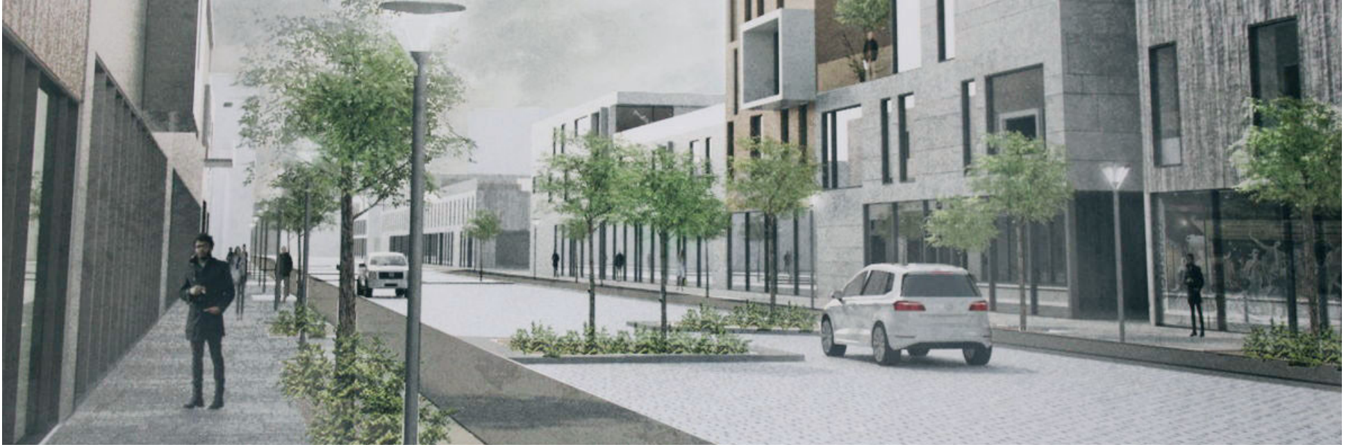
Í nýju Hraunahverfi, Hraun-Vestur, mun á næstu árum verða til líflegt umhverfi fyrir alls konar fólk.