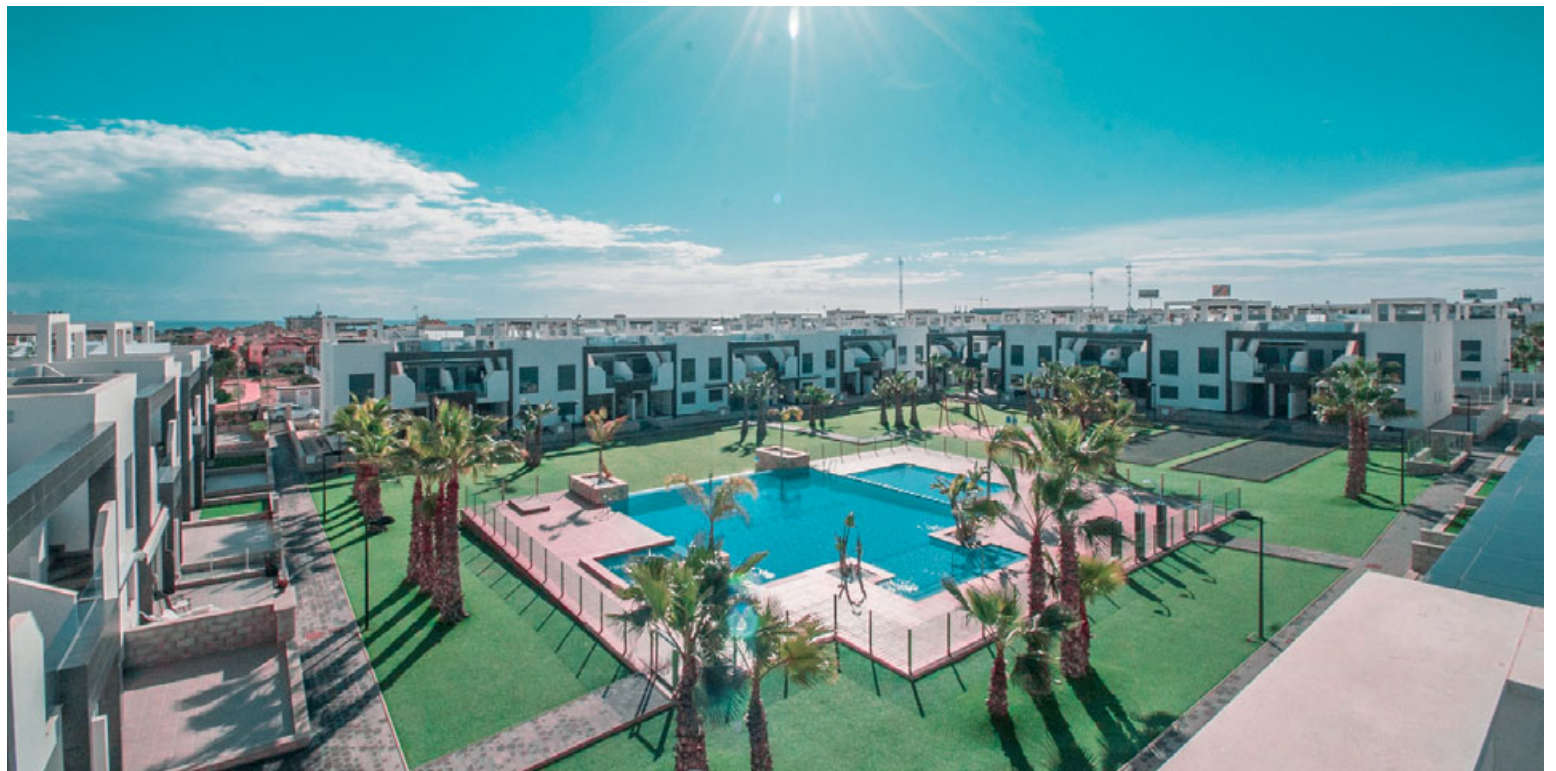
Fasteignirnar eru glæsilegar í La Zenia en svæðið er eitt það vinsælasta í þessum hluta Spánar.