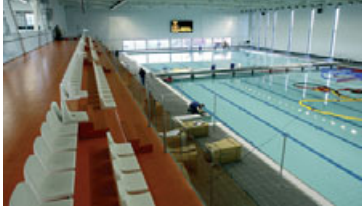
Ásvallalaug er 50 metra löng og hentar vel fyrir sundkeppni.