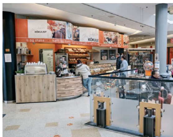
Í Kökulist er hægt að kaupa veitingar bæði til þess að njóta á staðnum og gripa með.