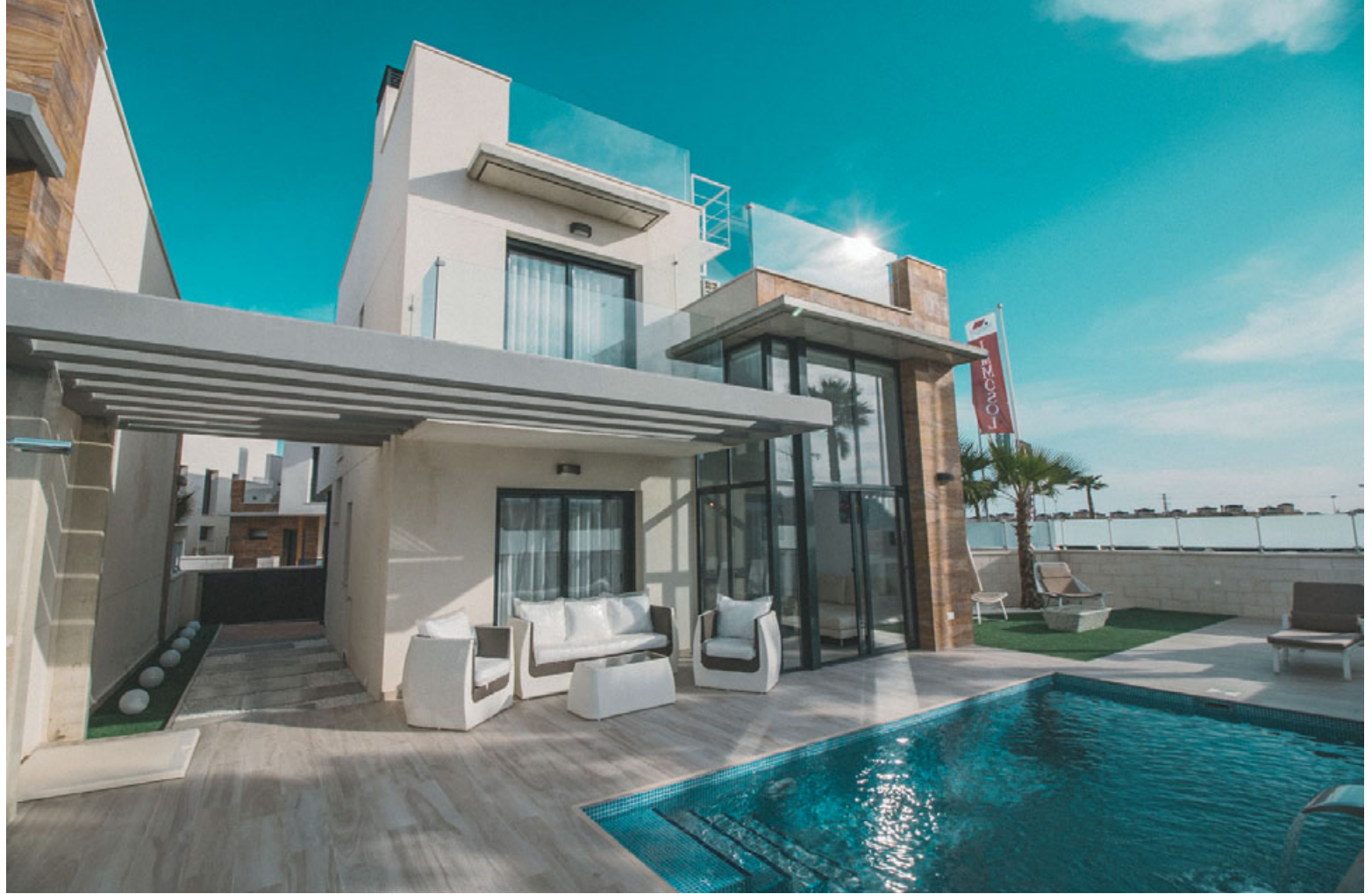
Fasteignirnar í Lomas de Cabo Roig eru einstaklega glæsilegar.

Nánari upplýsingar má finna á www.spanarheimili.is .