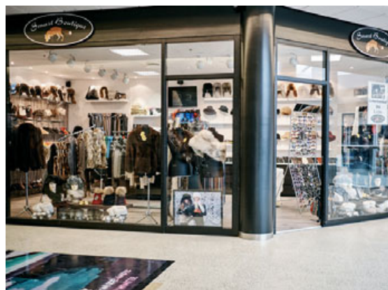
Smart Boutique býður úrval glæsilegra skinnvara.