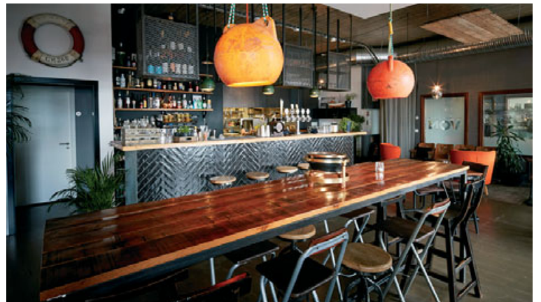
VON mathús og bar er glæsilega innréttað og hægt að láta fara einkar vel um sig yfir gómsætri, íslenskri matargerð, dýrindis kokteilum og góðri þjónustu.