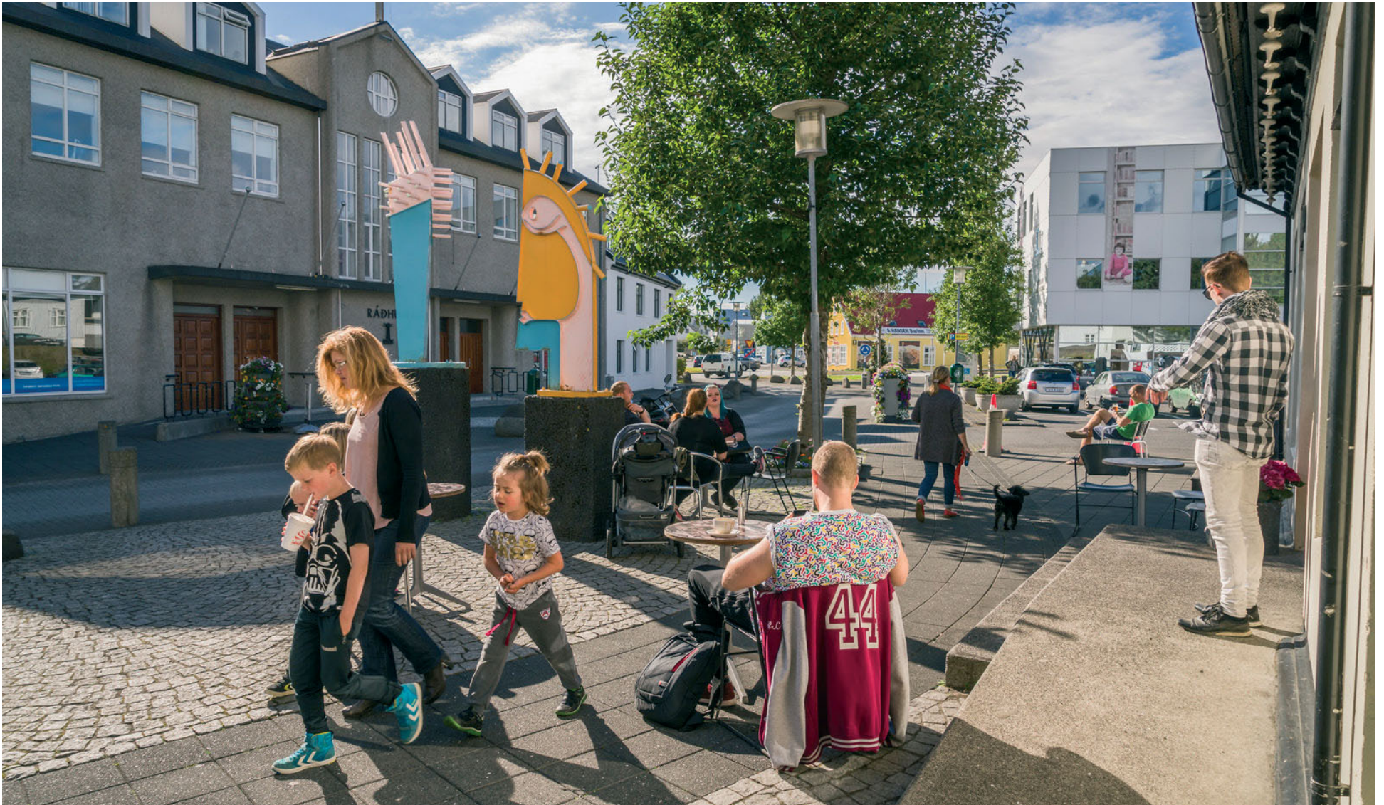
Það er afslappaður og notalegur sjarmi yfir miðbæ Hafnarfjarðar.