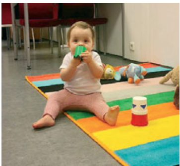
Það er alltaf eitthvað um að vera á Bókasafni Hafnarfjarðar.

Ásvallalaugin er nýjasta laugin í Hafnarfirði en hún var vígð árið 2008. Þar er 50 metra keppislaug auk 17 metra barnalaugar. Laugin er innanhúss og vinsæl hjá barnafólki og sundköppum.