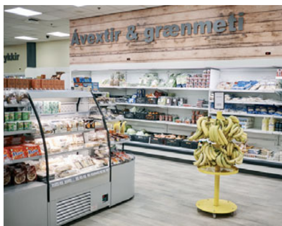
Langur opnunartími og úrval heimilisvara á sanngjörnu verði einkenni Krambúðirnar.