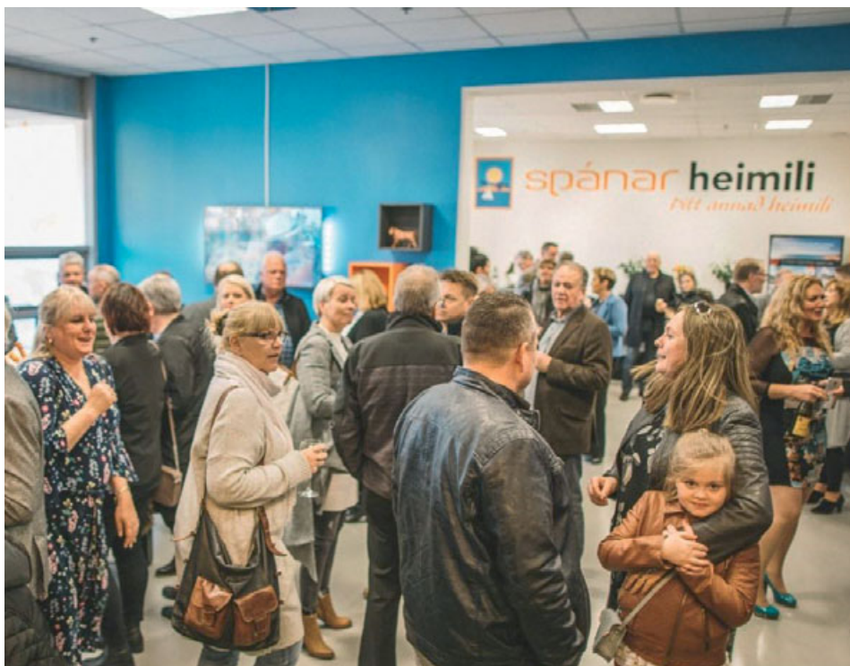
Við opnun nýju skrifstofunnar sem er til húsa í verslunarmiðstöðinni Firðinum í Hafnarfirði.