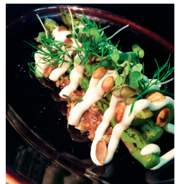
VON er rómað fyrir ljúffengan mat úr fersku hráefni og matarupplifanir sem gleðja alla sem unna góðum mat.

VON mathús og bar er á Strandgötu 75. Sjá vonmathus.is. Sími 583 6000. Netfang: info@vonmathus.is.