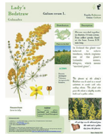
Rafrænt upplýsingaskilti um hina smávöxnu en fögru gulmöðru eða Galium verum.

inna plantna í safndeild íslensku flórunnar í garðinum. Marco Matilla hefur séð um hönnun og