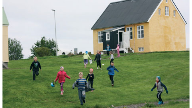
Leik- og grunnskólabörn heimsækja Byggðasafnið í Görðum.

Aðgöngumiði að Þjóðminjasafninu gildir einnig í Safnahúsið við Hverfisgötu sem tilheyrir Þjóðminjasafni Íslands. Allar nánari upplýsingar má fá á vefnum www.thjodminjasafn.is.