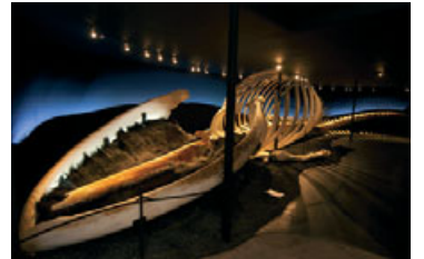
Beinagrind steypireyðarinnar sem Hvalasafnið varðveitir liggur á bakinu líkt og tíðkast þegar hvalshræ rekur á land.

Stóra hjartað á Hvalasafninu er 25 metra löng beinagrind af steypireyði sem rak á land á Skaga sumarið 2010. Beinagrindin er afar fágæt, sú eina á Norðurlöndum og ein af sárafaum í heiminum. Á sýningunni er jafnframt ljósmyndaröð sem sýnir ferlið við að draga hræið á land, hreinsun beinanna og uppsetningu grindarinnar í Hvalasafninu á Húsavík.