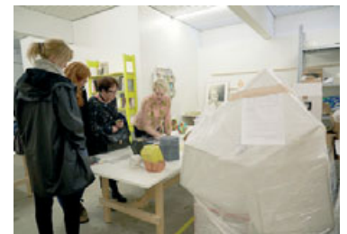
Gestir geta fylgst með þegar hlutir eru teknir upp úr kóssum, ljósmyndaðir og skráðir í safnmunaskrána Sarp.