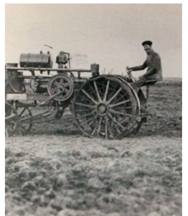
á Hvanneyri má sjá nokkrar af þeim dráttarvélum sem haft hafa mest áhrif á íslenskan landbúnað á liðinni öld.

Vissir þú að í ár eru 100 ár síðan fyrsta dráttarvélin kom til Íslands? Þetta var vél af gerðinni Avery 8-16, framleidd í Bandaríkjunum og var fyrsta vélknúna landbúnaðartækið sem kom hingað til lands. Vélina var einungis 16 hestöfl en vó 2,5 tonn. Hún var kennd við Akranes og nefnd Akranestraktörinn. Með þessari vél var lagður grunnur að tæknivæðingu íslensks landbúnaðar – þar með þurfti færri fólk til að framleiða meiri mat fyrir stækkandi þéttbýli. Á þessum 100 árum hafa dráttarvélnar stækkað og nýtingin aukist til muna – landbúnaður dagsins í dag byggir að stórum hluta á því afli sem dráttarvélar geta skilað af sér. Á Landbúnaðarsafni Íslands