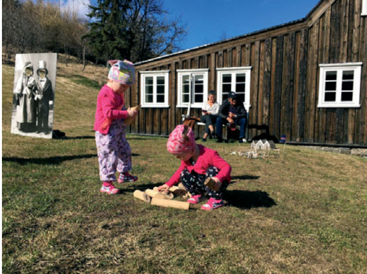
Börn og fullorðnir njóta þess sem Nonnahús og Minjasafnið hafa að bjóða.

Akureyri, bærinn við Pollinn, er sýning þar sem þú stígur aftur í tímann og kynnist bæjarlífinu frá ýmsum sjónarhornum, setur