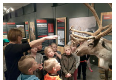
og safnkosti Minjasafnsins eða sögu Austurlands.

Námsefnið er byggt upp þannig að einn námsefnispakki er eyrna-merktur hverjum bekk grunnskólans. Mismunandi umfjöllunarefni eru fyrir hvern árgang en öll tengjast þau á einhvern hátt sýningum