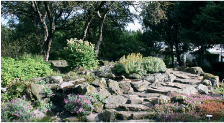
Úr safndeild íslensku flórunnar en í Grasagarði Reykjavíkur eru safngripirnir 5.000 plöntur af 3.000 tegundum.

Lifandi plöntur eru hluti af menningarlandslagi okkar og hefur Grasagarðurinn í samstarfi við Centro Integrado Público de Formación Profesional de Cheste í Valencia á Spáni útbúið rafræn upplýsingaskilti. Upplýsingarnar má nálgast með því að skanna QR-kóða á skiltum val-