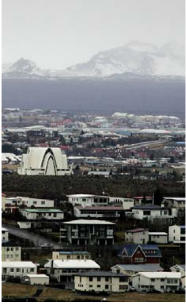
Kópavogur ætlar að styðja við bakið á Pieta samtökunum.