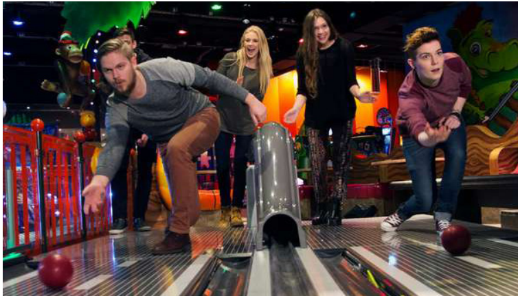
Smáratívolí býður upp á fjölbreytta afþreyingu fyrir unga sem aldna.