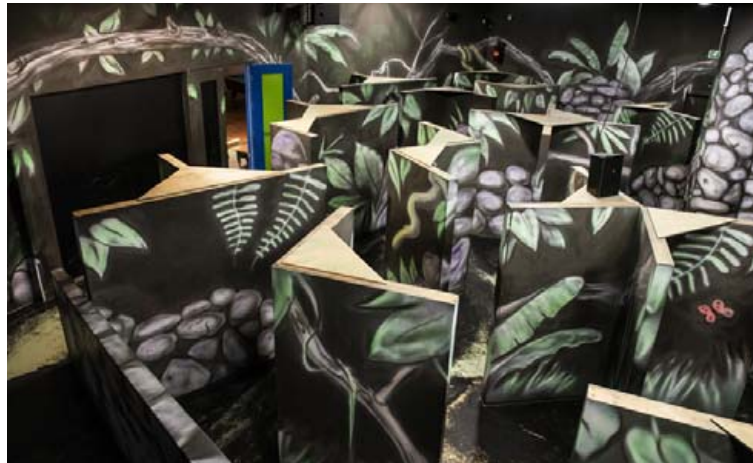
Stærsti lasertag-salur landsins er nú með nýjum tækjum sem eru þau fullkonnustu í Evrópu.

Nýlega var sett upp glæsilegt karókiherbergi í Smáratívolí sem eykur enn á fjölbreytnina þar. „Hópurinn er alveg út af fyrir sig og hægt er að velja á milli 30.000 laga.