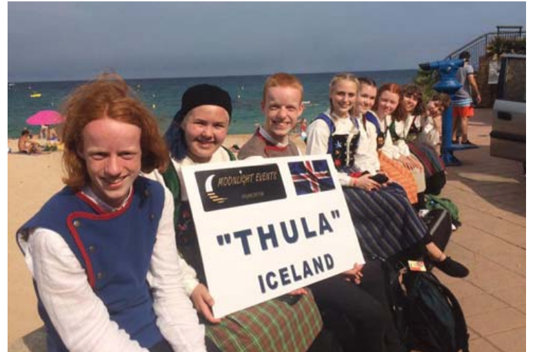
Þjóðlagasveitin Pula er nú þegar viðförlu en hér er sveitin á Spáni í fyrra.