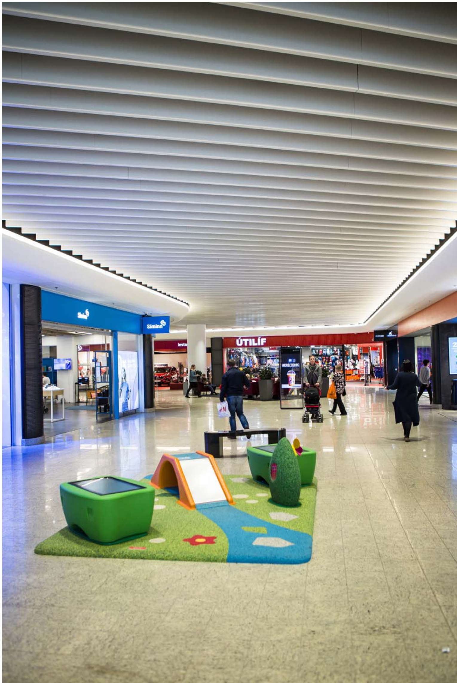
Gestum í Smáralind hefur fjölgað umtalsvert á undanfögnu ári. Margt hefur verið gert til að laða að fleiri verslanir, veitingahús og önnur þjónustufyrirtæki.

„Með tilkomu Íslandsbanka og annarra leigutaka í Norðurtorni Smáralindar hefur starfsemin styrkst og eftir alla þjónustu og verslun í húsinu. Þá hefur Smáralind í samstarfi við Kópavogsbæ og aðra eigendur á svæðinu, sem í daglegu tali er kallað 201 Smári, unnið að því að endurskipuleggja nánasta umhverfi sunnan Smáralindar. Tilgangurinn hefur verið að efla Smáralind og svæðið í