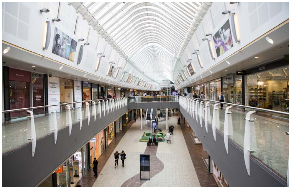
Margar erlendar verslanakeðjur hafa opnað verslanir í Smáralind undanfarið og fleiri eru væntanlegar.

Í kjölfar opnunar H&M opnaði Zara einnig flaggskipsverslun sína á tveimur hæðum í Smáralind og er nú eina verslunin undir því nafni á Íslandi. Þá opnaði hin þekktu O'Learys veitingahúsa-keðja sinn fyrsta veitingastað á Íslandi í austurenda Smáralindar,“ segir Sturla og bætir við að einnig hafi verið sett upp auglýsinga- og vegvísunarkerfi á göngugötu Smáralindar. „Það er gaman að segja frá því að sú hönnun hlaut virt alþjóðleg hönnunarverðlaun fyrir skemmstu. Við leggjum mikið upp úr því að vinna með hönnuðum og framleiðendum á heimsmælikvarða. Það starf hefur skilað okkur miklum ávinningi og betri ásýnd í húsinu öllu.“