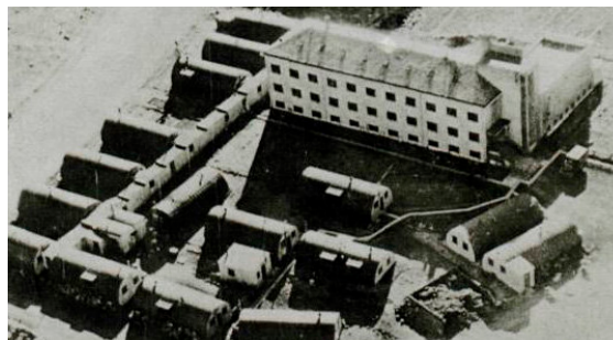
Í seinni heimsstyrjöldinni tóku breskir hermenn Gamla Garð yfir.