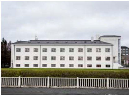
Gamli Garður er virðuleg bygging við Hringbrautina.