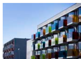
Stúdentaíbúðir við Eggertsgötu.

og húsnæðismálin okkar stærstu mál en þau beintengjast FS. Með starfi FS er búið að búa þannig um hnútana að við getum beitt okkur almennilega út á við fyrir þessum málefnum ásamt fleirum. Á meðan FS sér um að útvega lausnir fyrir betra félagslegt úrræði handa stúdentum varðandi húsnæði og aðra þjónustu á hagkvæmum kjörum, getum við unnið í stefnumótun og tekið meira pláss í samfélagslegri og pólitískri umræðu.