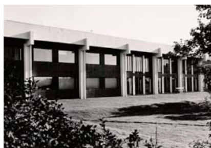
Félagsstofnun stúdenta við Hringbraut eins og hún leit út á árum áður.

takandi á umræðum og stefnumótum um þjóðfélagsmál.