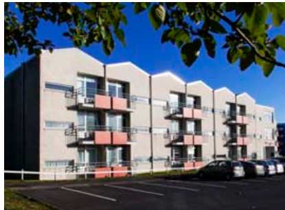
Það er ósk starfsmanna FS að fjölda stúdentaíbúðum á næstunni. Viðræður um þær byggingar hafa farið fram.