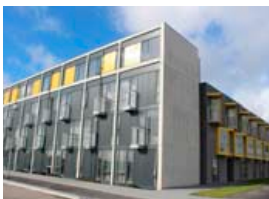
Nýleg bygging stúdentaíbúða í Vatnsmyrinni er hin glæsilegasta.