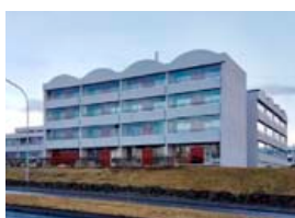
Hjónagarðar hafa leyst húsnæðisvandana margra stúdenta.