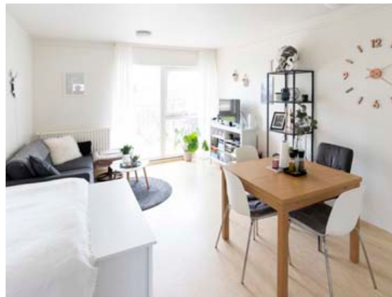
Heimili Lisbetar er bjart og fallett og öllu haganlega fyrir komið.

„Áður en ég flutti að heiman var ég aðeins byrjuð að safna mér í búð, en þurfti svo að kaupa mér eitt og annað. Fyrir þá sem eru að