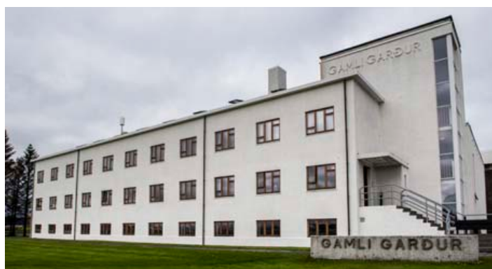
Gamli garður var tekinn í notkun árið 1934. Þar eru nú einstaklingsherbergi.

Hernám Gamla Garðs varð til þess að flýta fyrir ákvörðun um byggingu nýs Garðs og árið 1943 var Nýi Garður víður. Gamli Garður var ekki afhentur aftur fyrr en eftir stríð. Í dag er Gamli Garður stúdentagarður með einstaklings- herbergjum, sameiginlegu eldhúsi, baðherbergjum, setustofum og lestraraðstöðu. Á sumrin er þarna rekið vinsælt farflugheimili.