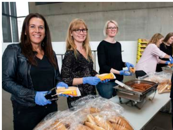
Starsfólk FS bauð upp á pylsur á Háskólastorginu sem runnu ljúflega niður.

Félagssstofnun stúdenta heldur upp á 50 ára afmælið með ýmsum hætti út allt afmælisárið. Í mars var öllum gestum og gangandi boðið upp á fimm metra kökufleka á Háskólastorgi þar sem 1100 kökubitar runnu ljúflega niður í gesti. Í apríl var hent upp frábærri pylsuveislu þar sem 800 pylsum var sporðrennt auk þess sem börn sem búa á Stúdenta-görðum fengu páskaegg. Að auki, í tilefni af afmælinu, kostar bjórin í Stúdentakjallaranum aðeins 50 kall síðasta mánuðag hvers mánaðar og kaffibollinn á Kaffistofum stúdenta og í Hámu einnig 50 kall síðasta föstudag hvers mánaðar yfir skólaárið. Í haust mun FS halda áfram að halda upp á afmælið með ýmsum hætti með tónleikum, uppstandi og öðrum hátíðarhöldum á háskólasvæðinu.