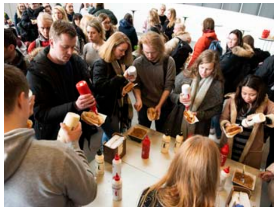
Frábær afmælisveisla sem stúdentar kunnu vel að meta.