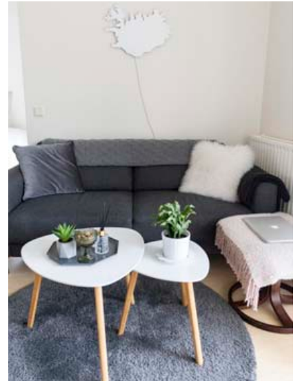
Lisbetu líður hvergi betur en í kósi vistarverunum heima.