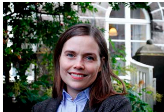
Katrín Jakobsdóttir forsætisráðherra.

Þegar Katrín er spurð um pólitíkina í skólanum svarar hún. „Þetta var mjög aðgerðarífrin pólitík. Ég man þegar við knúðum fram og börðumst fyrir lengdum afgreiðslutíma þjóðarþöklóðunnar. Á þeim tíma lokaði klukkan fimm á daginn en við vildum að opið yrði til kl. 22. Breytingin kostaði auðvitað fjármuni. Við fengum þetta ekki í gegn með hefðbundnum aðferðum þannig að stúdentar fóru í setuverkfalli. Það var nokkuð óvænt aðgerð því allt í einu streymdi að fólk á safnið sem nýtti sér Bókhlöðuna litíð sem ekkert. Við mættum klukkan fimm, sátum til tíu og fórum hvergi. Það varð til þess að auknu fjármagni var veitt í þetta verkefni og afgreiðslutíminn lengdur til tíu og þannig hefur það verið síðan,“ útskýrir Katrín og má segja að stúdentar hafi unnið sitt stríð þarna. „Þetta var magnaður og hressandi tími. Það voru sömuleiðis harðar umræður á þessum árum um hvort setja ætti skólagjöld í Háskóla Íslands og var hart tekið á í háskólaráði. Það varð ekki úr því. Maður var því svolítið í hringið viðburða,“ bætir hún við. Á sama tíma stóðu stúdentar