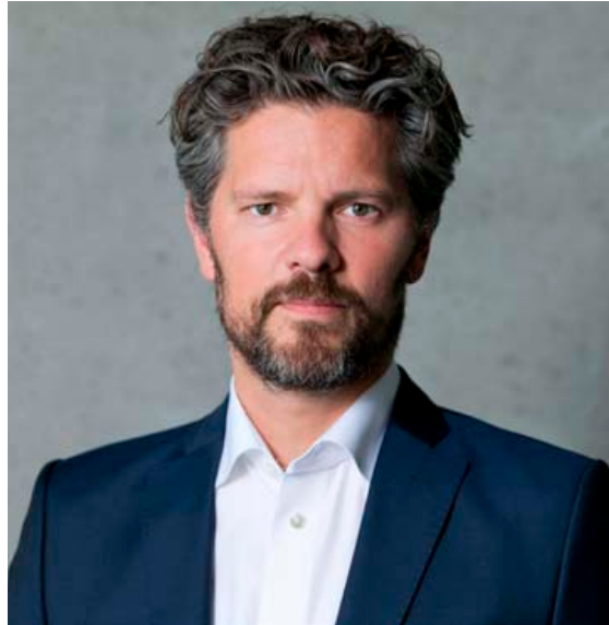
Dagur B. Eggertsson borgarstjóri.

„Það var oft tekist á í stúdentapólitíkinni á þessum tíma. Við sem vorum í þessu atí á námsárunum getum hlegið núna að ýmsum deilum sem upp komu. Talsvert var tekist á um það sem við kölluðum hjarta háskólans. Við töldum að það þyrfti að sameina háskólasvæðið og búa til hjarta. Í rauninni er málið náskýlt hugmyndinni