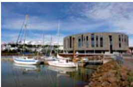
Það verður mikið um að vera í höfuðstað Norðurlands á sjómanna-daginn, líkt og hefð er fyrir.

Það eru Faxaflóahafnir og Sjómannadagsráð sem standa að baki hátíðinni.