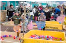
Það er alltaf líf og fjör á Hátíð hafsins.