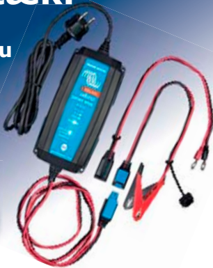
12V/15A blue power charger frá victron energy

25% afsláttur í júní meðan birgdir endast