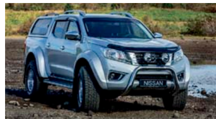
NISSAN NAVARA AT35