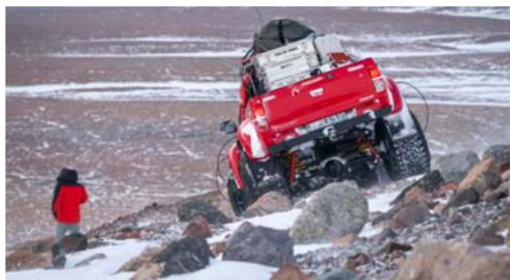
Vel klyfjaður bill fyrir 5.000 kílómetra leiðangur.