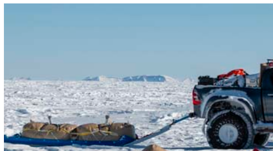
Eldsneytisblöðrun voru dregnar eftir endilöngum jöklinum.

» Leiðangurinn í heild telst til tímamóta í ferðum á bílum um Grænlandsjökul og í fyrsta skipti sem þetta er gert. Farið var fimm sinnum lengra en nokkur annar bilaleiðangur hefur farið á Grænlandsjökli og er enn ein fjöðrin í hatt Íslendinga.