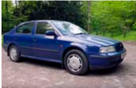
Skoda Octavia 1998 árgerð.