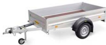
750kg kerra, gerð 1376, mál: 205x131x35cm, opnanleg að framan. Verð kr. 169.355,- án vsk.