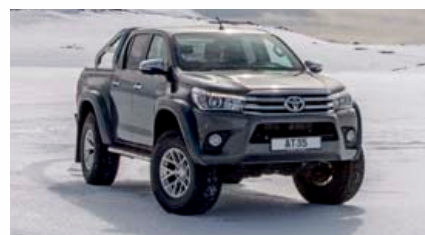
TOYOTA HILUX AT35

Arctic Trucks býður AT35 lausnir fyrir margar tegundir bíla. Lausnin er frábær kostur fyrir þá sem vilja öflugan bíl til fjallaferða að sumri en auk þess aukna drifgetu í snjó. Arctic Trucks kemur þér örugglega í fríð allan ársins hring! Verð frá kr. 1.850.000,-