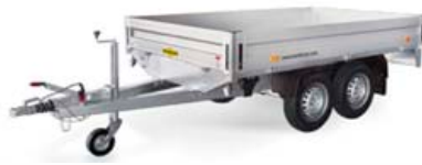
Flatvagnar-ýmsar stærðir, 2000kg-3500kg, mál frá 2,65x1,65m til 6,10x2,48m.