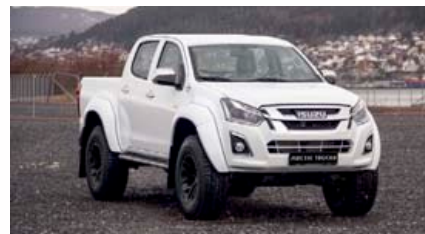
ISUZU D-MAX AT35