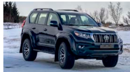
TOYOTA LC150 AT35