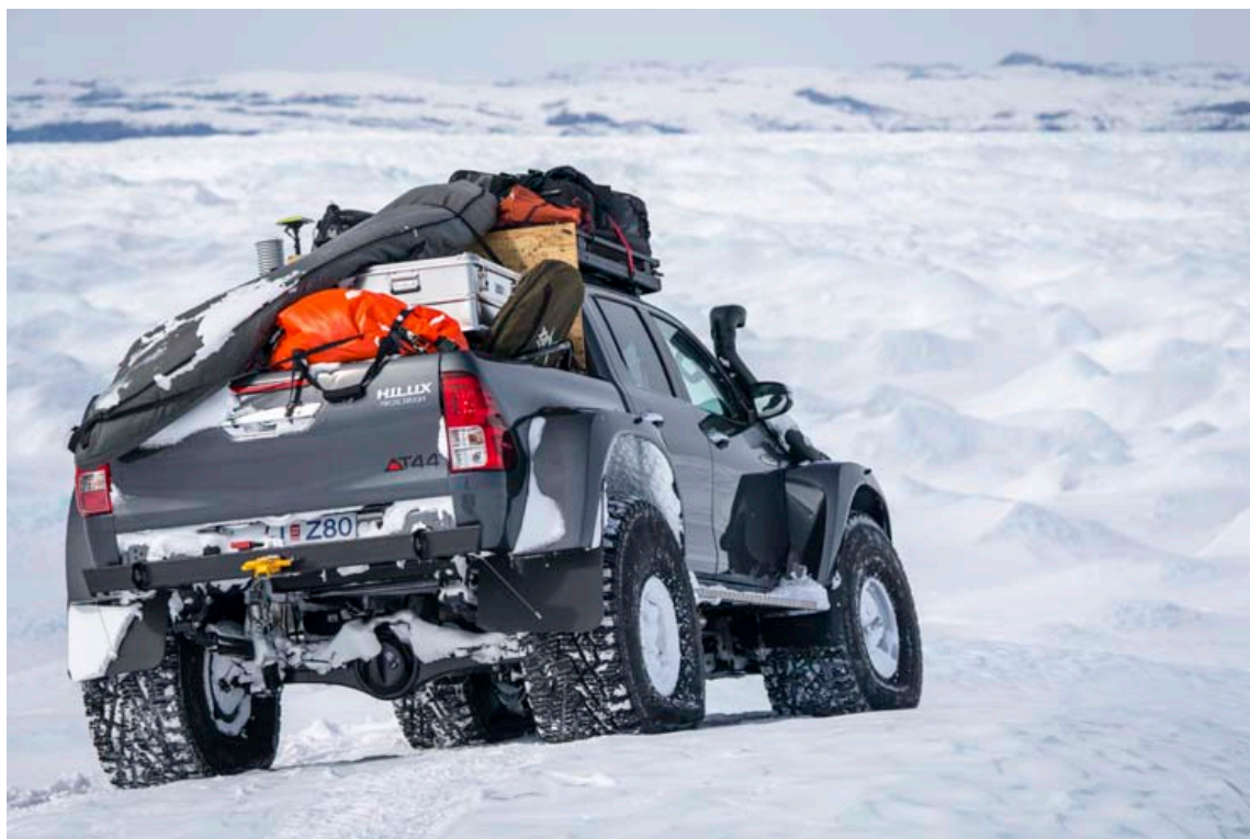
Gríðalega mikill farangur er nauðsynlegur í svona langferðir.

Jökulröndin í upphafi ferðar var bæði skorin og sprungin og því þurfti að þræða hárfina leið þar til komið var vel upp á jökul. Þegar upp var komið voru sleðarnir með eldsneytisblöðrunum tengdir