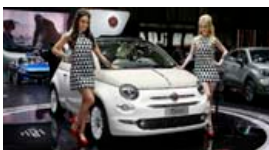
Fiat 500 og fögur fljóð.

Þessi fyrsta árgerð Skoda Octavia af árgerð 1998 með 1,9 lítra disilvél fór 1.298 km leið um daginn á milli London og Nürburgring-brautarinnar í Þýskalandi og til baka. Octavia-bíllinn er með 60 lítra tanki og það dugur honum til að komast næstum allan hringinn kringum Ísland samkvæmt þessu. Eyðsla bílsins á þessari leið um evrópska vegi var 3,8 lítrar, enda var tankurinn ekki tómur á leiðarenda. Þessum tiltekna Skoda Octavia bíl hefur verið ekið 695.000 kílómetra og virðist eiga nóg eftir. Ferðin á milli London og Nürburgring brautarinnar tók 24 klukkustundir og ímynda má sér að þreyttir bílstjórar hafi stigið út úr bílnum á leiðarenda. Tilgangur ferðarinnar var að sýna hversu litill eyðsla þessa bíls er og að gamlir bílar þurfi ekki að vera úr sé gengnir eða að eyðsla þeirra hafi aukist að ráði með aldrinum. Það voru starfsmenn CarThrottle bílavefsíðunnar sem gerðu sér þetta að leik.