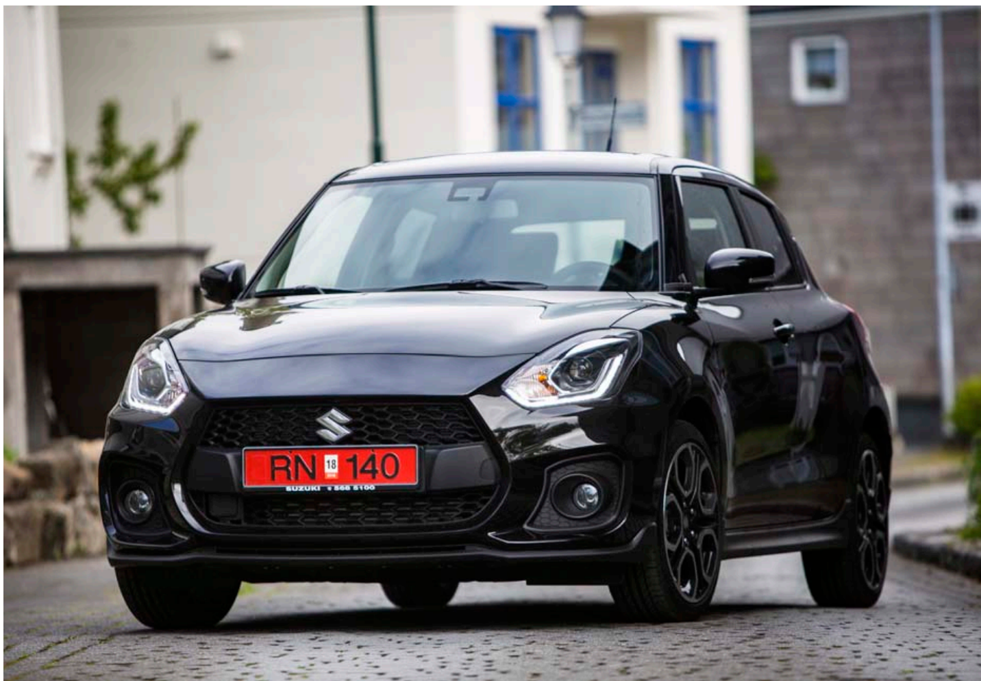
Suzuki Swift Sport er með fallegri smábílum og með þeim allra skemmtilegustu í akstri.