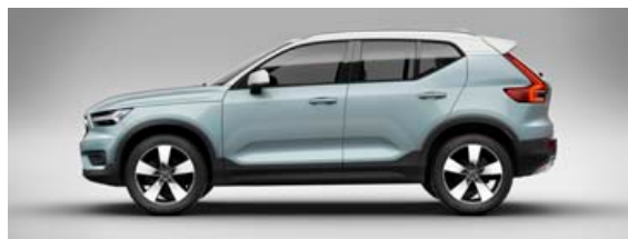
Volvo XC40 jepplingurinn.