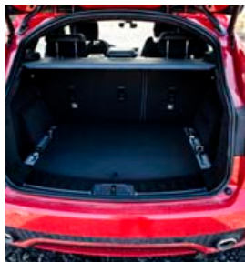
Vélbúnaðurinn sem í boði er í E-Pace er æði fjölbreyttur, þrjár díslvélar, 150, 180 og 240 hestafla og tvær bensínvélar, 250 og 300 hestafla. Allar eru þær af nýrri Ingenium gerð og afskaplega skilvirkar.

Vélbúnaðurinn sem í boði er í E-Pace er æði fjölbreyttur, þrjár díslvélar, 150, 180 og 240 hestafla og