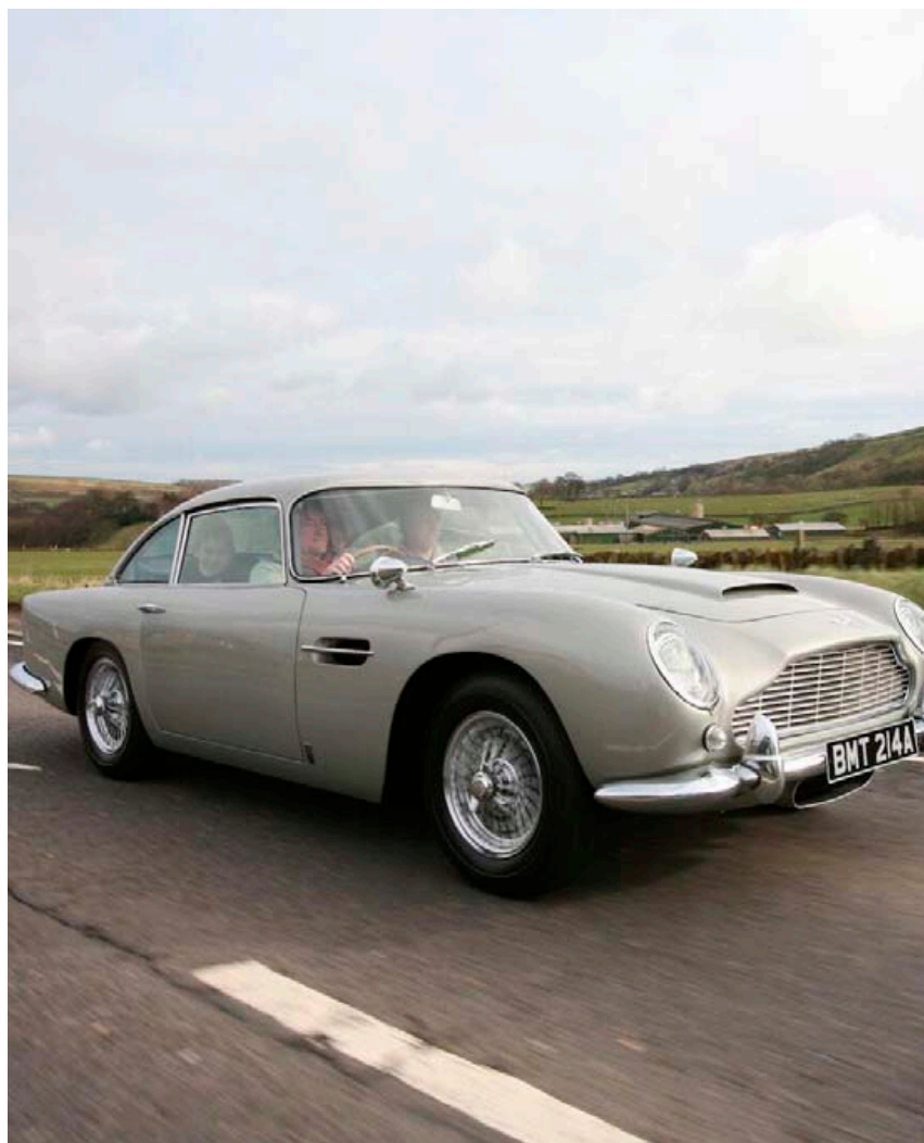
Líklega verður barist um þennan bíl á uppboði í næsta mánuði.

istration) í Bandaríkjunum og fleiri stofnanir hafa kallað eftir lausn frá bílaframleiðendum vegna þessara alltof tíðu dauðsfalla en það hefur engu skilað enn nema í viðvör-unartexta sem fylgir bílunum við kaup. NHTSA hefur einnig bent á það að lélegir snertiskjárir í mælaborðum bíla eigi líka sök á mörgum dauðsföllum á bandarískum vegum, sem og rafrænar beinskjaptingar á stýri margra bíla. Þar á bæ vilja menn meina að mikið af nýrri tækni hafi komið í bíla án þess að gætt hafi verið að öryggismálum við notkun þeirra. Einhver dæmi eru um að skyldmenn þeirra sem látið hafa lífið sökum bíls með ræsihnappi og dáið hafa af koltvisyringseitrum hafi farið í mál við bílaframleiðandann, en fáar sögur fylgja af árangrinum.