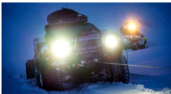
Það urðu margar hindranir á vegi leiðangursmanna en úr öllu var leyst.