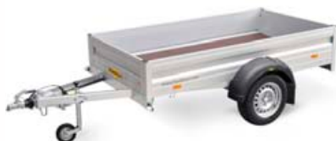
750kg kerra, gerð 1374, mál: 251x131x35cm, opnanleg að framan. Verð kr. 201.612,- án vsk.