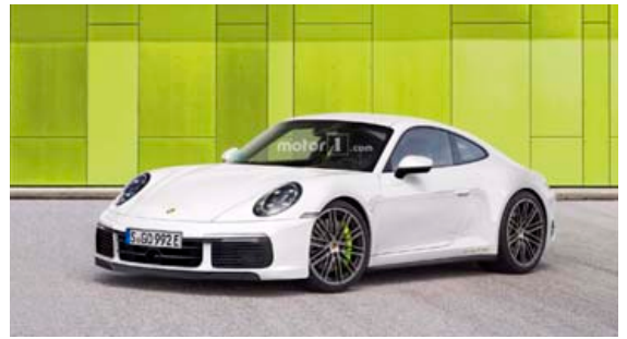
Porsche 911 gerðunum fjölga um tvær.

þessar tvær nýju gerðir fyrst koma með nýrri kynslóð 911 bílsins, svo einhver bið verður eftir þessum bílum.