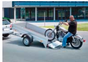
750kg kerra, gerð 1384, mál: 251x131x35cm með sturtum. Verð kr. 229.839,- án vsk.