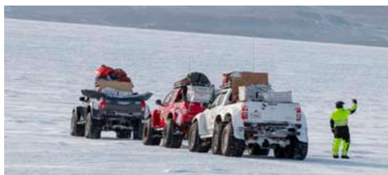
Þrjú sérútbúinir Toyota Hilux bílar voru með í ferð.