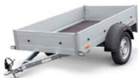
Startrailer 750kg, gerð 1280, 205x109, mál: 5x30cm. Verð kr. 120.888,- án vsk.

Íðnaðarmenn, verktakar og aðrir, kerrurnar frá HUMBAUR hafa margsannað sig á Íslandi, stórar sem smáar