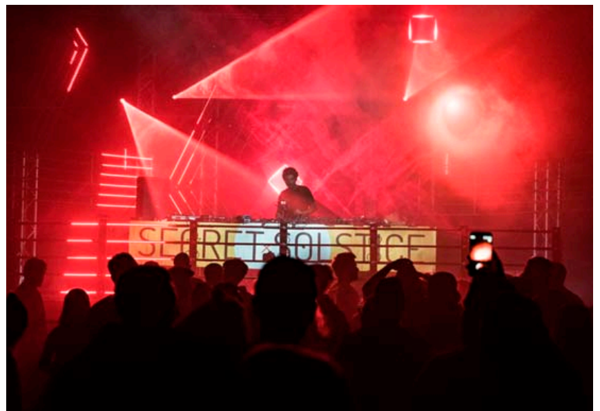
Mörg þekkt nöfn koma fram á Secret Solstice um næstu helgi og það verður dúndurfjör.

að skipta gjaldreyri eða leita uppi í hraðbanka til að verða sér úti um pening. Fyrir utan það þá auðveldar þetta þeim sem selja vörur og veitingar á svæðinu bókhald sitt og umstang.