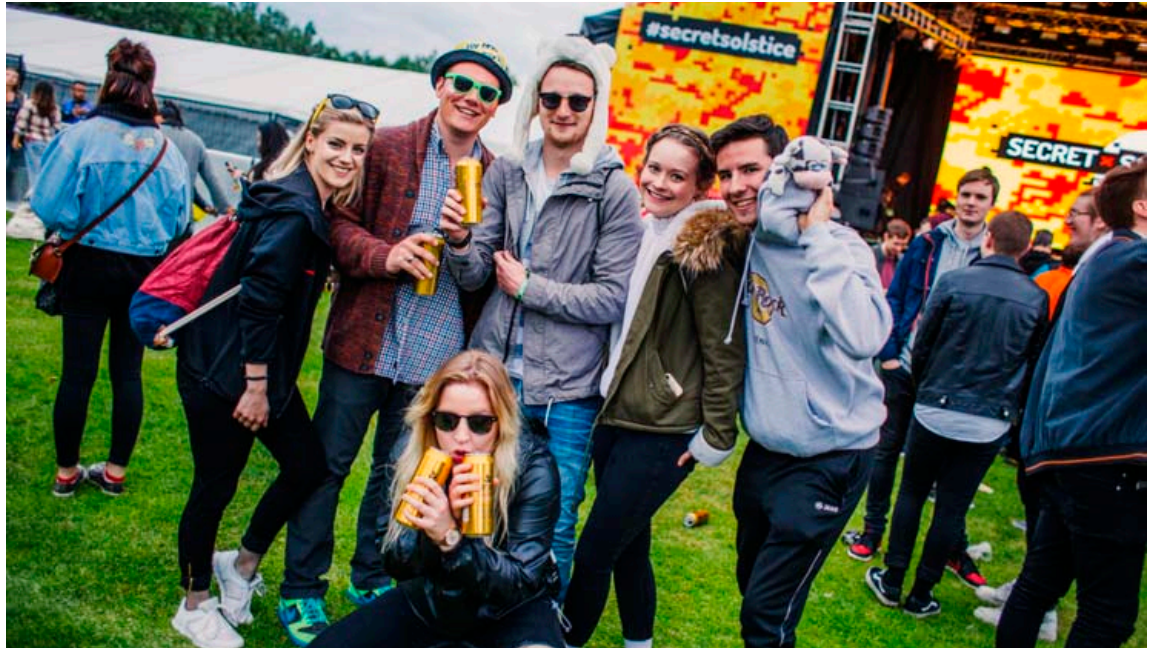
Það eru allir glaðir á úthátíð í Laugardalnum. Nú þarf ekki einu sinni að vera með pening á sér til að kaupa veitingar.

Þetta er í fyrsta skipti sem þessi leið er farin á íslenskrá tónlistarhátíð en hún hefur reynst afskaplega vel á hátíðum víða um heim. Skipuleggjendur hátíðarinnar segjast hafa skoðað fyrirkomulagið erlendis og séð í því ýmsa kosti sem framsækin hátíð á borð við Secret Solstice ætti að bera. Til dæmis er aukíð öryggi fylgið í því að greiða með armböndunum en einnig viss þægindi, sérstaklega fyrir þá sem sækja hátíðina frá öðrum löndum. Þeir þurfa þá ekki að hugsa um