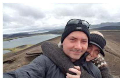
Nýgift í fögru umhverfi Veiðivatna, sem er engu öðru líkt.