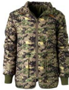
Sherpa Veiðijakki 2 flíkur í einni! Stærðir L - 4XL Verð aðeins 12.994 kr