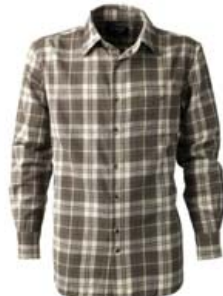
Bómullarskyrtur 4 gerðir Stærðir S - 4XL Verð frá 6.035 kr