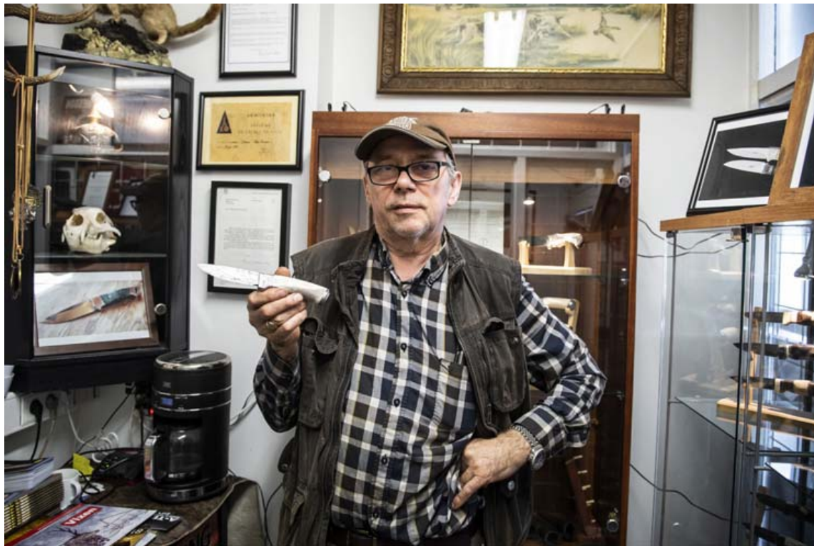
Jói smiðar einstaklega sterka og fallega hnifa úr sænskum gæðastáli og íslenskum hreindýrshornum. Þeir eru einkar vinsælir í veiði.

„Í náminu fór ég líka að smíða hnifa og gerðist meðlimur í Félagi belgískra hnifasmíða. Því fer ég enn oft utan til að taka þátt í sýningum með þeim og næst nú í