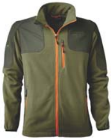
Flíspeysur Nokkrir litir og gerðir Stærðir S - 4XL Verð frá 5.995 kr

Mike Hammer, nýr fatnaður fyrir veiðimenn og útivistarfólk. Peysur, úlpur, skyrtur og fleira!