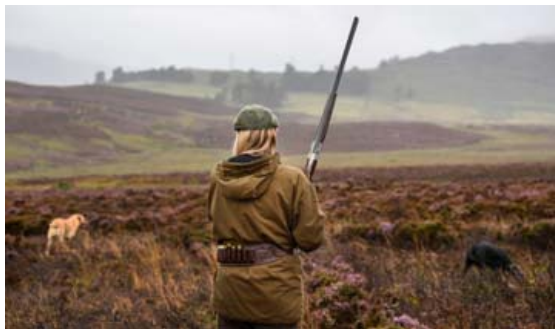
Gæsveiðitímabilið hefst á mánudaginn.

Eflaust eru einhverjir farnir að huga að jólamatnum en Umhverfisstofnun hefur nú þegar gefið út hvaða daga rjúpnaveiðir verða leyfilegar þetta árið.