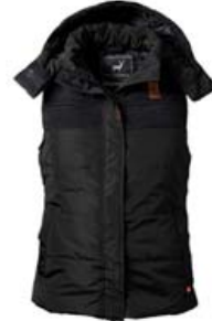
Vesti með hita Stærðir S - 4XL Verð aðeins 17.995 kr