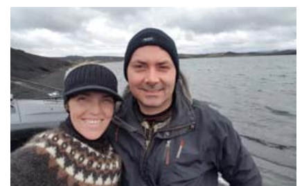
Hjónunum finnst gaman að veiða þar sem er veiðivon.