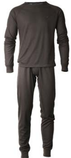
Vetrarundirföt Stærðir S - 4XL Verð frá 5.695 kr