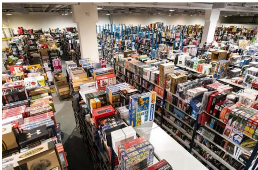
Á lagernum er notast við hugmyndafræðina „chaotic storage“, eða handahófskennd röðun.