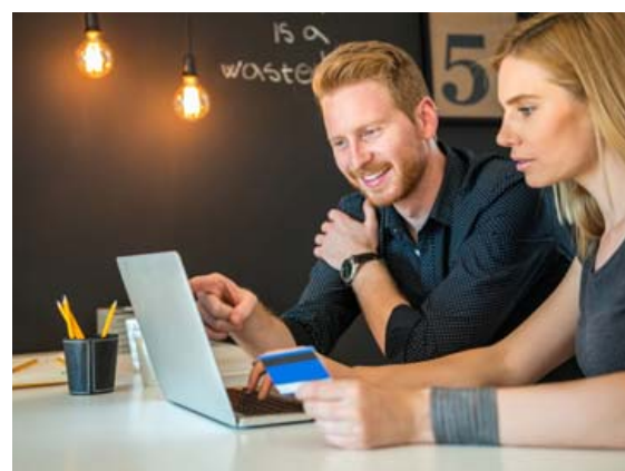
Öryggisins vegna á aldrei að senda viðkvæmar upplýsingar, svo sem kreditkortanúmer, í tölvupósti. Einnig er mikilvægt að skoða vel alla skilmála.

Eru gjöld hærrí en verðið? Áður en vara er pöntuð á netinu