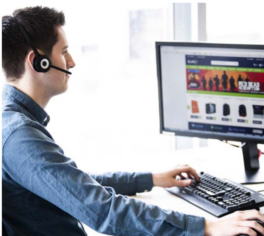
Starfsfólk elko.is sinnir viðskiptavinum sínum í síma 575-8115 og einnig í netspjalli sem nýtur sífellt meiri vinsælda.