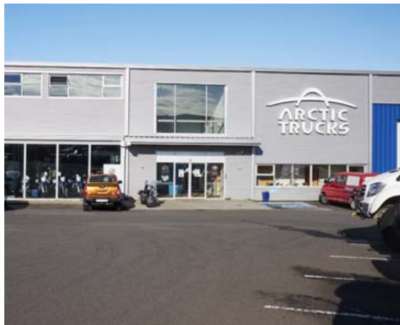
Þjónustuverkstæði Arctic Trucks var opnað að Kletthálsi 3 um áramótin.