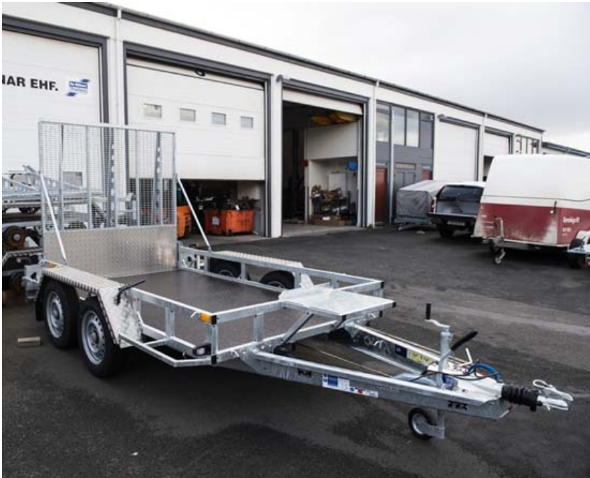
Nýr og glæsilegur lfor Williams vélavagn er afar þægilegur í notkun og hentar fyrir flestar gerðir smærri véla.