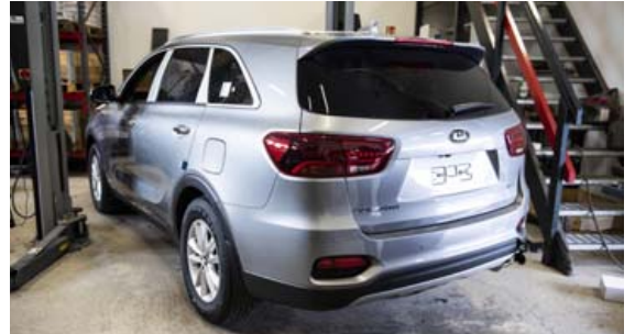
Nýinflutt bífreið komin í smiðju Vikurvagna þar sem hún fær dráttarbeiði.