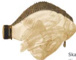
Skarskólpi Kíppis Kíppus