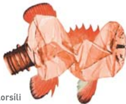
Slorsíli Úrgangus Ópólandís