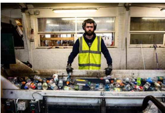
Hver flaska skiptir máli þegar kemur að endurvinnslu dósar og plastumbúða.