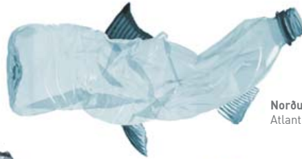
Norðursjávar Kóli Atlantic Cola

Marine bottles of Iceland | Flaschen im isländischen Meer