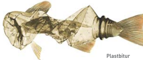
Plastbítur Virus Plastikus