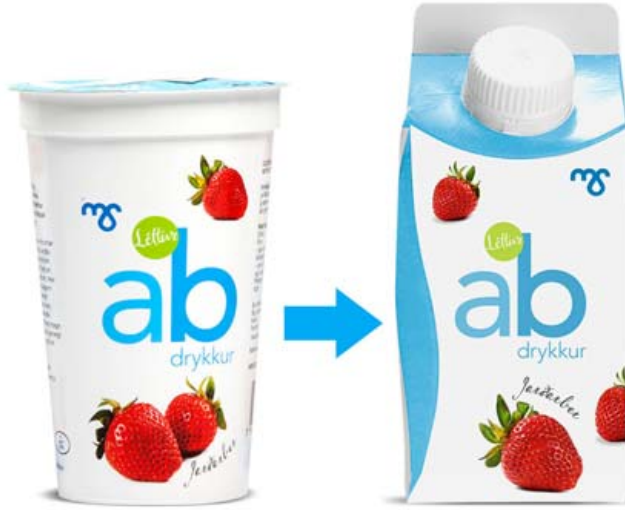
Drykkir í plastdósum á borð við KEA skyrdrykk, jógúrdrykk og ab-drykk voru færðir í umhverfisvænar pappaförum.