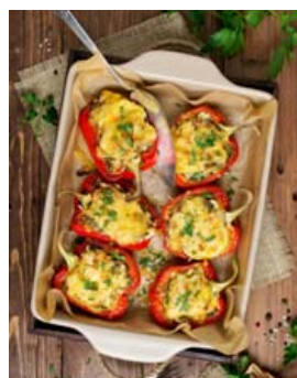
Fyllt paprikurnar eru yndislegar.

2-3 stk. paprikur, blandaðir litir 2 stk. tómatar, skornir í smáa bita ½ stk. rauðlaukur, fint skornir 50 g ólífur 100 g fetastaur í teningum 1 dl hvítvín (má sleppa en er mjög gott) 2 stk. brauðsneiðar, rífnar gróft Pipar eftir smekk