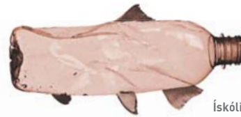
Ískóli Plastus Vesenis