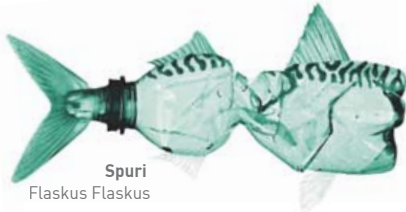
Spuri Flaskus Flaskus