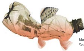
Maghnútur Sodapop Virus