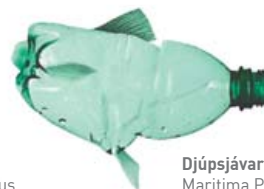
Djúpsjávar lufsi Marítima Polyurethane

Ef plastnotkun þróast áfram eins og hún er í dag þá er því spáð að árið 2050 verði jafnmikið af plasti og fiski í höfunum í kílóum talið. Leggðu þitt af mörkum og tryggðu að allar drykkjarumbúðir á þínu heimili skili sér í Endurvinnsluna. Þannig leggur þú þitt af mörkum og færð greitt fyrir það!