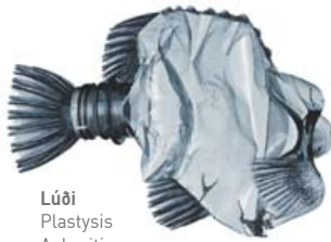
Lúði Plastysis Aukreitís