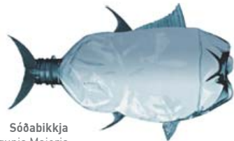
Sóðabikkja Mengunis Majoris