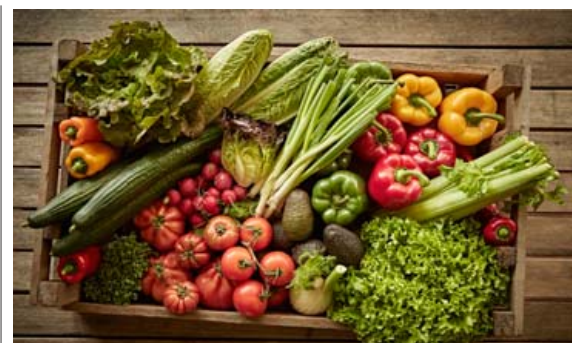
Það er lítið mál að elda dýrindis rétti úr flestu grænmeti sem safnast hefur saman í ísskápnum, t.d. súpur, pottrétti og salöt.

Ein stór baka fyrir 8-12 manns 1,6 kg grænmeti, t.d. setar kartöflur, grasker, gulrætur, seljurót,