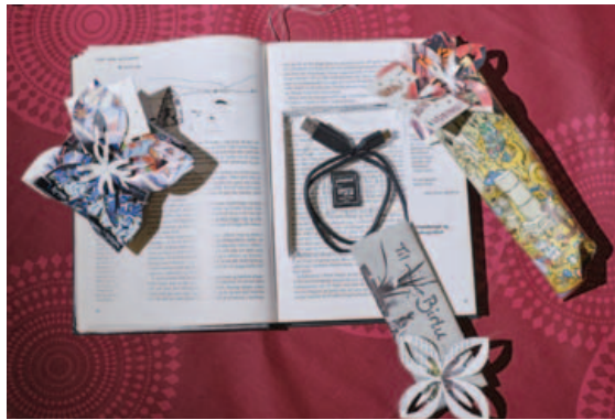
Sniðug hugmynd og skrautlegir jólapakkar Estherar.

umstangið fyrir jólna og á vistvænan og hlýlegan hátt. Með þeim mæla jólasveinarnir með að fjölskyldan sé saman og stingur upp á skemmtilegri samverustund sem fellur í