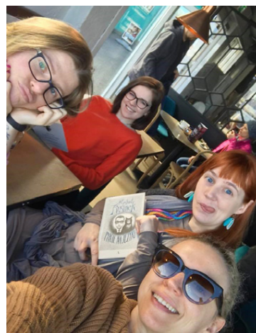
Hópur kennara frá Varsjá bregður á leik eftir vikulangt ritlistarnámskeið hjá Björgu í Reykjavík.

sem stígur inn í heim ævintýrisins, mætir þar ögrunum og hindrunum, deyr táknrænum dauða, endurfæðist, vinnur sigra, öðlast gjafir og snýr sem umbreytt manneskja aftur til fyrri veruleika.“