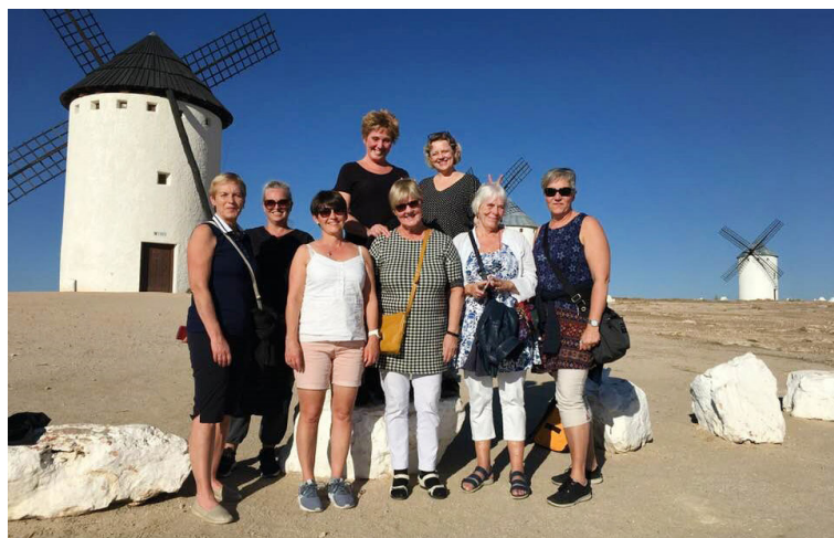
Haustið 2018 stóð Stílvopnið ásamt ferðaskrifstofunni Mundo fyrir ritlistarnámskeiði á slóðum Don Kíkóta í nágrenni Madrídur.