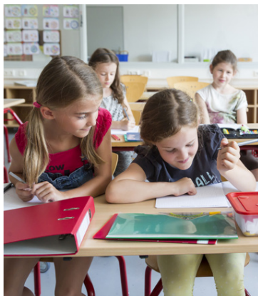
Prófessor í Noregi segir að mun meiri aga og aðstoð þurfi á börn í sex ára bekk í dag en var fyrir 25 árum.