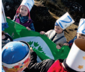
Áhersla er lögð á þátttöku nemenda.

Verkefnið hefur vaxið jafnt og þétt frá því að það hóf göngu sína hér á landi árið 2000, en tæpur helmingur leik-, grunn- og framhaldsskóla um allt land er nú þátttakandi.