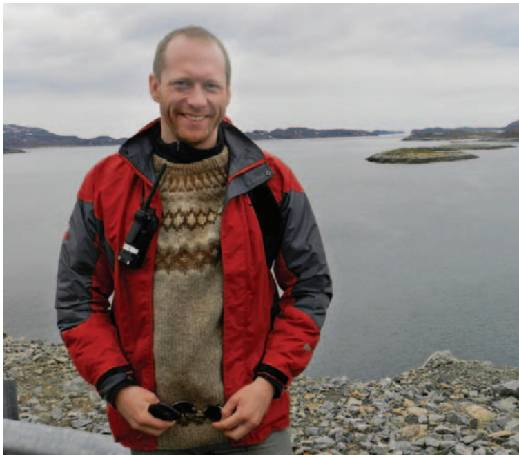
Guðmundur Ingi Guðbrandsson í Nuuk á Grænlandi en ráðherra kann alltaf best við sig í lopapeysunni úti í náttúrunni, hérlendis sem erlendis.

Aðrir merkir samningar hafa einnig verið gerðir sem miklu máli hafa skipt fyrir umhverfis- og náttúruvernd. Þar má nefna samning SP um eyðimerkurmyndun og vernd líffræðilegrar fjölbreytni, Montreal-bókunina um verndun ósonlagsins og Árósasamninginn um rétt almennings til þátttöku þegar kemur að ákvarðanatöku um umhverfismál. Þá hafa einnig komið fram mikilvægar meginreglur í alþjóðlegum umhverfisrétti: Varúðarreglan og mengunar-bótareglan. Allir þessir samningar hafa haft mikil áhrif á umhverfis- og náttúruverndarlöggjöf hérlendis, á viðhorf fólks og umgengni við náttúruna.