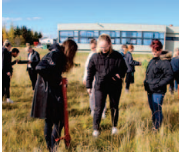
Nemar við MH komu að I SEE verkefninu sem er styrkt af Erasmus+.