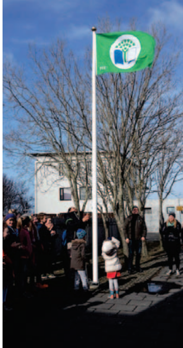
Mikilvægt er að virkja skólasamfélagið og ýta undir sjálfbærni.