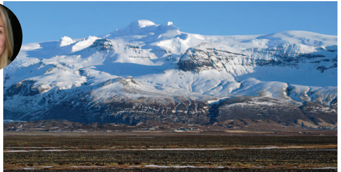
Hvannadalshnúkur í Örfæfaveit lokkar og laðar vegna ósnortinnar náttúru.