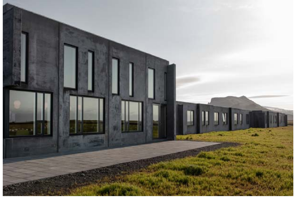
Húsið þykir falla vel inn í umhverfið en frá hótelinu sést bæði til fjalla og niður að sjó.