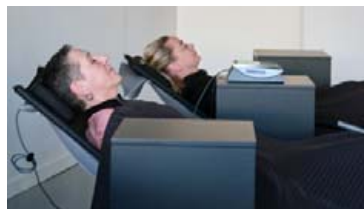
Það er einstakt að geta boðið upp á þjónustu sem svo margir græða á að stunda.

OsteoStrong byggir á einstakri nýrri tækni sem byrjað var að nýta utan Bandaríkjanna árið 2018. „Við erum fjórða landið fyrir utan Bandaríkin til þess að opna svona stöð. Það hefur komið okkur á óvart hvað meðlimir okkar eru vel lesnir. Ein þeirra hafði þegar stundað OsteoStrong og farið