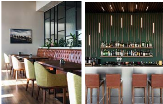
Veitingastaður hótelsins hefur fengið góða dóma.

„Þetta hefur gengið framur vonum. Síðasta sumar var alveg frábært og svo hefur veturinn verið með finasta móti.“