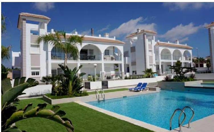
Íbúðirnar í Dona Pepa eru sívinsælar enda afar fallegar.