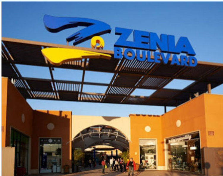
La Zenia Boulevard er vinsæl verslunarmiðstöð.

Áður fyrr var það helst eldri fólk sem keypti sér fasteignir erlendis en í dag eru viðskiptavinirnir mun fjölbreyttari hópur. „Þar má t.d. nefna fólk á ýmsum aldri sem glímur við margvísleg heilsufarsvandamál, enda loftslagið einstaklega gott og fólk finnur fyrir aukinni vellíðan og minna stressi. Einnig færirst í vöxt að fólk kaupir eignir á Spáni til að fjárfesta. Þá eru eignirnar nýttar hluta úr ári og síðan leigðar út.