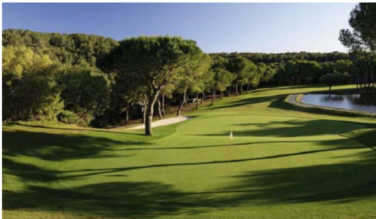
9. hola á Las Ramblas er í uppáhaldi hjá mörgum golfurum.