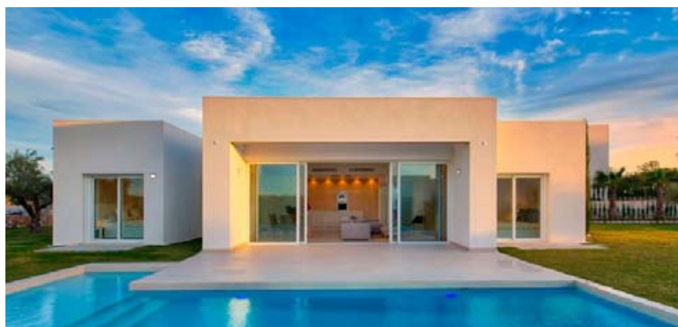
Vinsæl einbýlishús við Las Colinas golfvöllinn.

„Nú er gott framboð á beinu flugi allt árið frá Keflavík til Alicante og það kemur sér vel. Veðurfar á þessu svæði er líka einstaklega gott, að meðaltali 300 sólar dagar á ári.“