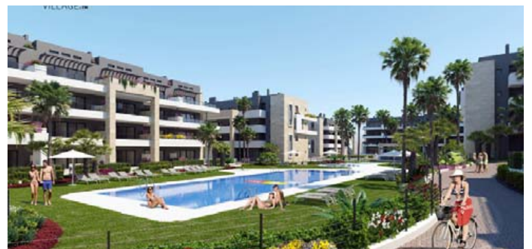
Flottar íbúðir á frábærum stað í Flamenca Village.

mikilvægt að fá aðstoð fagfólks svo allt gangi vel upp. „Við aðstoðum við allt ferlið frá upphafi til enda. Allt frá því farið er yfir kaupóskir, staðarval og skipulag á skoðunarferðum, þar til skrifad er undir kaupsamning, lykklar afhentir og afsal gefið út. Einnig tökum við þátt í kostnaði vegna skoðunarferða og endurgreiðum allt að 120.000 kr. þegar fólk kaupir eignir hjá okkur.“ Hún segir starfsmenn leggja áherslu á persónulega þjónustu fyrir hvern og einn. „Þannig erum við t.d. ekki mikið að skipuleggja hópferðir til að skoða eignir á Spáni. Þarfir