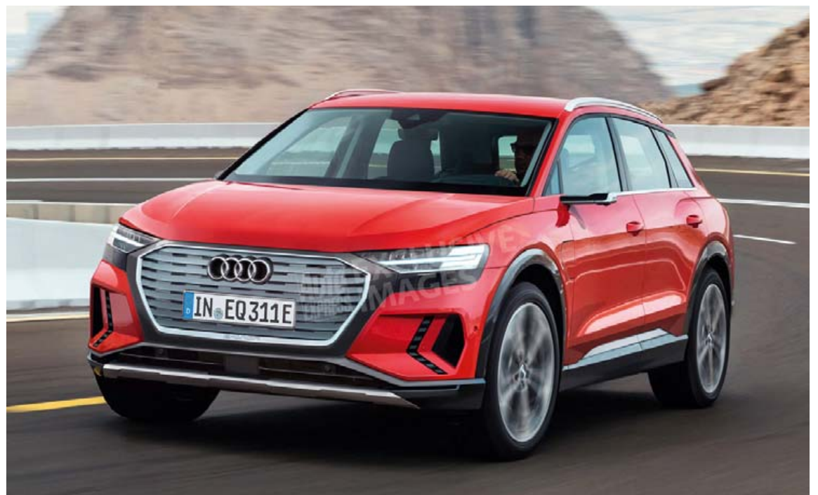
Audi hefur nú þegar sent frá sér þessa mynd af tilvonandi rafmagnsjepplingi.

seint mun teljast annað en jepplingur. Aðspurðir segja Volvo menn að ekki standi til að bæta enn minni jepplingi við bílaflóru Volvo til að reyna að auka sölu og fylla í öll hugsanleg göt hvað bílgerðir varðar. Að sjálfsögðu verður gert ráð fyrir því að nýr V40 verði að hluta til knúinn rafmagn og því hafi hærri bíll verið heppilegri en lengri eða stærrí og með því komist rafhlöðurnar fyrir. Því er hér kominn enn einn valkosturinn í sístækkandi flóru jepplinga, en það er víst það sem markaðurinn virðist kalla eftir.