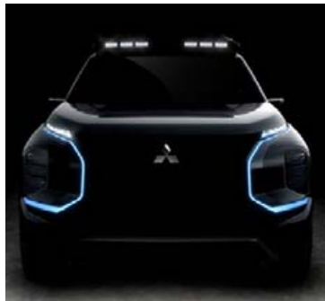
Stríðnimynd af jepplingnum.

Það var líklega bara tíma-spursmál hvenær bílaleigur heimsins byðu Lamborghini Urus jeppann til láns fyrir aðdáendur ofurjeppa og þrjár bílaleigur vestur í Bandaríkjunum hafa riðið á vaðið. Þar geta bílaáhugamenn kynnst þessum 641 hestafls jeppa sem fer sprettinn í hundradíð á litlum 3,6 sekúndum en það kostar sitt. Dagurinn kostar 1.308 dollara, eða 155.000 krónur. Það er ekki lítið fé þegar haft er í huga að hæglega er hægt að leigja sér bíl fyrir tíu þúsund kall á dag. En allt fyrir upplifunina og vonandi munu þeir sem leigja sér bílinn njóta þess, en þessi bíll er jú eini bíll Lamborghini sem ekki er hræddur við að verða skitugur.