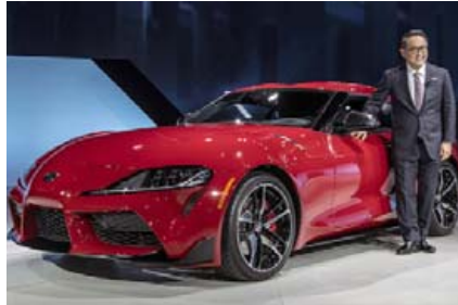
Toyota Supra á bílasýningunni í Detroit.

Nokkuð hefur dregið úr fjölda gesta á stærstu bílasýningum heims síðustu árin og það gerðist einnig á þeirri síðustu, þ.e. Detroit Auto Show nú í nýliðnum janúar. Féll aðsóknin um rúm fjögur prósent, en 774.179 gestir mættu á sýninguna, en gestirnir árið áður voru 809.161. Þrátt fyrir að nokkrar spennandi frumsýningar á goðsagna-kenndum bílum hafi verið í Detroit, svo sem á Toyota Supra og Ford Mustang Shelby GT500, þá dugði það ekki til að þessu sinni, en rétt er að minnst þess að margir af þekktari bíla-