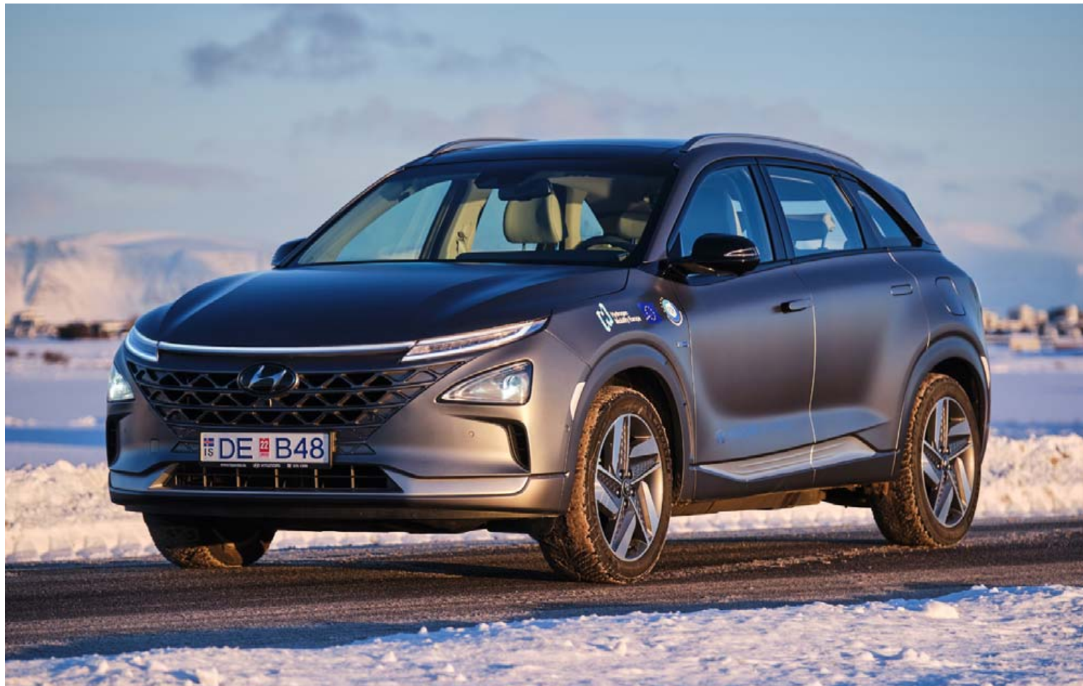
Hyundai Nexu vetnisbíllinn er bæði laglegur að utan sem innan, hlaðinn nýjustu tækni og umfram allt frábær akstursbíll.