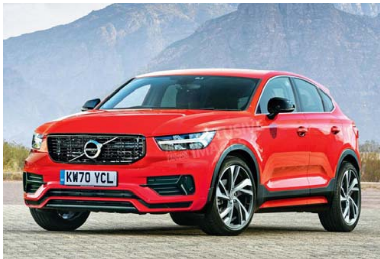
Svona gæti nýi billinn lítið út.

aukningu á sölu hjá Lamborghini í ár, í kjölfar 51% aukningar í fyrra. Ferrari hefur áður lýst því yfir að fyrirtækið hafi takmarkað eigin framleiðslu við 7.000 bíla, en allar líkur eru þó á því að framúr því hafi verið farið í fyrra og að framleiðslan hafi náð yfir 9.000 bílum. Ferrari hefur ekki enn birt sölutölur frá því í fyrra. Þau eru nokkuð ófundaverð vandamálin sem Lamborghini og Ferrari glíma við þessa dagana.