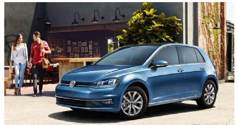
Söluhæsta einstaka bílgerðin í Evrópu í fyrra var Volkswagen Golf.

Sala umhverfismildra bíla jókst um 28% og nam í heild 944.800 bílum, en var 737.400 árið 2017. Sala bíla