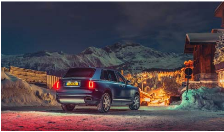
Rolls Royce Cullinan í ægifygru landslaginu í Courchevel.