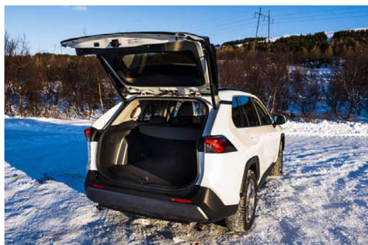
Skottrými RAV4 hefur stækkað um 79 lítra á milli kynslóða.

Fimmta kynslóð RAV4 er gerbreyttur bíll frá 4. kynslóð hans og geysimiklar jákvæðar breytingar hafa orðið á honum. Fyrir það fyrsta er hann nú orðinn mjög lag-