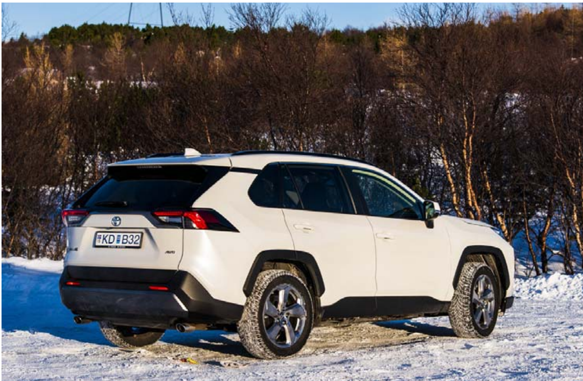
Toyota RAV4 hefur að áliti greinarritara frikkað mjög og djörfungin hjá hönnuðum Toyota er orðin meiri.

segja að fjórhjóladrif bílsins hafi verið mikið bætt, það fannst glögglega. Einnig fannst fyrir aukinni veggþæð sem gleðja mun margan þó bíllinn sé lægri til þaksins. Eitt má þó gagnrýna varðandi vélina en þegar bílnum er gefið hressilega inn heyrir talsvert í henni, meira en við mátti búast.