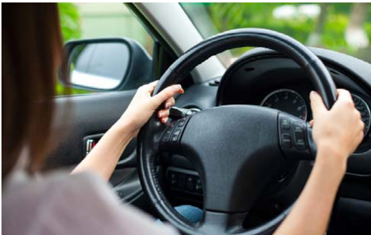
Innréttingar bíla eru með allra sóðalegustu stöðum.

Courchevel skiðasvæðið í Frakklandi er þekkt fyrir að draga að efnaðri hóp skiðaáhugamanna og þar flaksa pelsarnir um göturnar á kvöldin. Rolls Royce er einnig með kynningar á kvöldin á bílum sínum á hótélunum og getur fólk sérpantað sínar uppáhaldsútfærslur af bílum Rolls Royce á staðnum. Líklega er Rolls Royce á hárréttu staðnum til að kynna væntanlegum kaupendum bíla sína, að minnsta kosti er það þeirra trú.