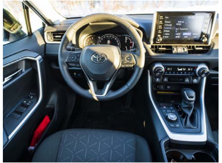
Innréttingin er býsna lagleg orðin og frágangur góður sem fyrr.