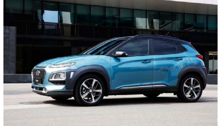
Hyundai Kona, en til stendur að smíða enn minni jeppling.

Jepplingaæðið ætlar engan endi að taka og sífellt fjölga í flóru þeirra. Nýjasta æðið er ef til vill fylgið í agnarsmáum jepplingum sem virðast eiga mikið upp á pallborðið hjá bílkaupendum. Á þann vagn ætla systurfyrirtækin suðurkóresku Hyundai og Kia að stökkva þó svo talsvert framboð sé hjá báðum fyrirtækjunum á jepplingum fyrir. Nú stendur þar til að bæta agnarsmáum jepplingi við sem væri talsvert minni en núverandi Kona og Stonic jepplingar fyrirtækjanna sem seint mundu teljast stórir. Endanleg ákvörðun um smíði þessara bíla hefur ekki enn verið tekin en ef af slíku verður, sem talið er harla líklegt, verður þessum smáu jepplingum helst beint að Evrópumarkaði. Hugsanlega yrðu bílarnir byggðir á sama undirvagni og smábílarnir