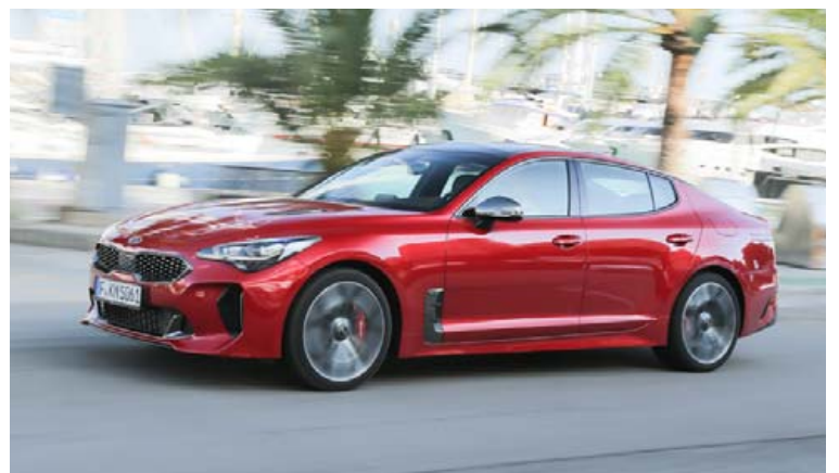
Kia Stinger er einn af fjölmörgum bílgerðum Kia.

Söluhæstu bílarnir í Evrópu á síðasta ári voru nýr Kia Ceed og