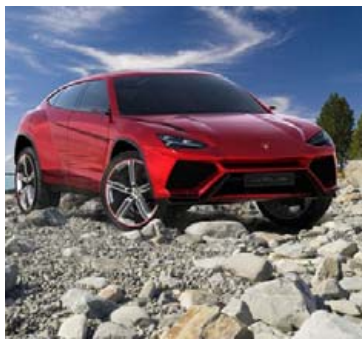
Nú er hægt að leigja Lamborghini Urus, en það kostar sitt.