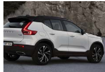
Volvo XC40 jepplingurinn.

Í áætlunum Volvo kveður á um tvöföldun á sölu jepplingsins XC40 á þessu ári og með því yrði sala hans 150.000 bílar í ár. Árið í ár verður fyrsta heila árið sem bíllinn er í sölu og því eðlilegt að búast við aukinni sölu hans, en í fyrra hafði Volvo ekki undan að afgreiða bíllinn upp í pantanir. Til að þetta sé nú gerlegt hefur Volvo aukið mjög framleiðslugetuna í verksmiðju sinni í Ghent í Belgíu, þar sem XC40 er smíðaður. Þessi áætlaða aukna sala í XC40 bílnum er liður í því að færa árssölu Volvo upp í 800.000 bíla á ári, en heildar-