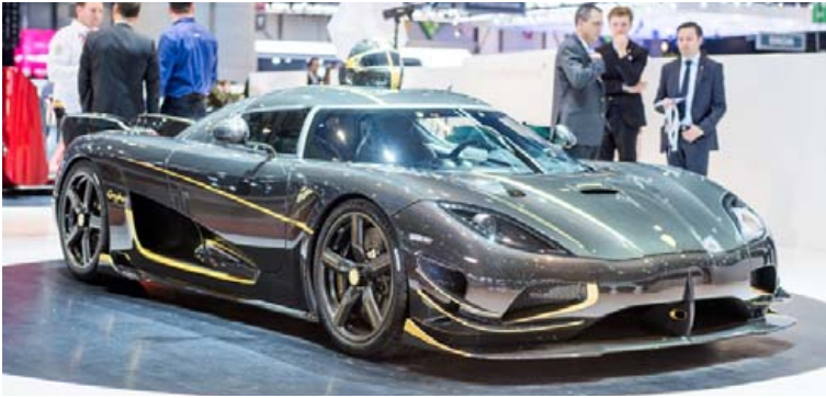
Koenigsegg bíll á bilsýningu.