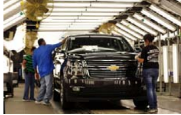
Framleiðsla GM í Mexíkó jókst um 4%.

Framleiðsla bíla í Mexíkó dróst saman um 1% í fyrra og er það í fyrsta sinn sem það gerist frá upphafi bílaframleiðslu þar. Bílaframleiðsla í Bandaríkjunum féll um 2,6% í fyrra og um 8,8% í Kanada. Aðeins þrjú bílaframleið-