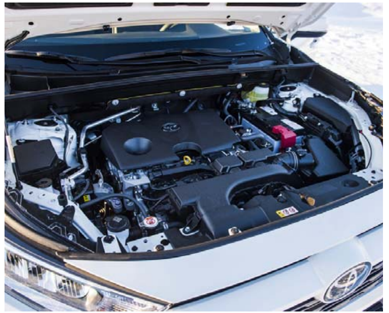
Drifrásin í RAV4 er nú orðin þrælöflug, 222 hestöfl.

við. Geymsluhólf eru yfrin, sem og glasahaldarar. Mjög flott var að sjá að útsýni aftur sem vanalega er með hefðbundnum baksýnispegli er nú frá myndavél sem varpast upp á „baksýnispegilinn“ og er myndin þar ótrúlega skýr. Aðfallshorn bílsins beggja megin eru brattari sem bætir torfærugetuna og þar sem bíllinn er örlítið styttri en forverinn er hann auðveldari í borgarsnúningunum, en þrátt fyrir það er 3 cm lengra á milli öxla sem eykur aksturshæfnina. Með fimmtu kynlöd RAV4 er sannarlega kominn frábær jepplingakostur og ekki að furða að hann sé rifinn út úr Toyota umboðinu hérlendis.