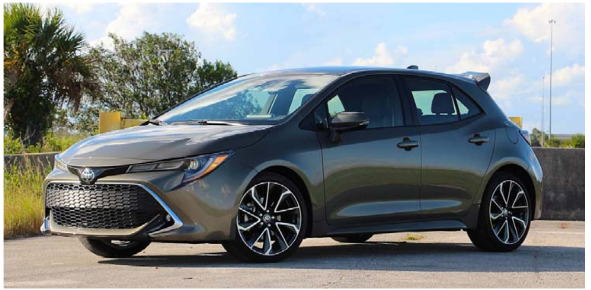
Líkt og fyrri ár er það Toyota Corolla sem trónir á toppi listans.

Þetta ættu bíleigendur að hafa í huga í umgengni við bíla sína og ef til vill þrifa þá örlítið oftar, ekki bara að utan. Í rannsókninni mældist bakteríufjöldi á hvern ferentimetra á stýrishjóli 629 CFU en til samanburðar mælist hann 100 CFU á símaskjáum, 313 CFU á lyftutöklum og 172 CFU á klósettsetum. Ein sláandi staðreyndin enn sem þessi rannsókn leiddi í ljós er að það finnast að jafnaði 700 mismunandi bakteríutegundir í innréttingum bíla og sumar þeirra valda matareitrun, húðsjúkdómum og ýmiss konar sýkingum.