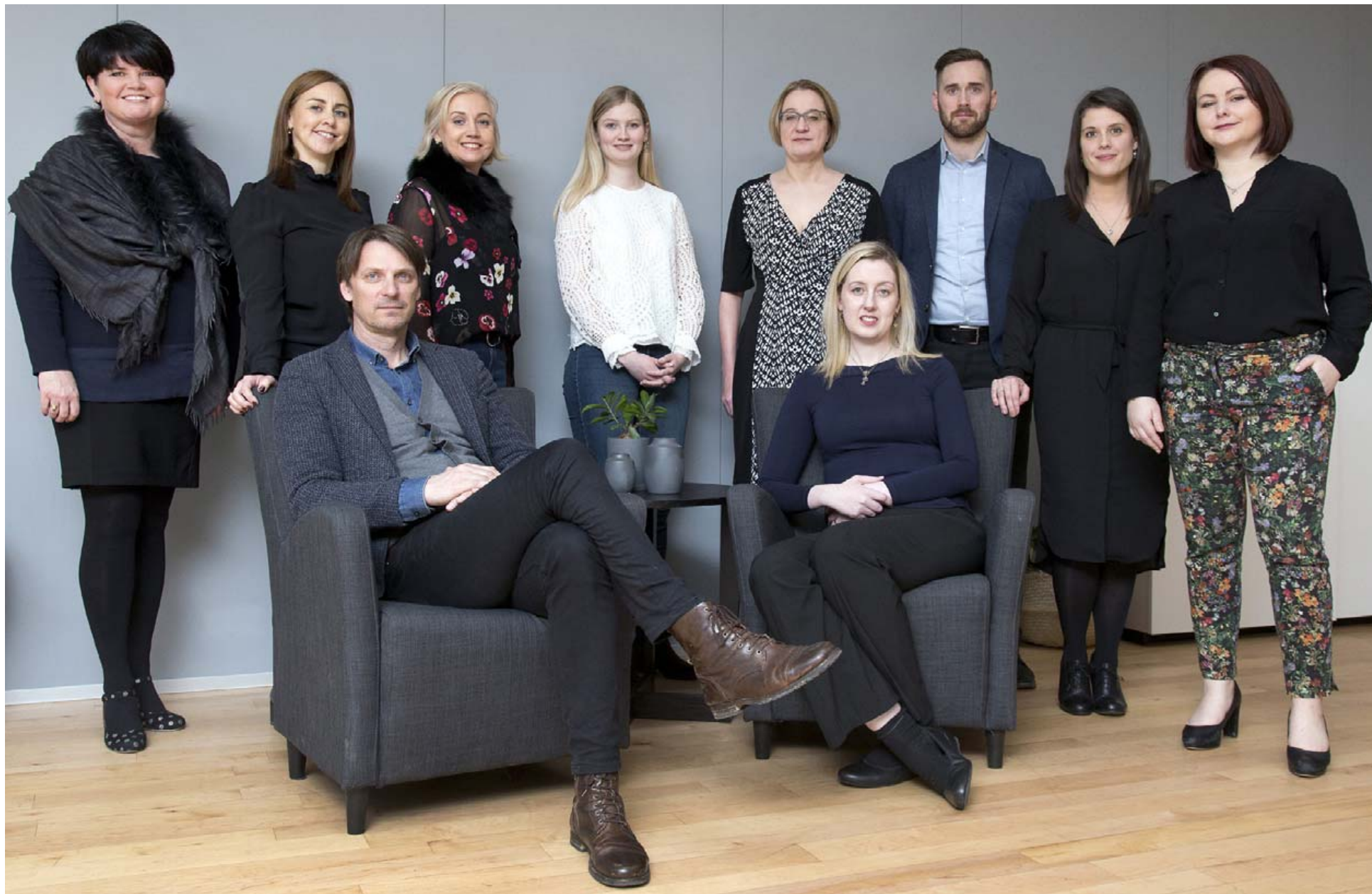
Hjá Capacent starfa þrettán ráðgjafar við ráðningar, ellefu í Reykjavík og tveir á Akureyri. Auk þeirra starfa átta ráðgjafar á vegum fyrirtækisins í Svíþjóð.