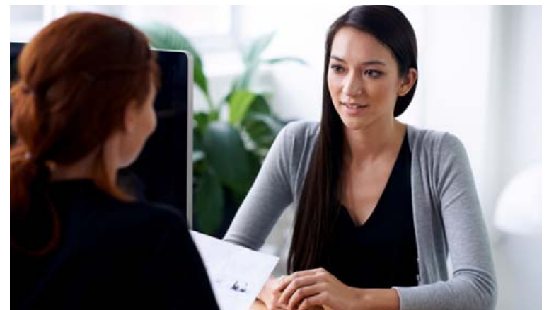
Hjá Alþjóðlegu ráðningaþjónustunni starfa tengiliðir starfsmanna sem talar til dæmis íslensku, ensku, lettnesku, rússnesku.