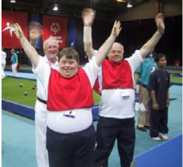
Kátir bocchia-keppendur á heimsleikum SO á Írlandi árið 2003.