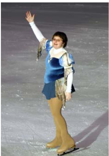
Keppandi á vetrarleikum Special Olympics í Boise, Idaho 2009.

Innleiðing nýrra greina hefur verið stöðug í starfi Special Olympics á Íslandi og áhersla hefur verið lögð á að allir fötlunarhópar geti nýtt þau nýju tilboð sem skapast, sé áhugi á því. Dæmi um greinar sem hafa verið settar á fót gegnum starf Special Olympics eru áhald- og nútímamleikar, listhlaup á skautum og knattspyrna. Stærsti þátttakendahópur ÍF er hinn almenni iðkandi sem hefur fengið tækifæri gegnum Special Olympics til að sækja fjölmörg mót erlendis. Auk heimsleika eru Evrópumót, sérgreinamót og boðsmót t.d. á Norðurlöndum. Haldnar hafa verið þrjár ráðstefnur Special Olympics þar sem keppendur, þjálfarar og aðstandendur eru í lykilhlutverki. Þar hafa verið sagðar athyglisverðar sögur um þau jákvæðu áhrif sem þátttaka í heimsleikum hefur haft á sjálfsmynd keppenda.