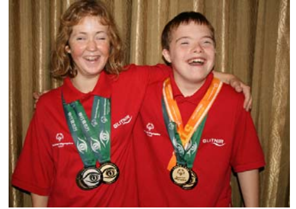
Fimleikakeppendur á heimsleikum SO í Kína 2007.

Olympics sjálfstætt en Ísland fékk undanþágu þegar upphafleg krafa SOI til Íslands var að starfið yrði sjálfstætt. Ísland hefur tekið virkan þátt í norrænu starfi og alþjóðastarfi Special Olympics, fulltrúi Íslands sat í Evrópuráði Special Olympics í átta ár og Ísland hefur gegnt formennsku í norrænni nefnd Special Olympics frá því nefndin var sett á fót 2013. Virk þátttaka hefur því verið bæði í alþjóðlegu og norrænu stjórnunarstarfi og í verkefnum fyrir iðkendum.