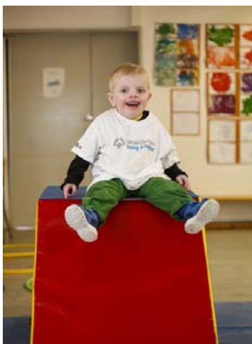
Talið er að snemmtæk ihlutun geti haft jákvæð áhrif til framtíðar.

Rannsóknir hafa sýnt að snemmtæk ihlutun getur haft jákvæð áhrif til framtíðar. Talið er að jákvæður árangur sem nú þegar hefur komið fram í YAP-verkefninu hafi áhrif til framtíðar og styrki og hvetji börn til áfram-