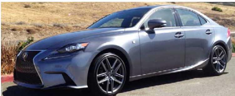
Að öllum líkindum fær næsta kynslóð Lexus IS 3,0 lítra bensínvél frá BMW.

mjög tökkunum og flestu er stjórn að á snertiskjá sem reyndar er af margvíslegri stærð eftir útfærslum bílsins. Fyrir vikið virkar hann miklu framúrsteftulegri en keppinautar hans. Þessi nýja kynslóð Peugeot 208 er 30 kílóum léttari en forverinn og með mun betra loftflæði og klýfur hann nú vindinn betur. Fyrir vikið er hann miklu hljóðlátari og stífni bílsins er líka miklu meiri og minnkar það allan titring í honum til muna. Billinn verður í boði með 1,2 lítra 75, 100 eða 130 hestafla bensínvélum með forþjöppu eða 100 hestafla 1,5 lítra dísilvél, en með henni fæst billinn aðeins beinskiptur, en með bensínvélunum má velja milli beinskiptingar og sjálfskiptingar.