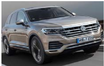
Vélin togar heil ósköp, eða 900 Nm, og gerir þessum stóra bil kleift að taka sprettinn upp í hundraðið.