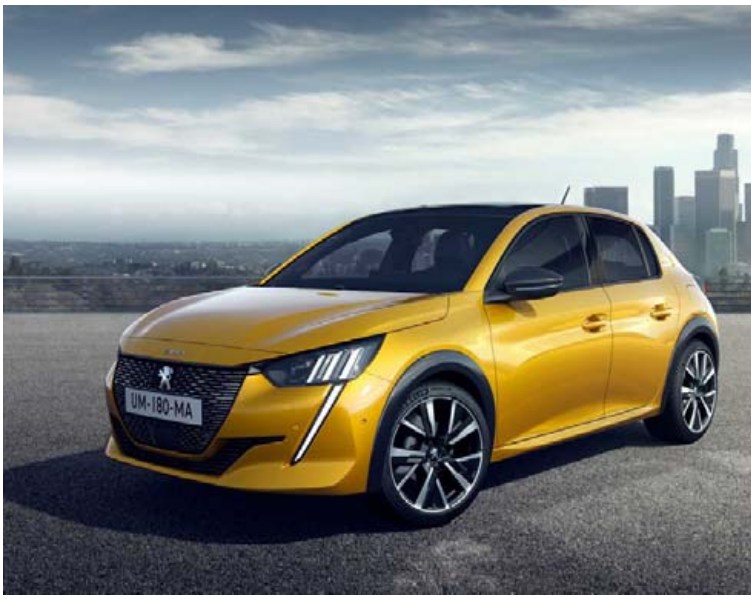
Glænt og talsvert breytt útlit á þessum smávarna bíl frá Peugeot.