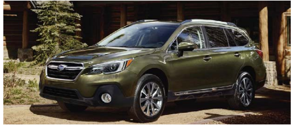
Subaru Outback er einn af vinsælum bílum Subaru í Kanada.

Samkvæmt nýjustu könnun ALG er það jafnframt niðurstaða hennar að fjórar bilgerðir Subaru haldi best virði sínu hver í sínum