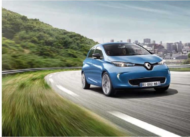
Rafmagnsbílinn vinsæli, Renault ZOE.

Renault er nú með fjóra rafbíla á markaðnum; fólksbílinn ZOE,