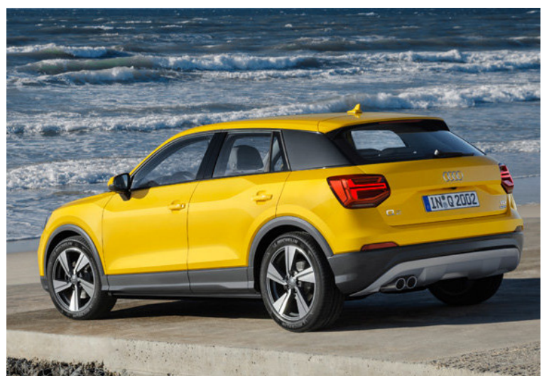
Audi ætlar að minnka vélaframboð um 30% til að minnka þróunarkostnað.

Minni sala bíla Audi í janúar upp á 3%, miðað við sama mánuð í fyrra, veldur forsvarsmönnum Audi áhyggjum og þar á bæ er fyrirhugað að fækka bæði stjórnendum og vélargerðum í Audi-bíla sem eru að sögn fyrirtækisins of margar. Með fækkun vélargerða á að einfalda smíðina, en einnig stendur til að skera niður eitt lag af stjórnendum í fyrirtækinu og fækka þeim samtals um 10%. Þó svo að Audi hafi aukid sölu sína á stærsta bílamarkaði heims í Kína um 5,1% í janúar var sala Audi léleg í Evrópu og hefur hún