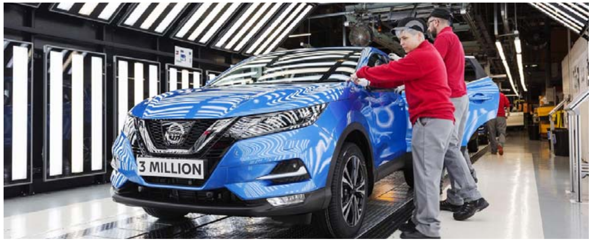
Úr verksmiðju Nissan í Sunderland í Bretlandi.

Næsta kynslóð Lexus IS á að verða af sömu stærð og núverandi kynslóð, en billinn mun samt léttast um 155 kíló. Búist er við því að Lexus muni kynna nýja kynslóð af IS-bíl sínum á seinni hluta næsta árs og að Lexus IS F sjái ekki dagsljósið fyrr en árið 2021. Með þessum breytingum á aflrás Lexus IS verður billinn mun hæfari til að keppa við BMW 3 og aðra lúxusbíla svipaðrar stærðar.