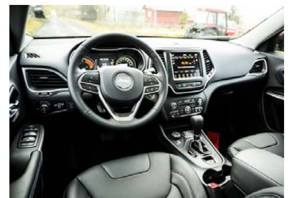
2,2 lítra dísilvélin er 195 hestöfl og er hún tengd við 9 gíra sjálfskiptingu. Skottrými er 570 lítrar.

um ástæðum, þó svo hann sé einnig framleiddur með framhjóladrifi eingöngu. Því er ódýrasta útfærsla hans ekki í boði en það væri 148 hestafla bensínbíll. Ísband býður Cherokee í tveimur útfærslum, Longitude Luxury á 7.990.000 kr. og Limited á 9.580.000 kr. en þá er