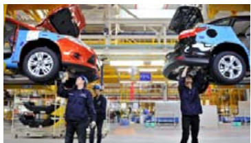
Úr verksmiðju Ford í Kína.

Audi R8 V10 FSI er 620 hestöfl og aðeins 3,1 sekúnda í 100 km hraða og með hámarkshraðann 331 km/klst. Þessi afmælisútgáfa verður með sama afli. Svartur litur verður einkennandi á þessari afmælisútgáfu, bæði að utan og innan og meira að segja er Audi merkið að framan svart en ekki krómað. Svarti liturinn heldur áfram að innan en sætin eru stungin með bronslitum þræði.