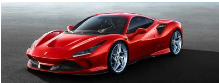
Ferrari F8 Tributo er sannarlega rennilegur bíll.

Árið 2015 kynnti Ferrari 488 GTB bíl sinn sem leysti 458 Italia bílinn af hólmi. Nú er tími hans á enda runninn því Ferrari mun kynna þann bíl sem leysir hann af hólmi, Ferrari F8 Tributo, á bílasýningunni í Genf sem hefst eftir viku. Ferrari F8 Tributo fær 50 viðbótarhestöfl og verður 40 kg léttari en 488 GTB bíllinn. Það þýðir 720 öskrandi hestöfl og 770 Nm tog úr 3,9 lítra V8 vélinni með