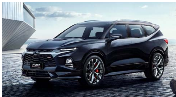
Lengri gerð Chevrolet Blazer verður aðeins framleidd fyrir Kínamarkað.

magnsútfærslu, Tesla Model Y og rafmagnsjeppinga frá BMW og Benz. Audi ætlar ekki að láta staðar numið með þessum rafmagnaða Q4 því Q2 rafmagnsbíll er einnig á leiðinni og er honum helst ætlað að keppa á Kína-markaði. Audi Q4 verður í boði með þrjár stærðir af rafhlöðum, þá minnstu 48 kWh með 320 km drægi, en sú langdrægasta á að ná 500 km drægi.