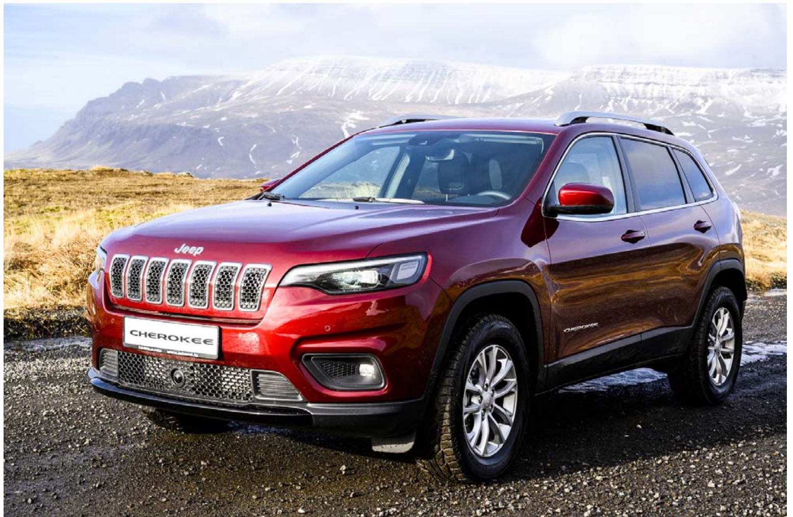
Jeep Cherokee er reffilegur á velli og til Íslands hafa margir slíkir bílar ratað í gegnum árin og virðast endast einkar vel.

Hjá Ísband í Mosfellsbæ, söluaðila Jeep, er Cherokee í boði aðeins