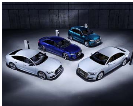
Allar gerðirnar fá stafina TFSI e í endann þar sem e stendur fyrir „e-tron“.

búnað, stífari fjöðrun, sportlega útfærslu innréttingarinnar og „boost performance“ frá rafmótornum í þar til gerðri akstursstillingu. Auk þess fá A6- og A7-bílarir rauðmálaðan bremsubúnað og þykkari hljóðeinangrandi rúður í afturhurðum.