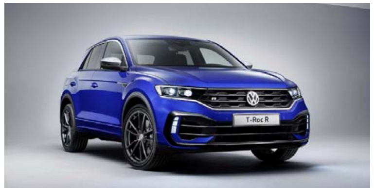
VW T-Roc mun koma á markað í kraftaútfærslu síðar á árinu.

Bíllinn fær DSG-tvíkúplingarsjálfskiptinguna með 7 girum og hann verður fjórhjóladrifinn eins og Golf R. Fyrir þá sem þora þá verður hægt að aftengja skrikvörn bílsins ef til dæmis á að drífta. VW T-Roc R fær líka pústkerfi frá Akrapovic úr titaniumblöndu, 18 eða 19 tommu álfelgur, stífari fjöðrun en í hefðbundnum T-Roc og bíllinn situr lægra á vegi. Volkswagen ætlar að sýna VW T-Roc R á bilasýningunni í Genf sem hefst 7. mars og hann mun síðan fást til kaups á síðari hluta ársins.