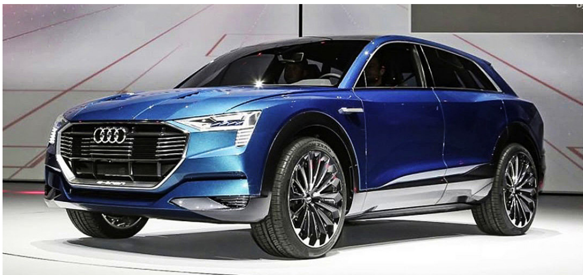
Audi Q4 E-Tron sver sig ætt nýrra Audi-bíla og ekki verður sagt annað en að hann gleðji augað.