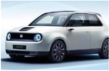
Laglegur rafmagnsbíll Honda.