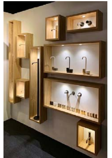
Glæsileg blöndunartæki fyrir vasku, baðkór og sturtur fást í úrvali hjá Innréttingum & tækjum.