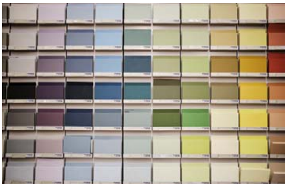
Nýju vorlitirnir streyma inn. Ljósari tónar eru vinsælir.

„Það hefur verið óvenju mikill áhugi hjá fólki undanfarið að breyta hjá sér. Mjög vinsælt að mála til dæmis einn vegg, eitt rými eða eitt herbergi í öðrum lit. Slíkar minniháttar breytingar geta gert mikið fyrir heimili fólks. Dökkir litir virðast vera á útleið þar sem fólk virðist vera að birta til hjá