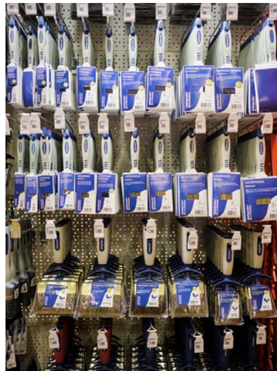
Það er betra að vanda valið á málningarpenslum svo verkið takist vel. Öll tæki og tól til þess fást í Bauhaus.