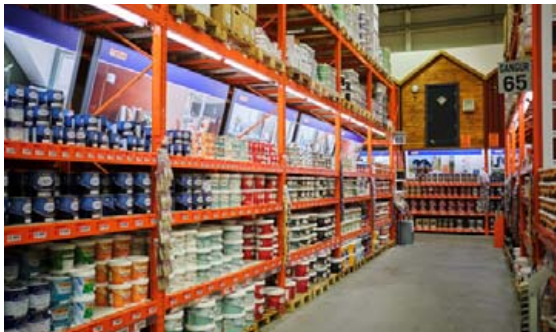
Í málningardeild Bauhaus finnur fólk allt í málningarvinnuna, hvort sem það er innan- eða utanhúss.