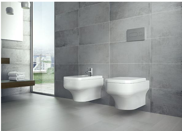
Vaskar í skál og vaskar í áfastri borðplötu á ljósum sem dökkum innréttingum njóta nú vinsælda, sem og upphengd salerni með földum vatnskassa.

blöndunartæki sem hæfa smekk hvers og eins.