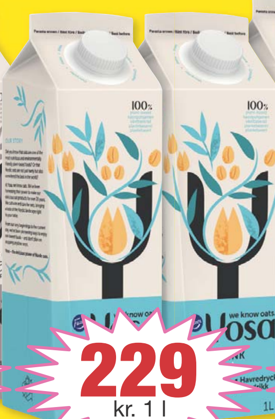
Yosa Hafradrykkur Rich 1 l