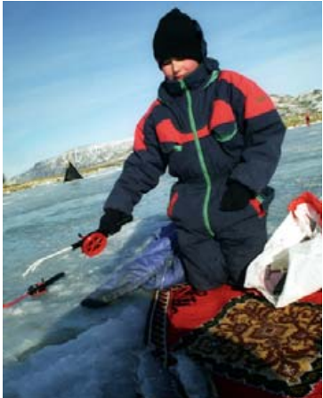
Það þarf ekki mikið til að byrja í isdorgveiði en betra að fara varlega.

farið reyndir íslenskir og erlendir leiðsögumenn og er fyllsta öryggis jafnan gætt í flúðasiglingunum.