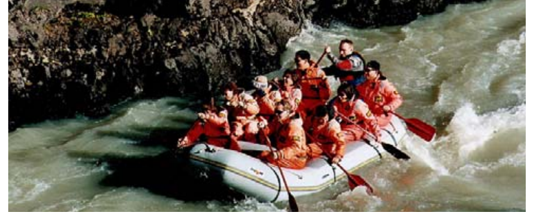
Það er fátt skemmtilegra en að sigla niður flúðir í íslensku umhverfi.

en það er tilvalin skemmtun fyrir fjölskyldur með ung börn. Landslagið meðfram ánni er fallett, vatnshraðinn lítill svo nýtt sjónarhorn á náttúruna nýtur sín vel. Þeir sem eru 12 ára og eldri geta farið á vestari Jökulsá og sú austari er fyrir þá sem eru 18 ára og eldri, búa yfir svolitilli reynslu og langar að reyna meira á sig. Þegar siglt er niður árnar blasir hvarvetna á leiðinni við stórbrotin náttúra og