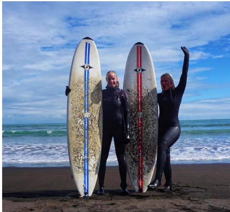
Surf byrjendanámskeiðið er fyrir löngu búin að sanna sig og hefur verið gríðarlega vinsælt frá árinu 2010. Námskeiðið kostar 18.900 krónur.

Surf byrjendanámskeiðið er fyrir löngu búin að sanna sig og hefur verið gríðarlega vinsælt frá árinu 2010. „Þar höfum við mest verið að einblína á Íslendinga en höfum