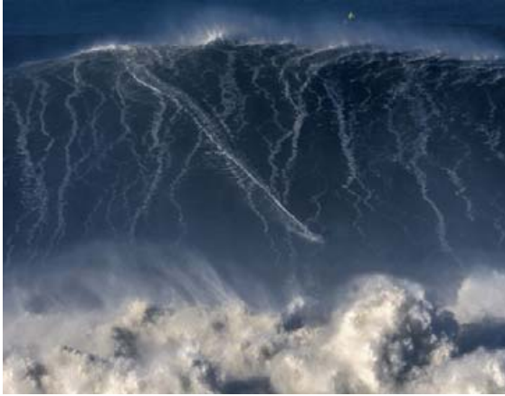
Hér er Koxa á ferðinni en merkilegt nokk er þetta ekki aldan sem hann setti heimsmetið á heldur önnur minni.