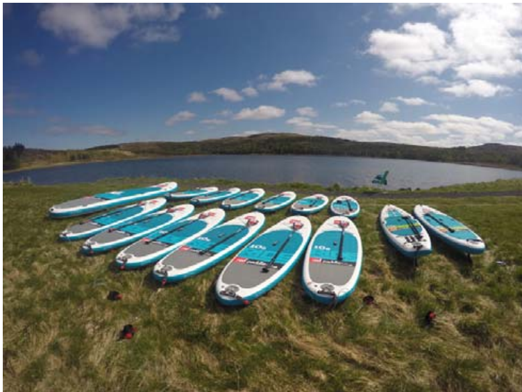
Brettin eru meðfærileg og passa í hvaða skott sem er. „Það er mikið frelsi að geta pakkað þeim saman og ferðast með þau hvert sem er,“ segir Heimir.

SUP Iceland og Adventure Vikings munu bjóða upp á SUP námskeið seinnipartinn á þriðjudögum í allt sumar í nágrenni Reykjavíkur. Námskeiðið stendur yfir í 3-4 klukkustundir og þar gefst þátttakendum tækifæri til að læra réttu handtökin, meðhöndlun