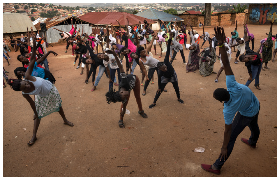
Á árinu 2018 stunduðu 655 ungmenni nám í hárgreiðslu, rafvirkjun, kjólasaumi og klæðskurði, þrjóni, matargerð og framreiðslu í þremur menntasmiðjum UYDEL.