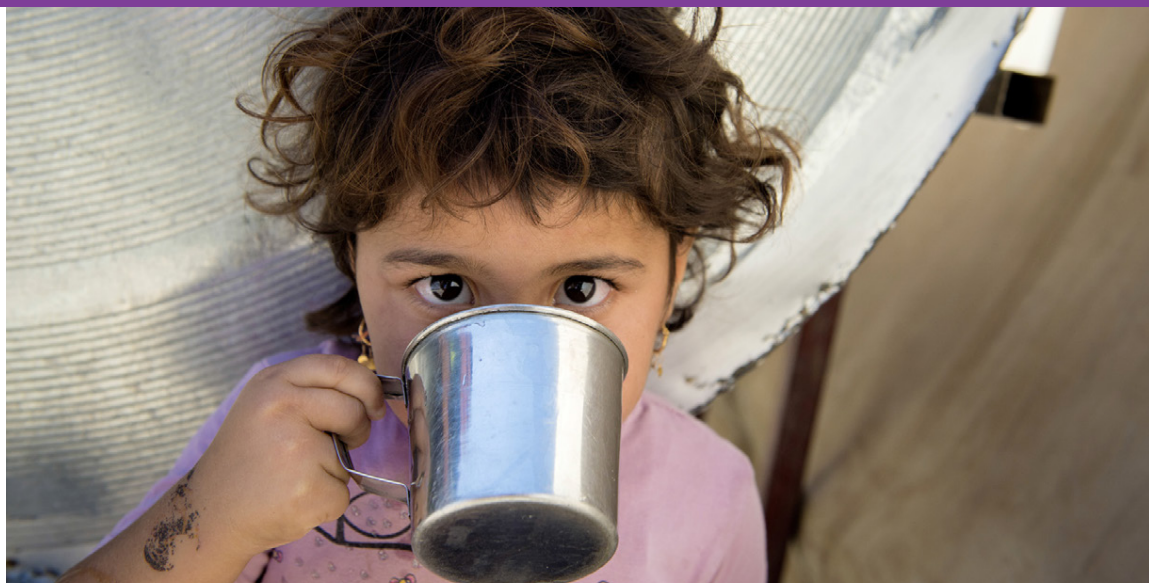
Börn og fólk í viðkvæmri stöðu svo sem vegna fötlunar eru ávallt í forgangi í hjálparstarfi.

Fólkið fær aðstoð svo það geti byggt híbýli, skóla og aðrar stofnanir sem veita grunnþjónustu. Sálfélagleg þjónusta er veitt börnum og konum og skólustarfi er haldið úti fyrir börnin. Markhópurinn telur 21.810 manns.