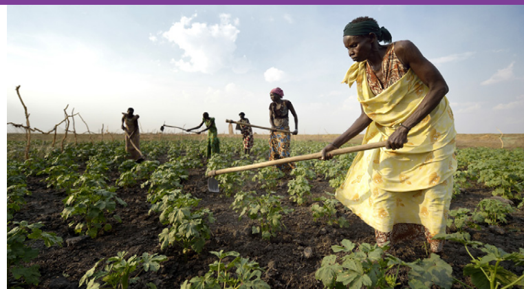
Markmiðið er alltaf að fólkið geti hjálpað sér sjálfst sem fyrst.

færi og þjálfun í notkun þeirra til að yrkja jörðina og verjast matarskort. Fólkið fær líka þjálfun í verslun með landbúnaðarafurðir. Markhópurinn telur 2.500 manns.