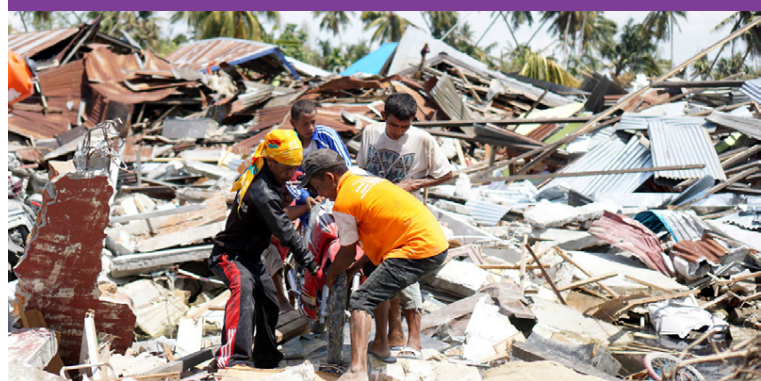
Þjörgunarsveitir aðstoða fólk úr rústum eftir að mannskæður jarðskjálfti og flóðbylgja riðu yfir í Mið-Sulawesi í Indónesíu í september 2018.