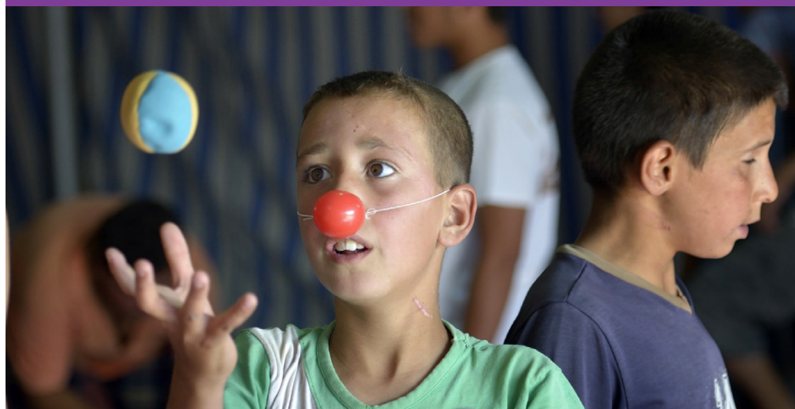
Börn fá sálrænan stuðning meðal annars í gegnum skipulagðan leik.

Utanríkisráðuneytið samþykkti á fyrstu mánuðum ársins umsóknir Hjálparstarfsins um styrk til manúðaraðstoðar Alþjóðlegs hjálparstarfs kirkna, ACT Alliance, á þessum svæðum og veitti samtals 80 milljónum króna til aðstoðarinnar en stofnunin lagði til 5,1 milljón af söfnunarfé.