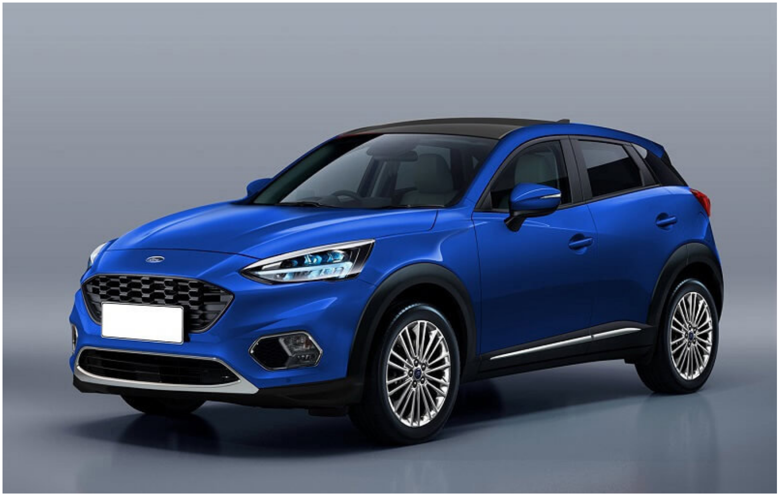
Svona gæti Ford Puma orðið í endanlegri mynd.

Stefnan hjá Geometry er að verða einn af 10 stærstu bílaframleiðendum heims, hvorki meira né minna. Geely keypti fyrir skömmu 50% hlut í Smart-bílaframleiðandnum frá Daimler í Þýskalandi og verður framleiðsla Smart-bíla flutt til Kína. Geely ætlar að fjárfesta fyrir 36.500 milljarða króna í rafbílum á næstu 5 til 10 árum og er helmingur fjárfestingarinnar ætlaður fyrir rafmagnsbíla selda í Kína. Geely náði 20% vexti í bílasölu á síðasta ári, en á ekki von á sams konar vexti í ár sökum minni bílasölu í Kína í ár en í fyrra.