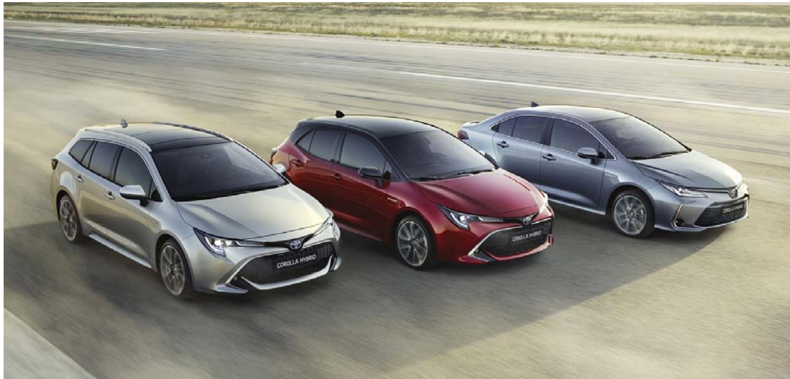
Toyota Corolla af tólftu kynslóð kemur nú í þremur útfærslum og eru þær hver annarri fegurri.

Þegar ný kynslóð af mest seldu bilgerð heims er kynnt er mikið undir og hægt að fullyrða að þar fari eitthvað bitastætt til að fjalla um. Svo mikið hefur selst af Toyota Corolla gegnum tíðina að heildarsala hans er komin yfir 46 milljónir bíla. Hann selst líka í nokkuð meira magni en 1 milljón bíla á ári. Corolla hefur verið til í 53 ár og er því ein langlifasta bilgerð sem til er og hefur verið sú mest