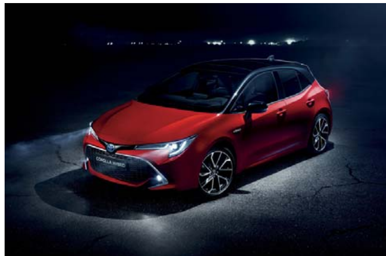
Hatchback gerð Corolla

Við fyrsta akstur nýja bílsins er eitt það fyrsta sem tekið er eftir hversu hljóðlátur hann er orðinn. Annað sem slær mann fljótt er hve fjöðrunin er góð og hve vel hann étur upp allar ójöfnur. Stýring bílsins er bæði þægileg og nákvæm og nú er Corolla farinn að velgja helstu samkeppnisbílum sínum í C-flokki undir uggu í aksturseginnleikum. Þar var hann eftirbátur bæði Ford Focus og VW Golf, en því lík þæting. Alls ekki skaðar að vera með 180