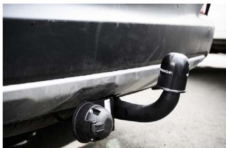
Hér má sjá fast dráttarbeisli frá Steinhof.