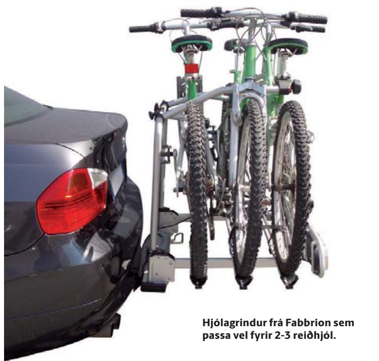
Hjólagrindur frá Fabbrión sem passa vel fyrir 2-3 reiðhjól.