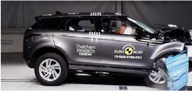
Árekstrarprófun á Range Rover Evoque.