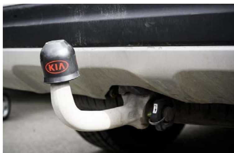
Dráttarbeisli sem hægt er að taka af, frá Westfalia.

Nánari upplýsingar má finna á www.vikurvagnar.is .