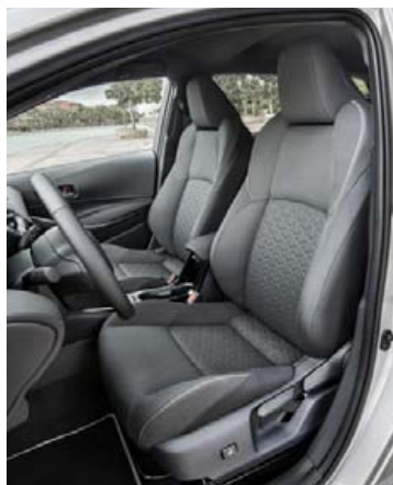
Ferlega flott framsæti

hestafla vélina undir húddinu, en þá er gaman að taka sprettinn og alls ekki má gleyma því að sú vél vill snúast hratt og getur það og þannig er best að njóta bílsins. Eyðsla bílanna er sér kapituli, eða aðeins 3,3 l með 1,8 lítra vélinni og hybrid-búnaði og 3,7 l með kraftmiklu 2,0 lítra vélinni, líka með hybrid-búnaði og mengunin er aðeins 76 og 84 g/km af CO 2 sem tryggir betra verð bílanna þar sem þeir falla í góðan tollflokk. Með 1,21 vélinni án hybrid-búnaðar er eyðslan hins vegar 5,6 lítrar með sjálfskiptingu, en með því sést hve mikið hybrid-búnaðurinn hjálpar til við að ná eyðslunni niður.