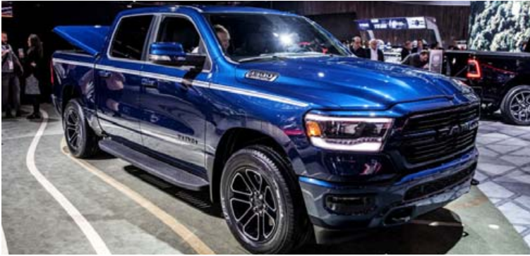
Sala RAM-pallbíla jókst um 15 prósent milli ára.

vel fram úr þeim öryggiskröfum sem nú væri miðað við, hann stæðist allar þær öryggiskröfur sem miðað yrði við árið 2022. Sömu sögu er ekki að segja af nýjum Citroën C5 Aircross sem prófaður var á sama tíma af Euro NCAP. Hann hlaut aðeins 4 stjörnur og er því talsverður eftirbátur Range Rover Evoque í öryggismálum. Þar fer kannski einn munurinn á lúxusbílum og hefðbundnum bílum sem kosta mun minna?