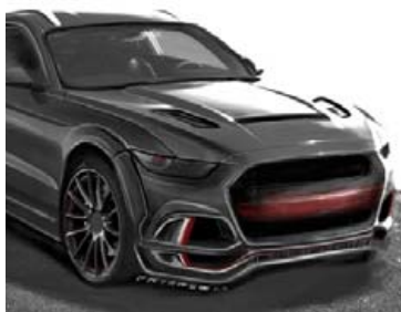
Fyrsta teikning af jeppanum.