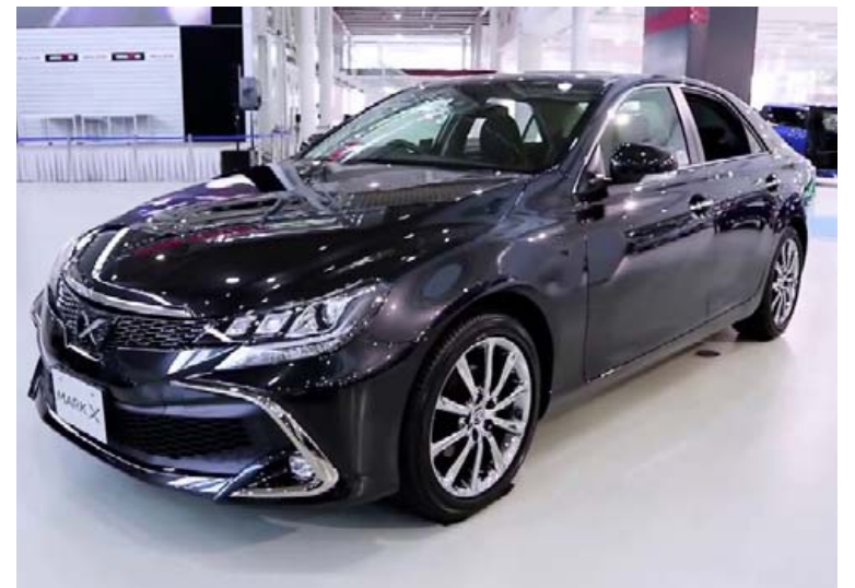
Toyota Mark X verður kvaddur eftir 52 ára sögu.

sími 540 4900 info@arctictrucks.is www.arctictrucks.is