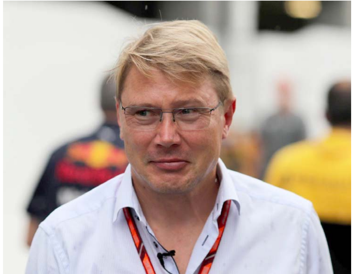
Mika Häkkinen er ekki af baki dottinn.

Chevrolet Silverado pallbíla á meðan Fiat Chrysler seldi 536.980 RAM bíla. Á nýliðnum fyrsta ársfjórðungi þessa árs seldust hins vegar 120.026 RAM-bílar en 114.313 Silverado-bílar. Sala RAM jókst um 15% á milli ára en sala Silverado minnkaði um 16%.