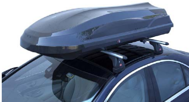
Farangursboxin vinsælu frá ítalska framleiðandanum Fabbri.