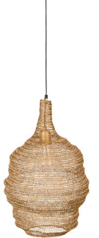
Lena Ljós kr. 12.900