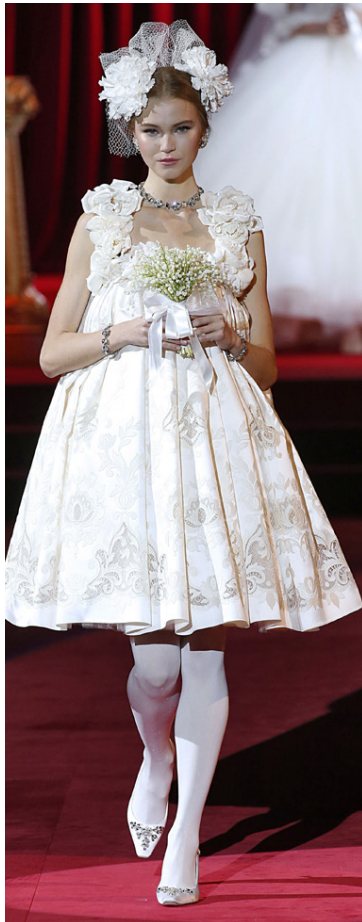
Þessi brúðarkjöll getur varla talist klassiskur. Fallegt mynstrað silki-efni og kjöllinn er stuttur, rétt fyrir ofan hné. Ekkert slör en blómakrans á höfði.