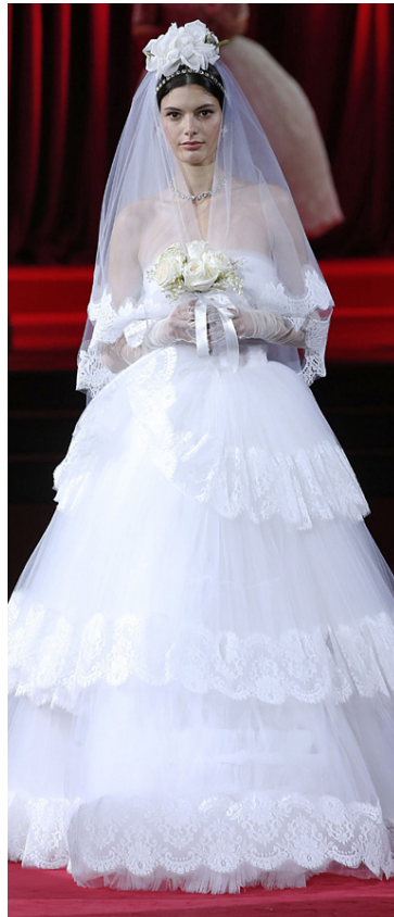
Silki, blúndur, blóm og skraut. Það vantar ekkert upp á glæsileikann hjá D&G þegar þeir taka sig til.