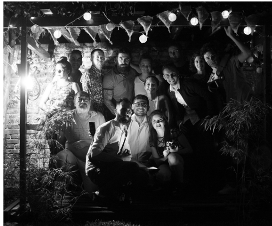
Veislugestir í rigningu í Argentínu.