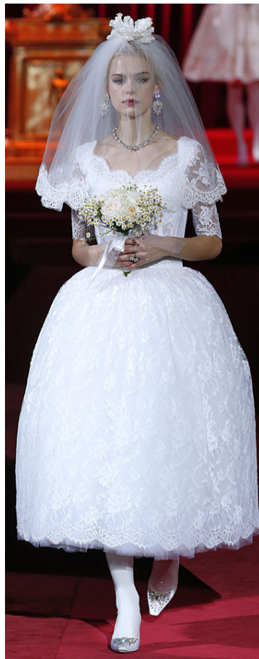
Skemmtilegt snið á þessum brúðarkjól D&G. Hann er elegant en samt svo einfaldur í allri sinni dýrð.