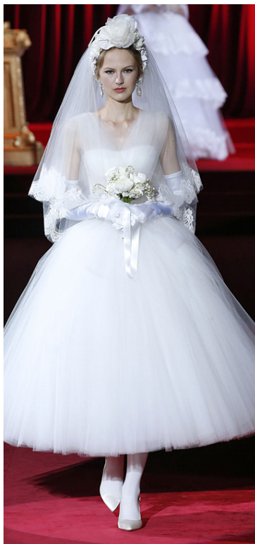
Hér er greinilega horft til fortíðar en D&G vilja endurvekja kvenlegan og klassiskan stíl frá fimmta áratug síðustu aldar. Hér er gengið alla leið.