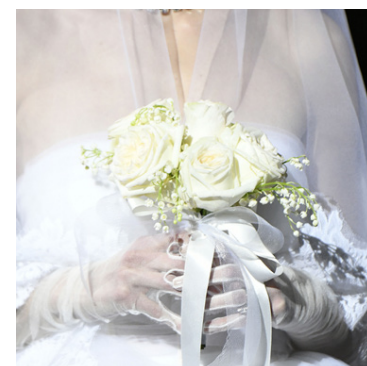
Brúðarvöndurinn er alveg hvítur með silkiborða. Ákaflega fallegur.