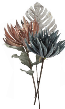
Gerviblóm í miklu úrvali frá kr. 1.900