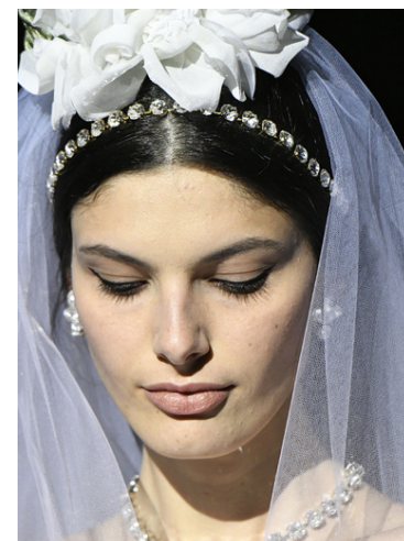
Brúðurin er með fallegt, steinum skreytt háband og hálsfesti í stíl.

það. Þeir vilja stíga til baka í tískunni, endurvekja klassikina sem einkenndi gamla tíma og kvenleikann. Það verður varla sagt að brúðarkjólar þeirra D&G séu einfaldir að gerð og sniði. Mikið er í þá lagt og efnin falleg. Myndirnar sýna best glæsileikann í kjólunum.