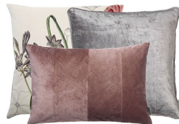
3 fyrir 2 tilboð af púðum þú kaupir tvo púða og þriðji fylgir frítt með* *Ódýrasti púðinn fylgir frítt