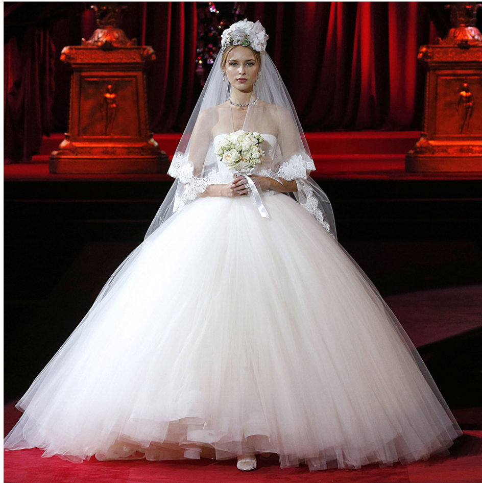
Glæsileg brúður klæðist íburðarmiklum kjól frá Dolce & Gabbana.