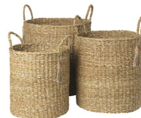
Sara Körfur kr. 6.200 - 10.600