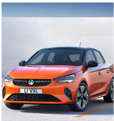
Mynd: Opel Corsa-e á að komast 340 km á fullri hleðslu.