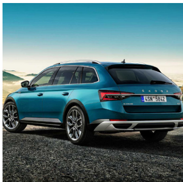
Skoda Superb Scout