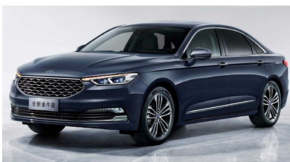
Ford Taurus verður áfram framleiddur í Kína

IceTrack ehf. Sími 773 4334 · mtdekk@mtdekk.is www.mtdekk.is