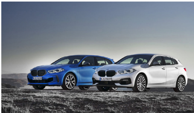
Mestu breytinguna á 1-línunni má telja að nú er bíllinn framhjóladrifinn.

Ásamt 48 volta mildu tvinndrífásinni skilar Evoque með Ingenium dísilvélinni 150 hestöflum, 180 eða 240 eftir því hvaða vél er valin. Einnig er hægt að velja Evoque með bensínvél sem skilar ásamt tvinndrífásinni 200 hestöflum, 250 eða 300 hestöflum. Við vélnar er í öllum tilfellum 9 girja sjálfskipting. Þess utan er hægt að sérpanta Evoque framdrifinn og beinskíptan við 150 hestafla dísilvélinu. Hjá Jaguar Land Rover við Hestháls kostar grunngerð Evoque með 150 hestafla vél og sjálfskiptingu kr. 6.990.000 en með þeim ákveðna búnaði sem flestir velja og verður meginsölubíll Evoque hér á landi kostar hann kr. 8.490.000.