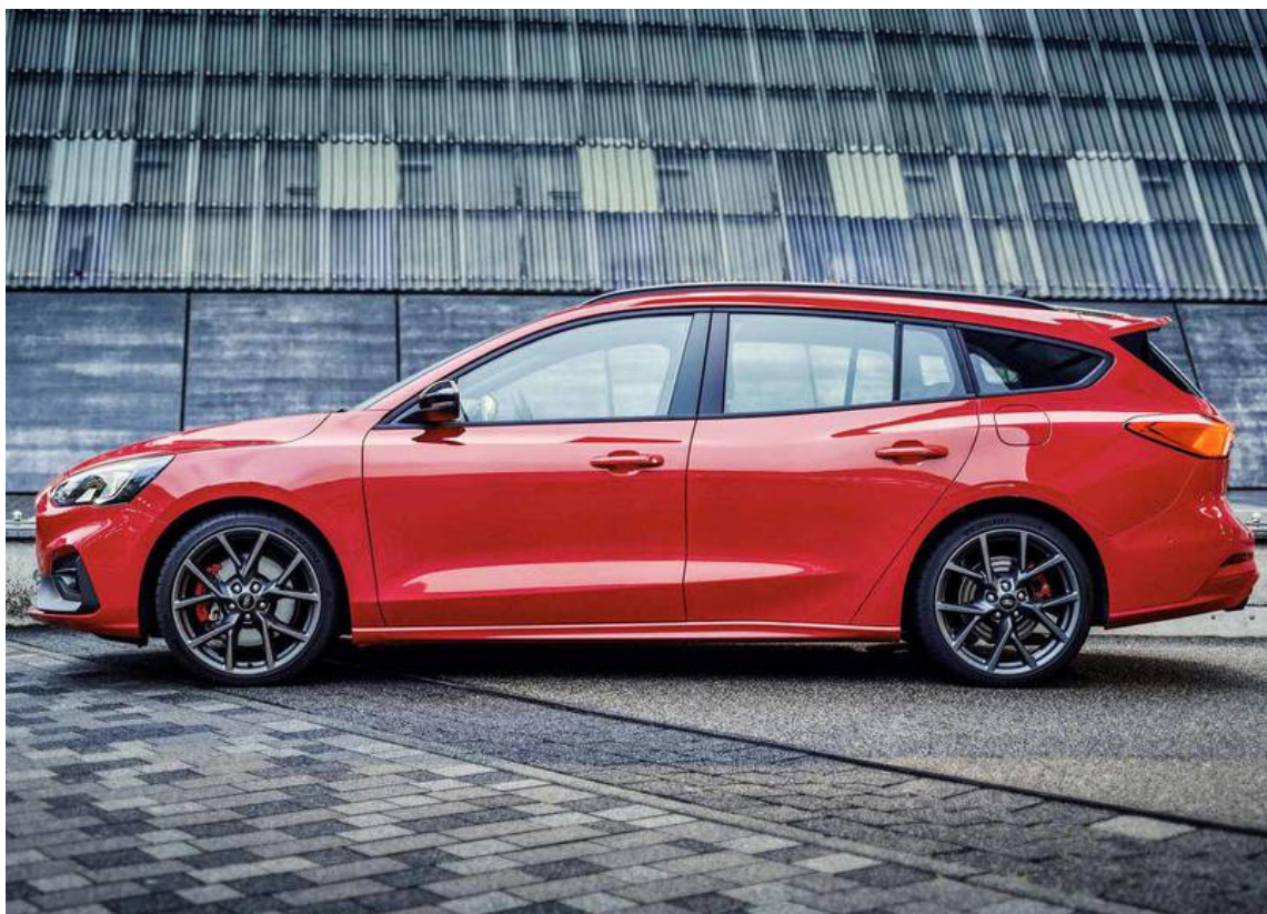
Ford Focus ST er innan við 6 sekúndur í hundraðið en búast má við því að langbaksútfærsla hans sé örlítið seinni.

Trump hyggst í fyrstu leggja á 5% tolla á allan varning frá Mexíkó sem fara svo síhækkandi ef Mexíkó gerir ekkert í því að stöðva ólöglegan innflutning fólks yfir landamærin til Bandaríkjanna. Þessir fyrirhuguðu tollar mundu kosta kaupendur þessarar hráolíu frá Mexíkó um 250 milljónir króna á dag, miðað við 5% toll og fara svo enn hækkandi. Mexíkó seldi Bandaríkjunum 9% af allri þeirri olíu sem til Bandaríkjanna var flutt í fyrra.