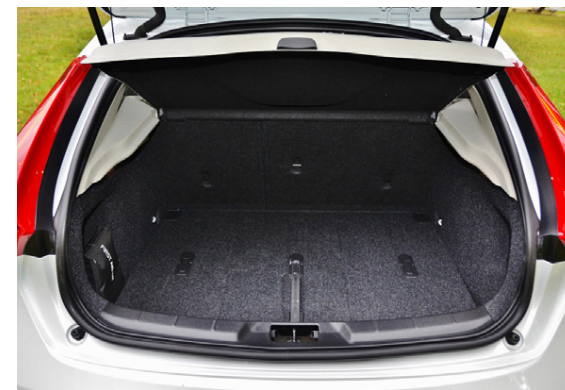
Skotrymið mælist 529 lítrar.