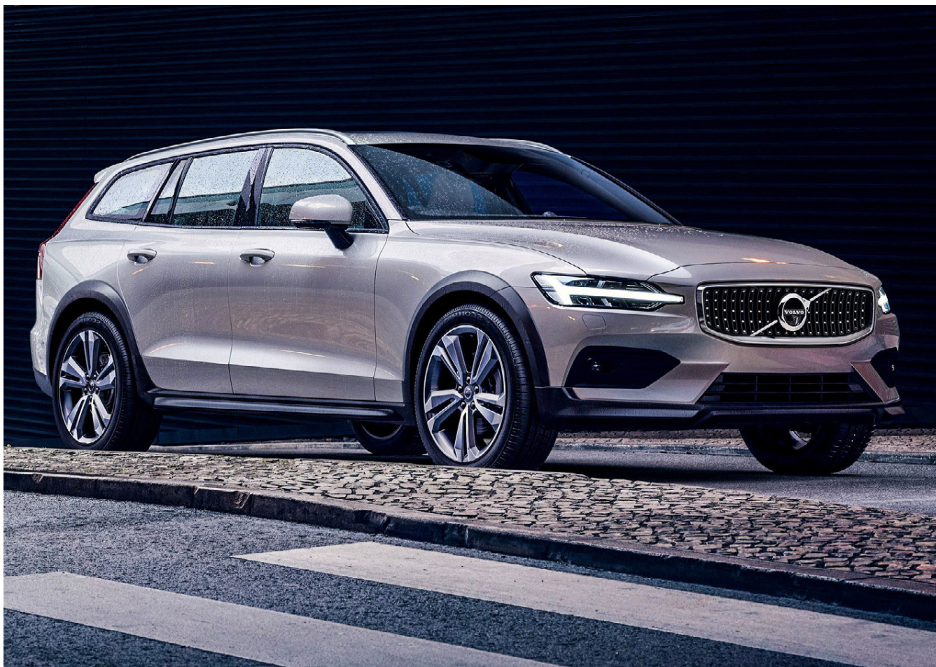
Volvo V60 Cross Country þykir að sumra mati fegursti bill Volvo þó svo af mörgu góðu sé að taka.