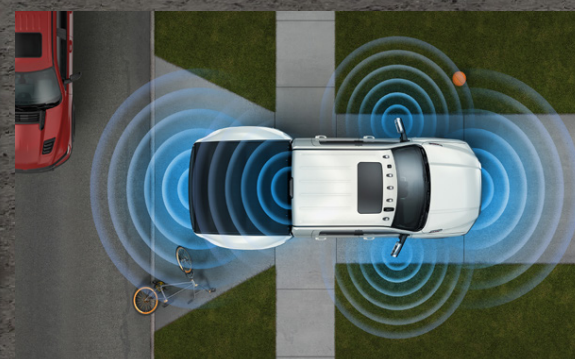
360° MYNDAVÉL, SKYNDARAR AÐ FRAMAN OG AFTAN

Nýr RAM 3500. Nýtt glæsilegt útlit, nýjar útfærslur og fjölmargar tækninýjungar í boði. Öflug 6.7 lítra Cummins díselvél, 6 þrepa sjálfskipting (AISIN sjálfskipting), 370/400 hestöfl. RAM 3500 er með mesta togið, mestu dráttargetuna og mesta innrarýmið (Mega Cab) í sínum flokki.