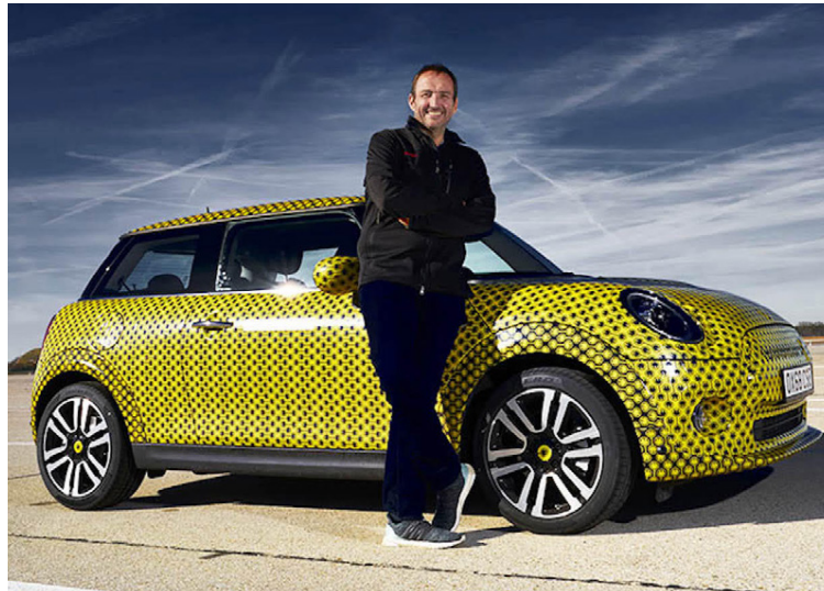
Mini Electric verður kynntur formlega á bílasýningunni í Frankfurt í haust.

Þ eir sem kynnst hafa þriggja dyra Mini vita af reynslunni hversu einstaklega skemmtilegur akstursbíll hann er, sérstaklega í borgarumferðinni. Þeir sem prófað hafa 100% rafdrifna frumgerð Mini sem BMW Group hyggst hefja framleiðslu á fyrir árslok í tilefni 60 ára afmælis sögu Mini á árinu, segja Mini EV lofa mjög góðu. Mini Electric verður kynntur formlega á bílasýningunni í Frankfurt í september. Bíllinn nýtur fjölmargra tæknilausna rafbíladeildar BMW Group og segir Thomas Geiger hjá Auto Express sem prófað hefur frumgerðina að rafbíllinn muni ekki svikja neinn