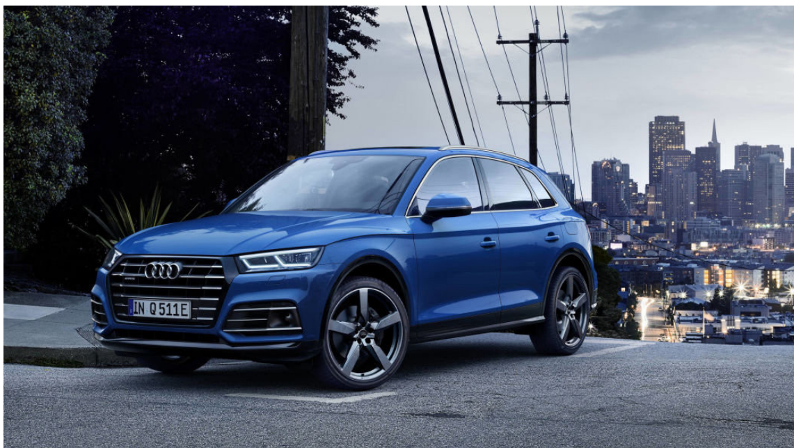
Audi Q5 PHEV er með 367 hestafla drifrás og er litlar 5,3 sekúndur í hundraðið.

rafhlöður sem teknar hafa verið eða verða teknar úr Leaf bílum sem fargað er. Dæmi um slíkt er þriggja megawatta rafhleðslustöð sem sett var saman úr 148 rafhlöðum úr Leaf í Amsterdam Arena fótboltavellinum í Hollandi og sér þar um rafmagnsnotkun á vellinum.