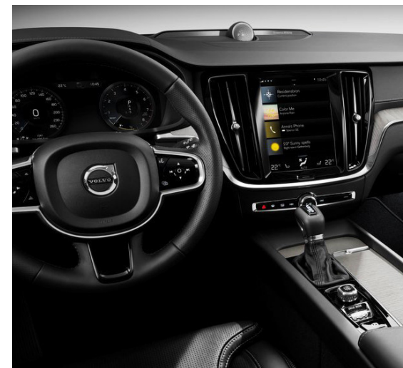
Naumhyggja einkennir innréttingar Volvo.