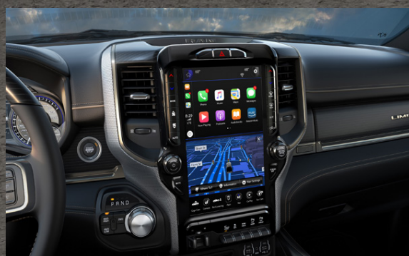
12" SNERTI- OG UPPLÝSINGASKJÁR