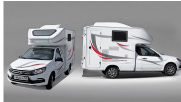
Lada Camper er ódýr kostur.

eldunarstöðu og vaski, klósett og sturta og nokkuð stór skápur. Vatnstankurinn tekur 70 lítra og er hann með hitunarbúnaði og affallstankurinn tekur 45 lítra. Billinn er með rafmagnstengi sem smella má í samband á betri tjaldstæðum. Billinn mun aðeins kosta á bilinu 2,2 til 3,4 milljónir króna, allt eftir búnaði og útfærslu. Stutt er í að þessi ódýri húsbíll komi á markað í Rússlandi.