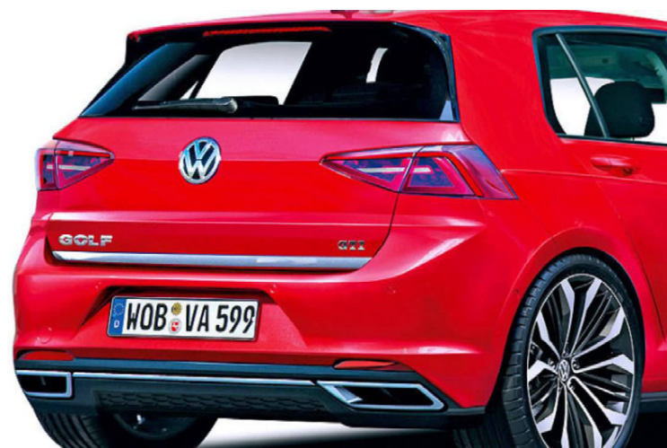
Volkswagen Golf hverfur af markaði í Bandaríkjunum en ekki í Kanada.

Þegar ný áttunda kynslóð Volkswagen Golf kemur á markað mun Volkswagen hætta að bjóða hefðbundna gerð þessa godsagnarkennda bíls í Bandaríkjunum. Núna er þeir Golf bílar sem seldir eru vestanhafs sérstaklega útbúnir fyrir Bandaríkjamarkað, en því ætlar Volkswagen að hætta frá og með næstu kynslóð. Það þýðir þó ekki að kraftagerðirnar Golf GTI og Golf R hverfi líka af markaði í Bandaríkjunum, því þeir verða þar í boði áfram. Volkswagen Golf Sportswagen, þ.e. langbakurinn, hefur einn-