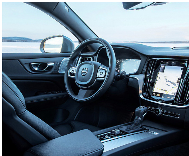
Eins og í öðrum Volvo bílum er innréttingin gullfalleg.

Í reynsluaksturssílnum var leðurinnrétting og Harman Kardon hljóðkerfi, sem ásamt ýmsu öðru góðgæti lyfti verði bílsins frá grunnverðinu 6.990.000 kr. í um 8,8 milljónir. Það hækkar því hratt