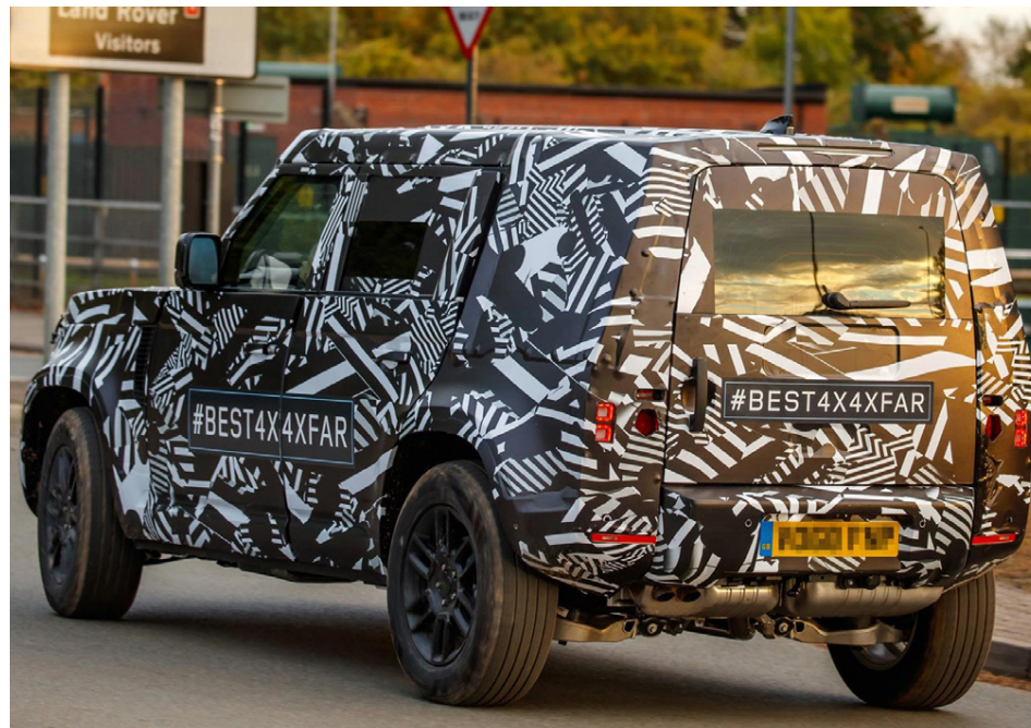
Land Rover Defender er goðsagnarkenndur bíll sem gengur nú í endurnýjun lífdaga.

Það er vel við hæfi að lokaprófanirnar fari fram í Afríku þar sem Land Rover hefur verið áratugum saman helsti vinnuþjarkur starfs-