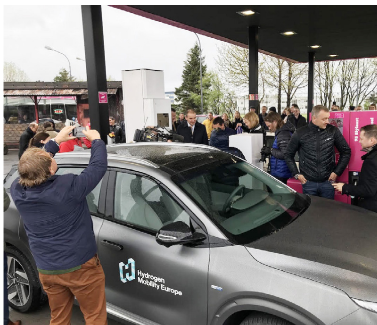
Nýrri vetnisstöð Orkunnar við Miklubraut fagnað á dögnum.

Vetnisgeymirinn er 156,6 lítrar (6,3 kg) og dregur Nexo allt að 666 km á tankinum samkvæmt WLTP. Það er svipað drægi og margra bensín- og dísilfólksbíla í umferðinni. Eins og með alla bíla óháð orkugjafa fer nýting eldsneytisins eftir ökulagi, veðurastæðum og fleiri þáttum. Nokkrar mínútur tekur að fylla vetnistank Nexo og þar sem bíllinn þolir „kaldstart“ í allt að -30°C er ljóst að Nexo hentar