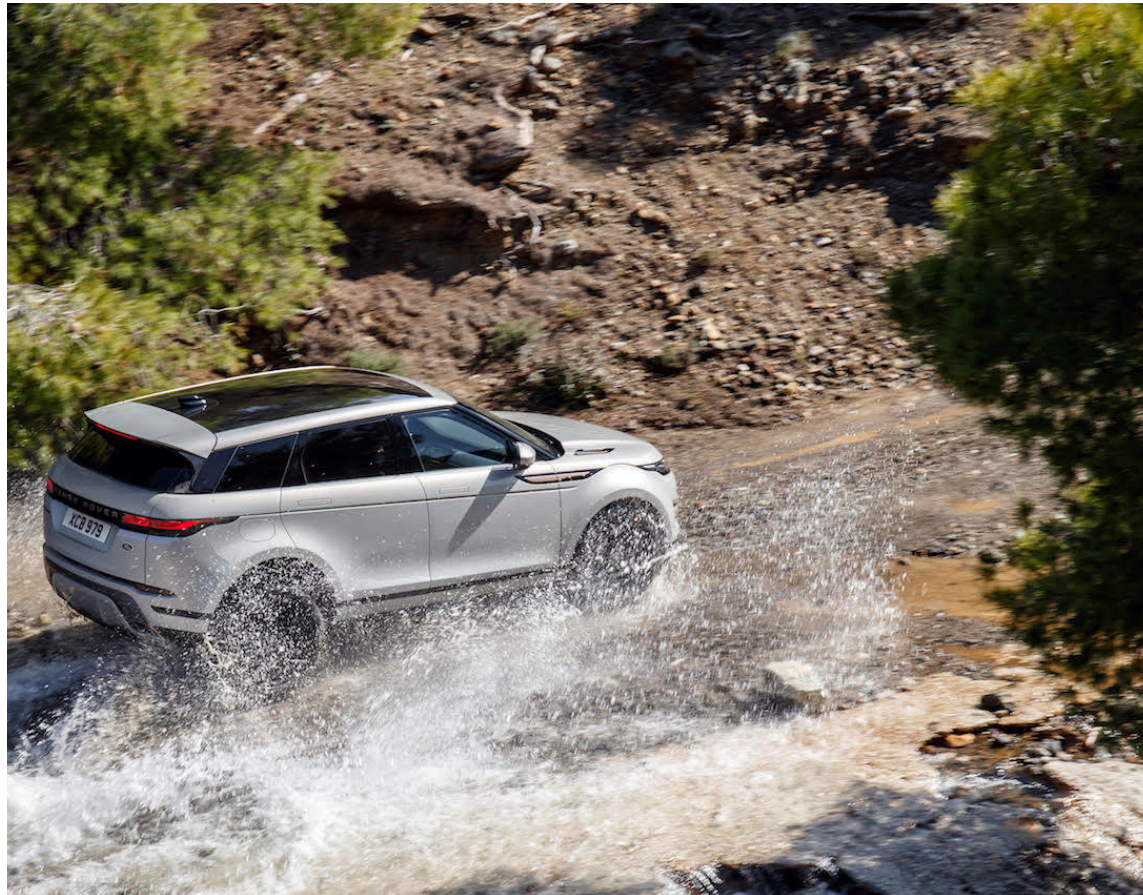
Sérkennandi útlit og línur Evoque njóta sín áfram enda á hvort tveggja ríkan þátt í miklum vinsældum bílsins.

Evoque er að sjálfsgöðu fjórhjóladrifinn eins og áður en sú nýjung er nú til staðar í nýrri kynslóð að aflið til afturhjóla aftengist sjálfkrafa þegar þess gerist ekki þörf til að draga úr eldsneytiseyðslu. Er Evoque því að mestu framhjóladrifinn í venjubundnum borgarakstri og á langkeyrslu. Þá er Evoque enn fremur fyrsti bíll Jaguar Land Rover sem kemur með 48 volta mildri tvinndrífás (Mild Hybrid) sem styður við mismunandi dísil- eða bensínvélar