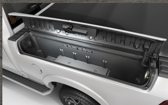
RAM BOX MEÐ 400W RAFTENGI