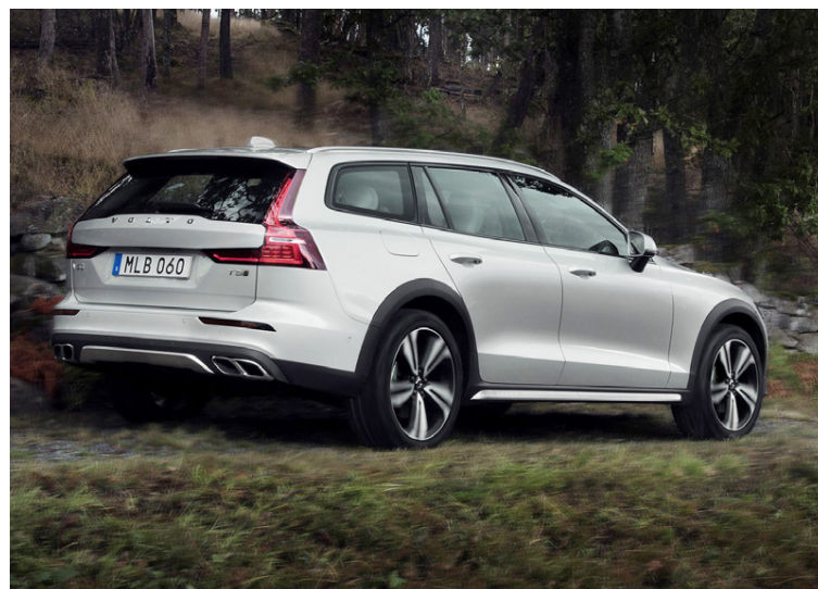
Fagur frá öllum hliðum og greinilega tilbúinn í átök.

verðið þegar tikkad er í aukahlutaboxin. Billinn er þó ansi vel búinn í grunnútfærslu. Eitt af því sem kaupendur á Volvo V60 Cross Country fá umfram hefðbundinn V60 er ljúfari og mýkri fjöðrun sem fer betur með farþega, en fyrir þessum mismun finnst vel. Sem mikill aðdáandi langbaka,