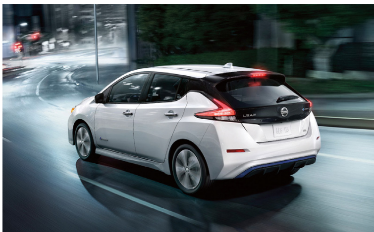
Nissan Leaf er söluhæsti rafmagnsbíll heims.