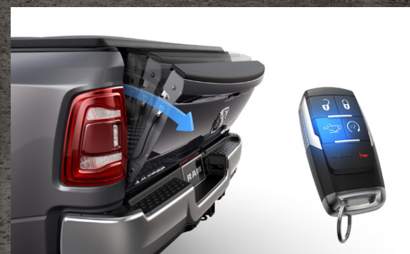
FJARSTÝRÐ OPNUN AFTURHLERA