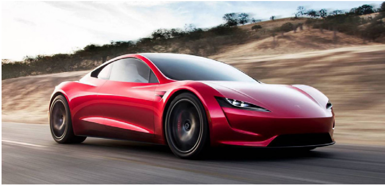
Tesla Roadster sportbíllinn verður heimsins sneggsti bill.