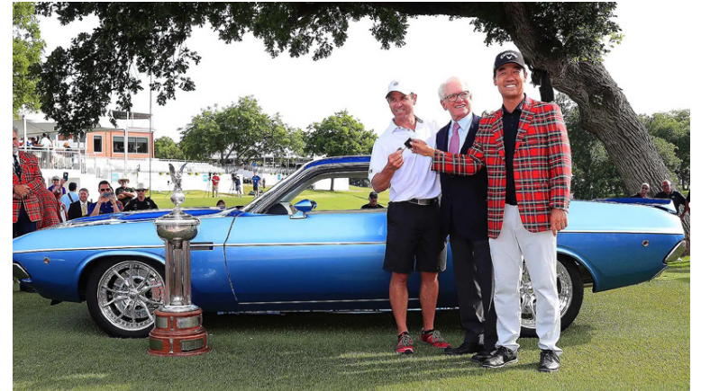
Kevin Na og aðstoðarmaður hans við Dodge Challenger bílinn.

PGA-golfarinn Kevin Na er greinilega gjafmildur maður, en hann hefur líklega efni á því. Kevin Na gerði sér lítið fyrir og vann PGA-mótið Charles Schwab Challenge og fékk fyrir vikið 1,3 milljón dollara vinningsfé, eða um 160 milljónir króna. Það var þó ekki það eina sem hann hlaut í vinning fyrir sigurinn því honum fylgdi líka forláta sérlega vel uppgerður Dodge Challenger bíll af árgærd 1973, en sá bíll verður að teljast til fegurri bíla áttunda áratugar síðustu aldar. Kevin Na gerðist svo rausnarlegur að gefa aðstoðarmanni sínum, eða caddie eins og þeir eru kallaðir upp á enska tungu, bílinn.