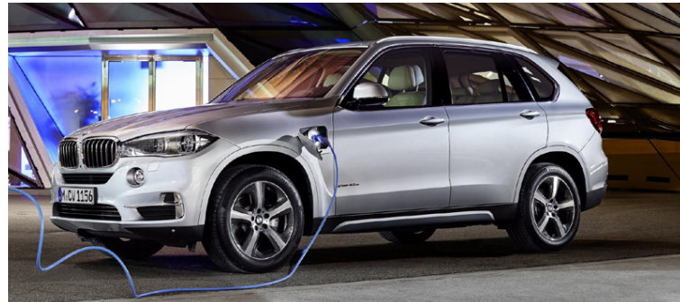
BMW X5 er sá bíll sem mest er stolið af í Bretlandi.

hafi góðan smekk þar sem allar 10 mest stolnu bílgerðir í landinu flokkast sem dýrir lúxusbílar. Aðeins þrjú bílamerki koma þar við sögu, Mercedes Benz, BMW og Jaguar Land Rover. Líklega ekki mjög eftirsóknarverð staðreynd fyrir þessa bílaframleiðendur, en þeir geta þó huggað sig við það að bílar þeirra eru eftirsóknarverðir, en því miður líka á meðal bílþjófna.