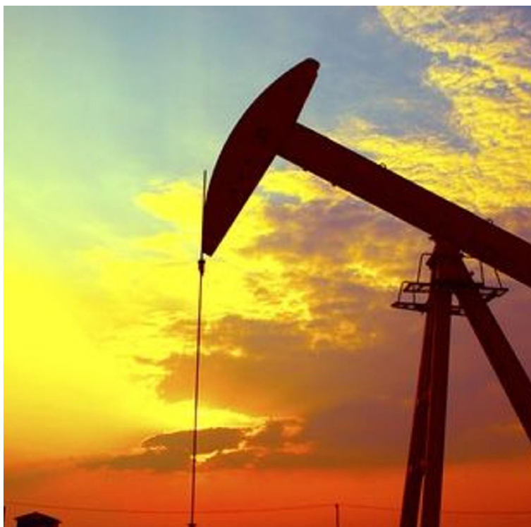
Tollar á varning frá Mexíkó byrja í 5% en fara svo hækkandi.