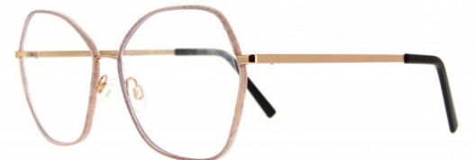
Þessi fallegu gleraugu eru frá Vanni og fást í Eyesland.