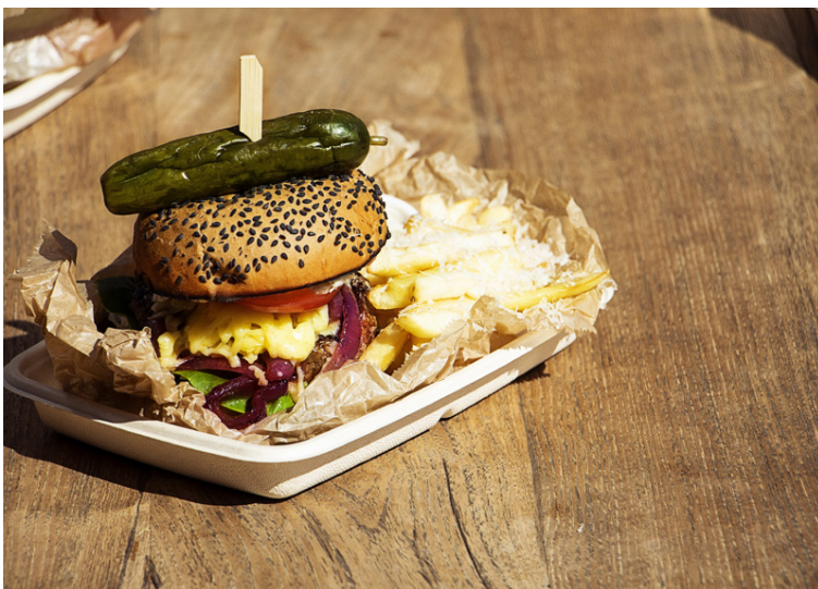
Grillaður hamburgari á Geira Smart er algjört lostæti.