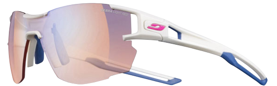
AEROLITE frá Julbo. Mjög nett og létt umgjörð. Sérstaklega hönnuð fyrir hlaupara. Dökkna í sól frá ljósbleiku yfir í brúnt. Skerpa sérstaklega vel á litum í umhverfinu ásamt því að vernda augun vel.