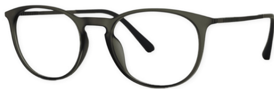
Þessi eru frá Jensen og fást í Eyesland.