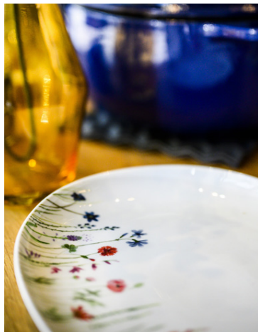
Sumarið er líka komið og blómstrar í þessu undurfagra matarstelli.