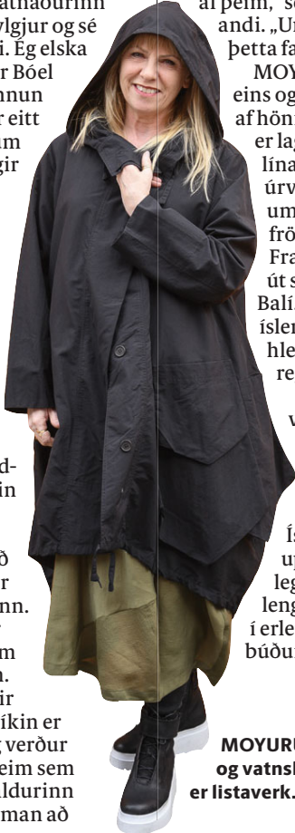
MOYURU frakkar eru vind- og vatnsheldir og hönnunin er listaverk.