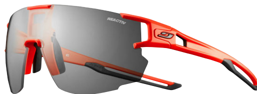
Aerospeed frá Julbo. Aerospeed sportgleraugu loka vel á sólarljós og vind og henta því vel á racer-hjólum. Glerið dökkar í sól, frá glæru gleri í dökkgrátt. Ekki næm fyrir hita/kulda og eru með móðu- og kámvörn.