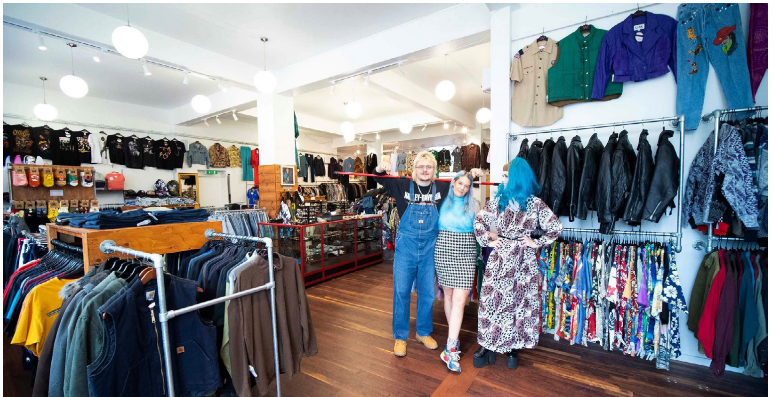
Wasteland er með mikið úrval af fötum, skarti og sólgleraugum.

Þegar kom að því að finna staðsetningu fyrir verslunina komu ekki margir staðir til greina. „Það var aldrei nein spurning að opna búðina neins staðar annars staðar