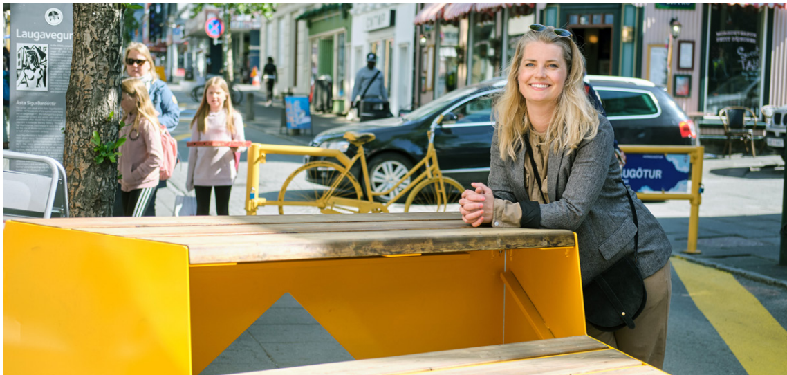
Edda segir gleðilega upplifun að heimsækja miðborgina sem er komin í sumarþúning.

„Við viljum endilega fá barnafjölskyldur til að koma oftar niður í bæ, þar sem fólk upplifir sig í öruggu umhverfi en það gerir maður ekki við bílagötur. Því höfum við skapað skemmtileg svæði þar sem fólk getur andað rólega með börn sín að leik og þar