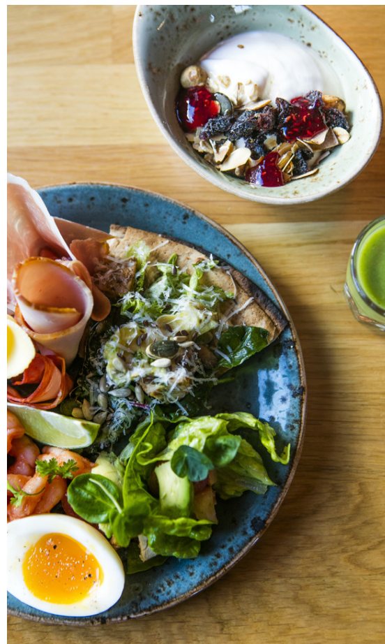
Æðislegur bröns á Slippbarnum.