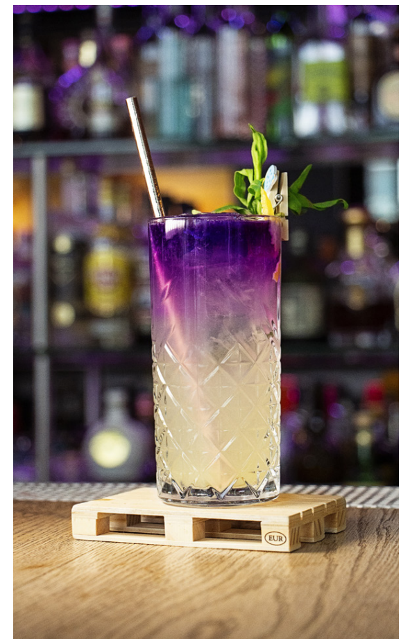
Slippbarinn er þekktur fyrir glæsilega og góða kokteila.