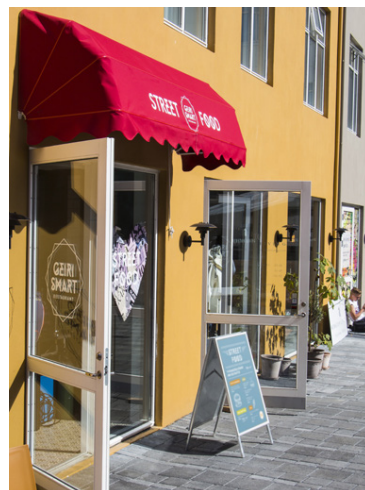
Það er hægt að sitja úti við Geira Smart og í sumar verður boðið upp á grill í garðinum.

Eins er matseðillinn á Geira Smart kominn í sumarþúning og státar af réttum eins og bleikju með eplum, fennel, möndlum, kapers og kartöflum og rauðröfum með heslihnetum, ricotta, svörtum hvítlauk og reyktum vorlauk og eftirétti sem heitir einfaldlega Lakkríssúkkulaði. Bragðlaukarnir munu þakka þér.