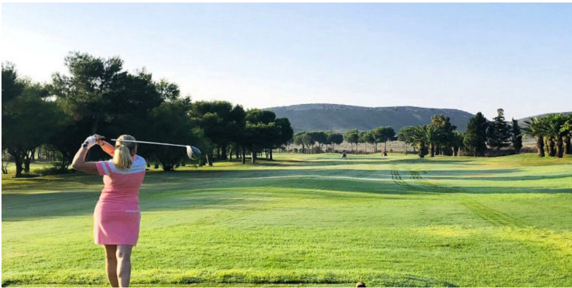
Golfið er alltaf jafnvinsælt. Í haust er hægt að fara í styttri eða lengri ferðir til Spánar þar sem boðið er upp á glæsilega golfvelli. Aðstaðan á El Plantio fyrir kylfinga er alveg meiriháttar og margir fara þangað aftur og aftur.