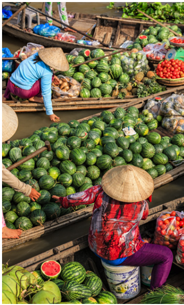
Víetnam hefur verið gríðarlega vinsæll áfangastaður enda óskaplega fallett þar og íbúar gestrisnir.

„Á mörgum stöðum er salernisaðstaða bágborin, hvorki pappír né vatn. Á slíkum stöðum er nauðsynlegt að hafa með sér sótthreinsandi blautklúta og þurrkur. Í Kína eru til dæmis salernin aðeins hola í gólfinu víðast hvar.“