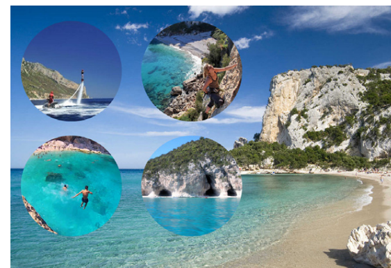
Sardinía er þekkt fyrir tæran sjó og fallegar strendur. Þar er bæði hægt að slappa af og njóta afþreyingar.