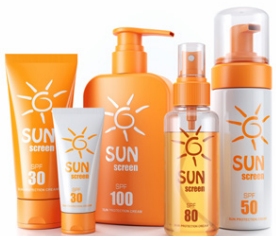
Sólarvörnin er gríðarlega mikilvæg fyrir húðina.

Búlgaría er æ vinsælli ferðamannastaður. Þar eru sólrikar strendur, ódýr mat og drykkur, falleg menning og fornar byggingar til að skoða. Búlgaríska borgin Plovdiv er talin vera ein elsta borg Evrópu en hún er meira en 6.000 ára gömul. Búlgaría er kallað Land rósanna þar sem meirihluti framleiðslu rósaolíu í heiminum kemur þaðan. Fyrir utan það er landið stórtækt í framleiðslu á lavenderolíu sem færir burt lúsmý. Fyrir þá sem þekkja litið til Búlgaríu lýsir bókinn The Shadowland eftir bandaríska höfundinn Elizabeth Kosdova landslaginu og menningunni vel. Bókin fjallar um unga bandaríska konu að nafni Alexandra Boyd, sem flytur til Búlgaríu til að kenna ensku. Fyrir slysi endar hún með duftker í eigu gamalla hjóna sem inniheldur ösku Stoyan Lazarov. Alexandra reynir að hafa uppi á hjónunum og kynnist um leið sögu mannsins sem er bæði sorgleg og falleg. Sagan lýsir vel margbreytilegri stemningunni í Búlgaríu á 20. öldinni í tengslum við aldagamla sögu landsins, stalinismann og hvernig landið ris hratt úr ösku Sovétríkjanna sálugu.