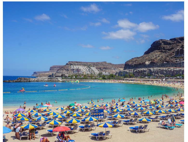
Strandlífið heillar alltaf. Tenerife og Gran Canarí eru vinsælir áfangastaðir.

„Tenerife hefur um árabil verið einn vinsælasti áfangastaðurinn en nú sækir Kanarí mjög á enda hefur mikil breyting og uppbygging átt sér stað þar síðustu ár. Glæsileg hótél og veitingastaðir.“