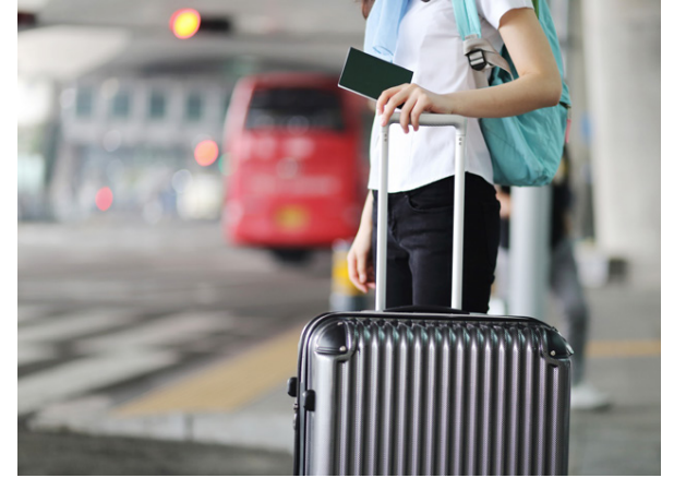
Undirbúningur fyrir ferðalög mikilvægur.

Þó að oft sé hægt að bjarga sér bara með greiðslukorti er ekki víst að það sé jafn auðvelt alls staðar. Það borgar sig því að hafa alltaf með sér einhvern gjaldeyri í seðlum. Svo er bara að muna eftir góða skapinu. Góða ferð!