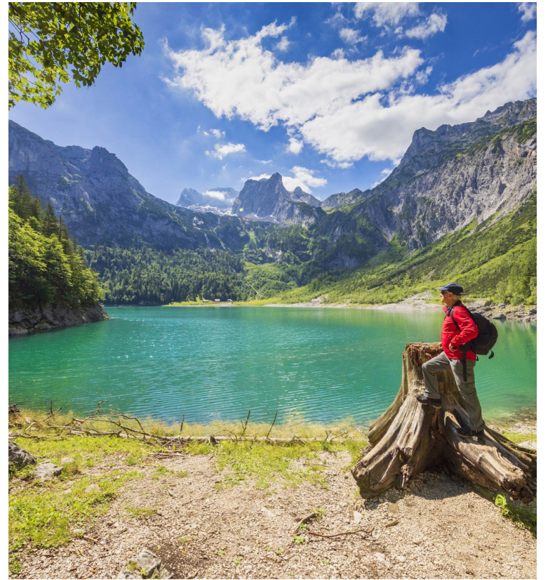
Hreyfiferðir eru í upphaldi hjá mörgum. Fjölbreytt úrval hreyfiferða verður í boði hjá Úrval Útsýn í vor, meðal annars rafhjólalferðir.