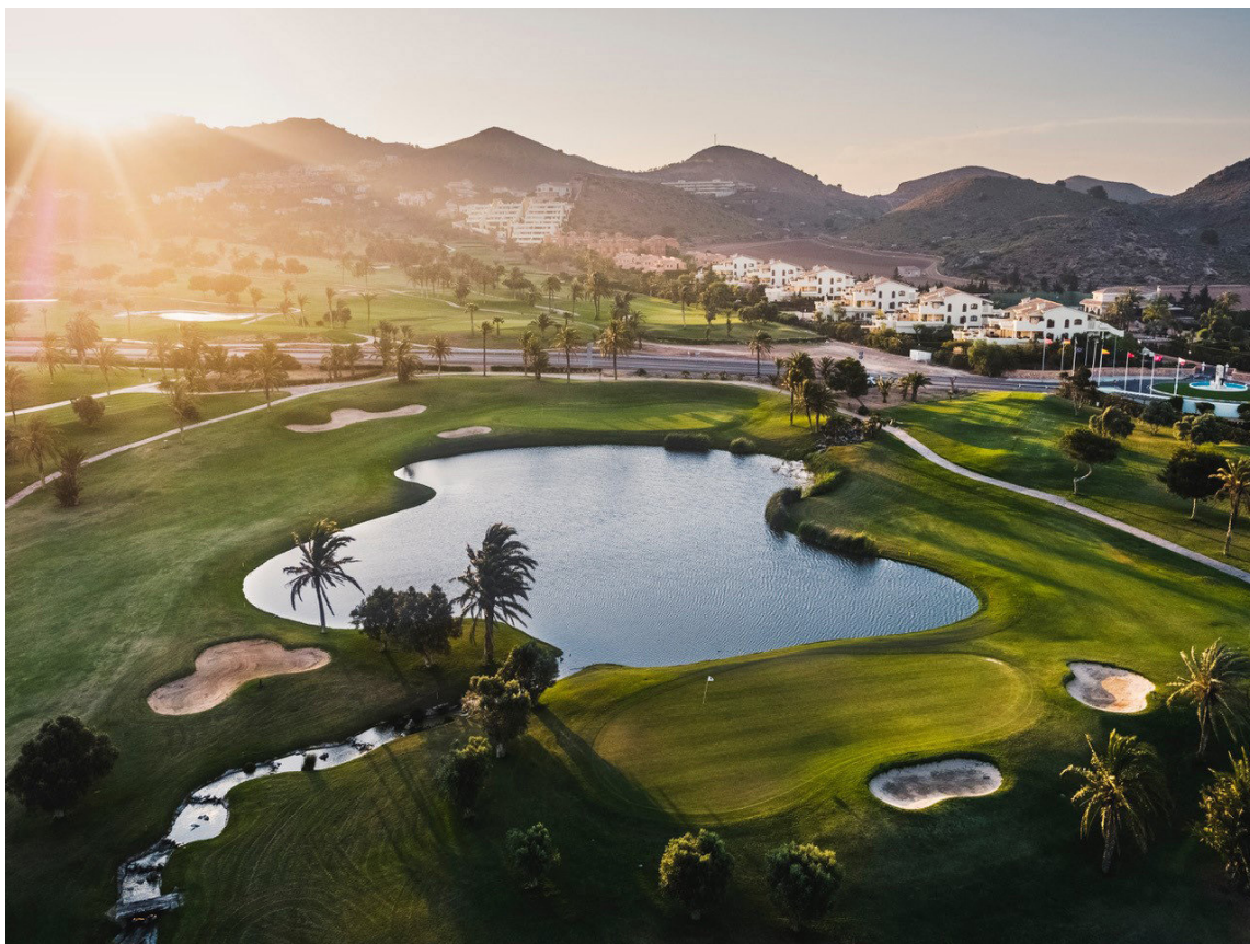
La Manga Club Golf er einn sá glæsilegasti í Evrópu.

*Allt um ferðir Fótboltaferða er hægt að finna á heimasíðu þeirra, fotboltaferdir.is.