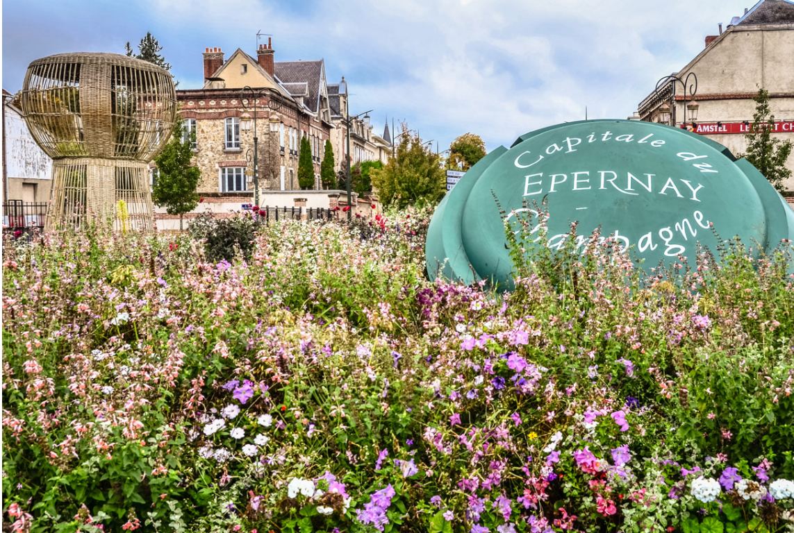
Epernay er höfuðstaður kampavinsframleiðslunnar í Frakklandi. Þangað er ferðinni heitið í haust með Úrvali Útsýn.