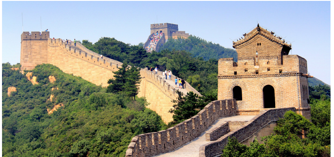
Það er gaman að koma til Peking og kíkja á Kinamúrinn í leiðinni. Ógleymanlegur staður. Einnig er nauðsynlegt að fá sér Peking-öndina í borginni.