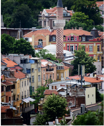
Plovdiv er talin vera elsta borg Evrópu.