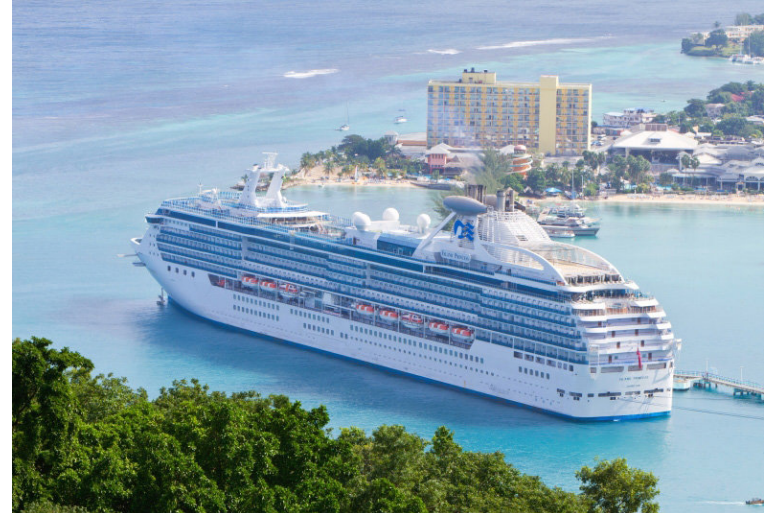
Mikill og vaxandi áhugi er meðal Íslendinga á alls kyns siglingum.

„Næsta vor verður fjölbreytt úrval af svokölluðum hreyfi-ferðum. Það eru skipulagðar rafhjóla- eða gönguferðir. Þetta verða skemmtilegar ferðir þar sem fólk fær hreyfingu en um leið er það að upplifa og njóta. Mikil eftirspurn