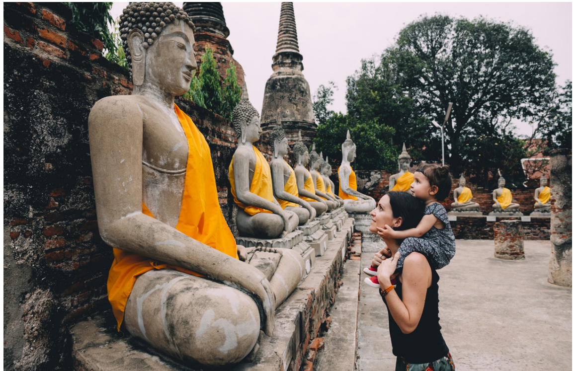
Tailand er vinsæll áfangastaður margra Íslendinga. Ef ferðast er um landið þarf að gæta að mataræði og hreinlæti.