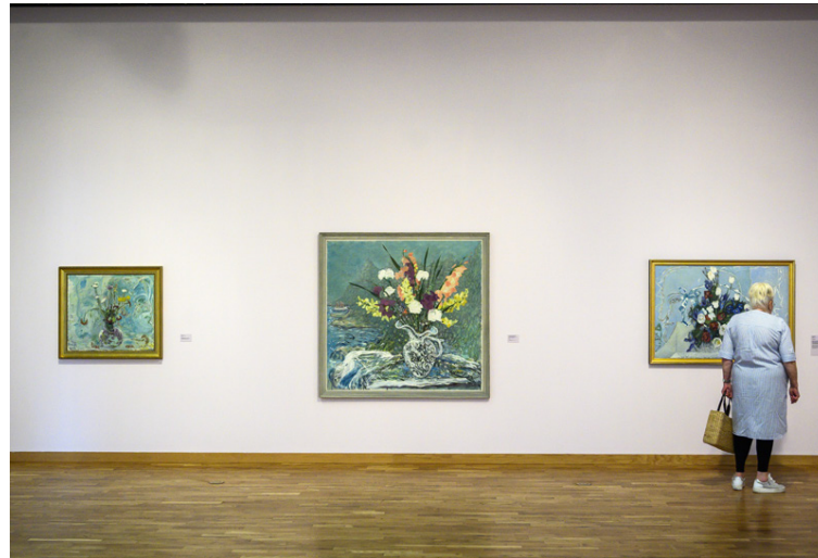
Á Kjarvalsstöðum er hálfgerft blómama um þessar mundir.