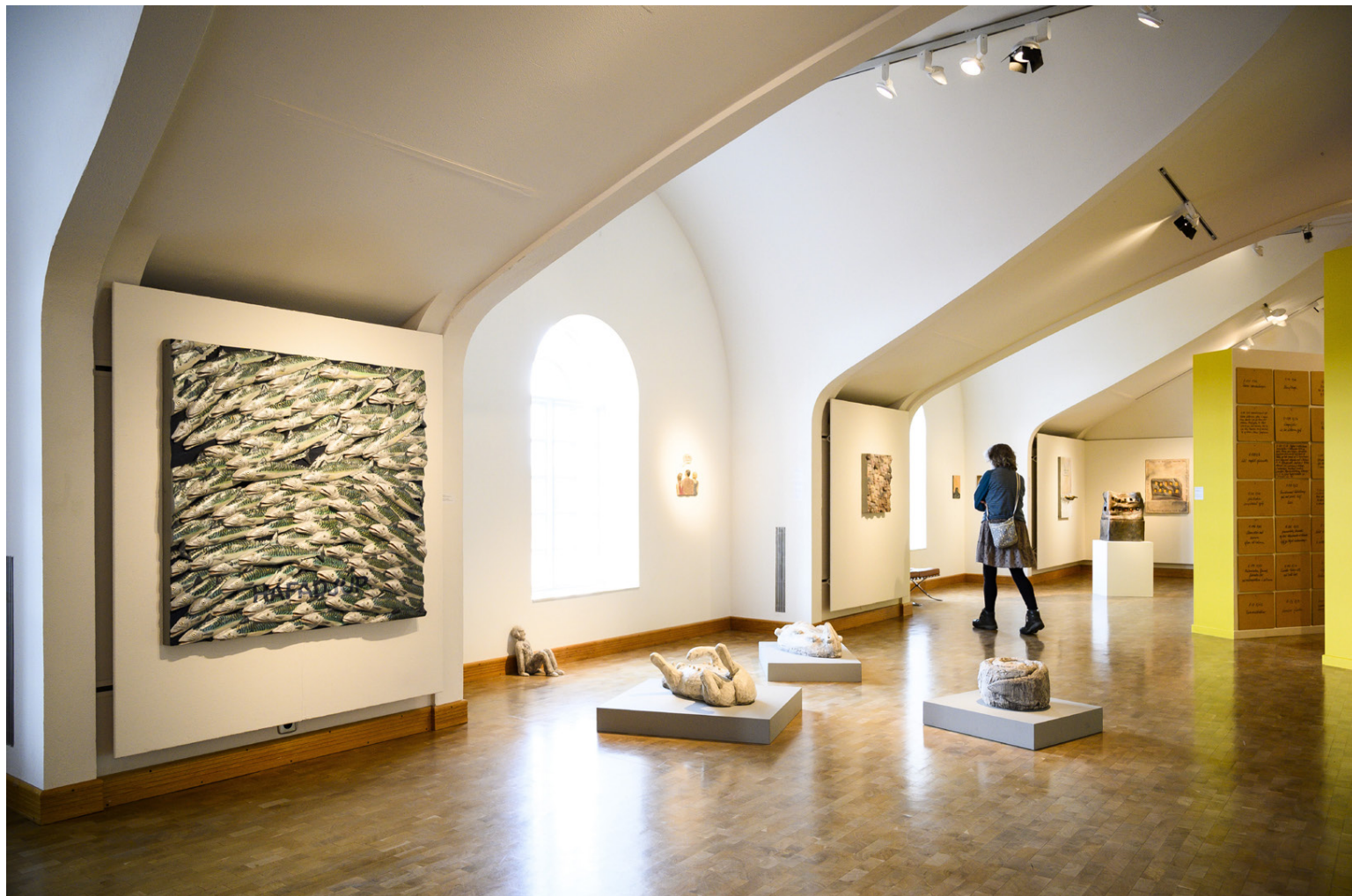
Það er mikið um að vera í Listasafni Íslands yfir sumartímann.

„Þessi sýning er alveg mögnuð og hún á erindi við almenning. Við sjáum og heyrum hversu vel þessi sýning höfðar til gesta okkar, bæði erlendra gesta og íslenskra. Verkin skírskota bæði til hversdagsleikans sem við öll þekkjum og til samfélagsins, oft með gagn-