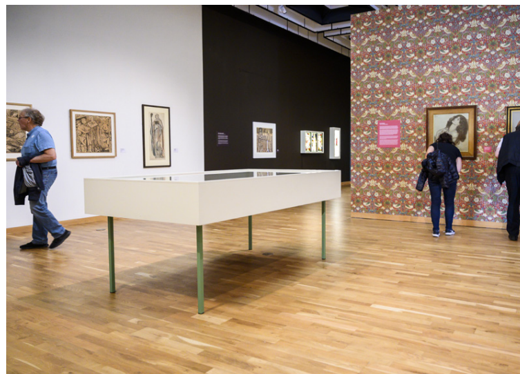
Verk Williams Morris eru vel þekkt í dag því enn er verið að framleiða ýmsa muni sem eru skreyttir með munstrum eftir hann.