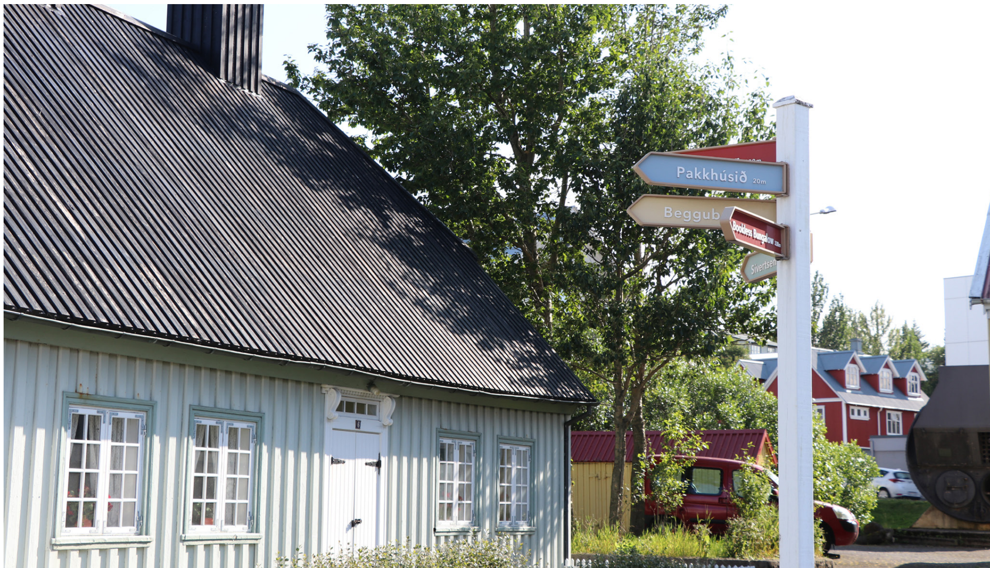
Safnstaðir í miðbæ Hafnarfjarðar eru sex talsins, sjö með Hafnarborg.