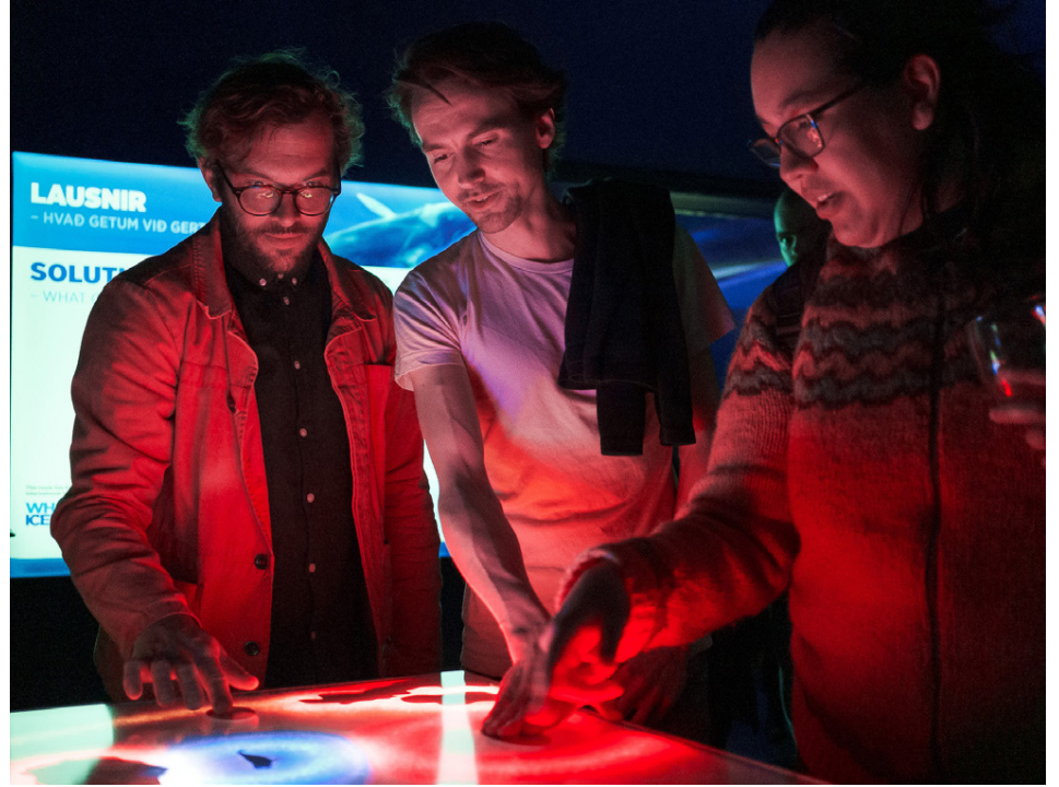
Gestir á opnun nýja sýningarýmisins prófa gagnvirkina.

Nýtt gagnvirkt sýningarrými var nýlega opnað á hvalassýningunni Whales of Iceland við Fiskislóð í Reykjavík. Þórdís Kolbrún Reykfjörð Gylfadóttir ferðamála- og nýsköpunarráðherra opnaði rýmið formlega.