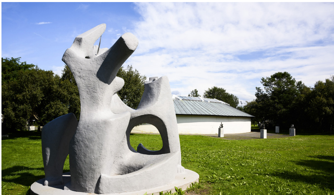
Árið 2019 er tileinkað list í almannarými og því hefur safnið lagt áherslu á að vekja athygli á þeim fjölmörgu listaverkum sem eru í borginni. Um alla borg er hægt að skoða falleg listaverk sem gleðja.

1820 og var alþýðulistamaður, flakkari og utangarðsmaður sem fór sínar eigin leiðir. Það er í raun ótrúlegt hvernig honum tókst að varðveita verk sín, því hann virðist hvergi hafa átt heima, blessaður.