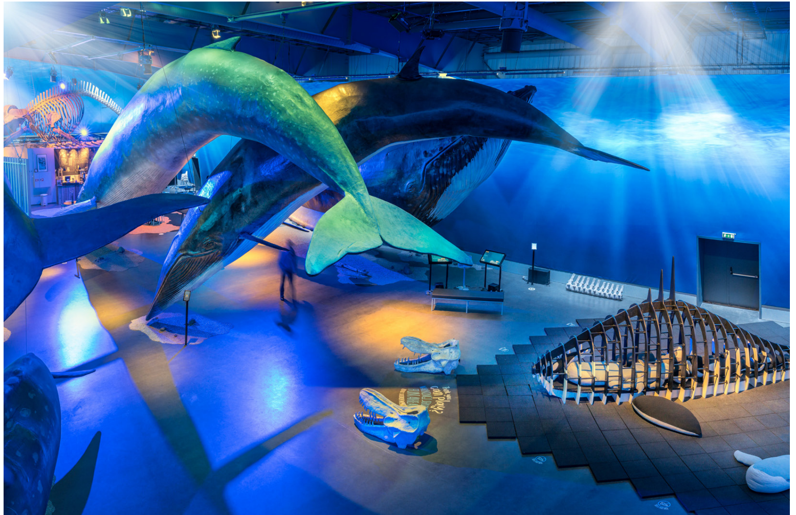
Hvalasýningin samanstendur af 23 hvalalíkönunum í raunstærð.

Hvalasýningin á Granda samanstendur af 23 hvalalíkönunum í raunstærð, af hvólum sem fundist hafa við strendur Íslands í gegnum söguna. Sýningin er ein sú stærsta sinnar tegundar í heiminum. Þar er til dæmis að finna bæði steypireyði og búrhval í fullri stærð og Íslandssléttbak sem nú er í bráðri útrýmingahættu og margt fleira. „Það var mikil vinna lögð í hönnun á líkönunum. Módelin eru öll handmálud og er hægt að sjá á þeim persónuleg einkenni