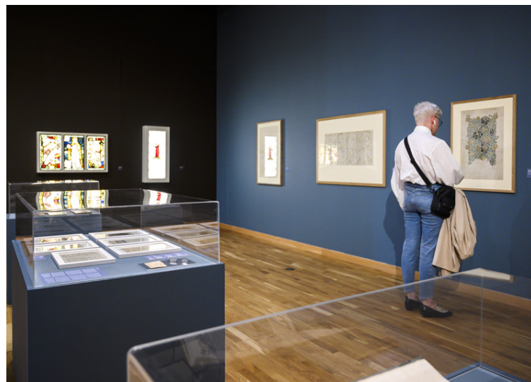
Á Listasafni Reykjavíkur er hægt að skoða mikinn fjölda glæsilegra málverka. Í einum salnum eru glæsileg verk eftir Erró.