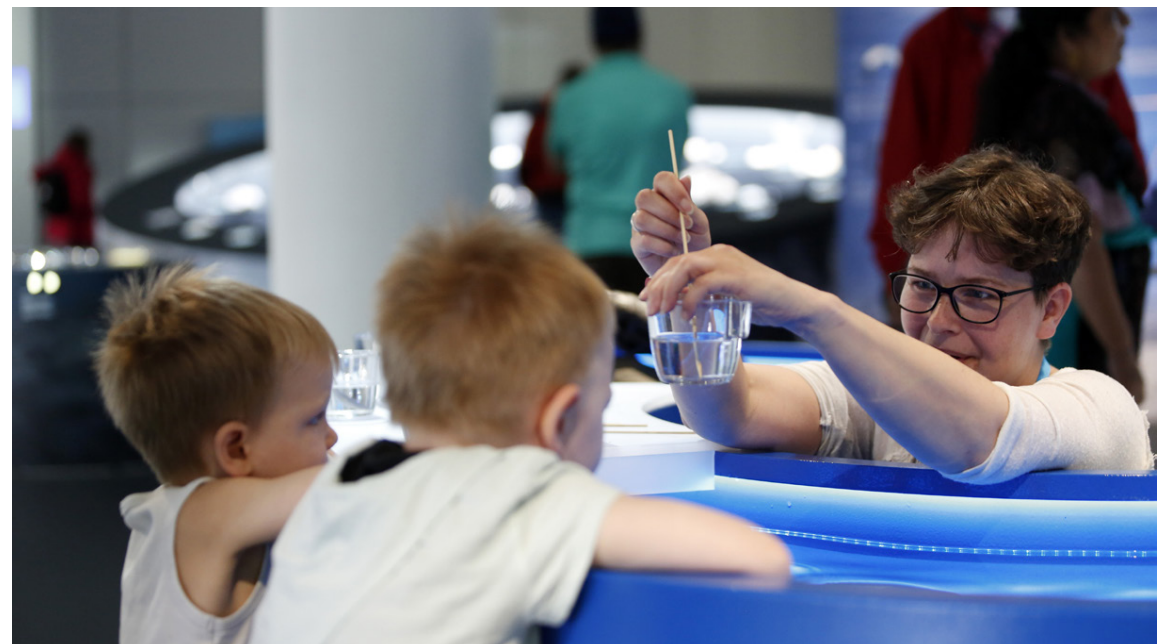
Spennandi tilraun í gangi og fylgst með af athygli.

1889. Félagið starfrækti sýningarhald á ýmsum stöðum í Reykjavík fram til 1947 og á árunum 1967-2007 rak Náttúrufræðistofnun Íslands, systurstofnun Náttúruminjasafnsins, sýningarsali á Hlemmi. Aðstæður voru hins vegar nær ávallt óviðunandi. Það er því