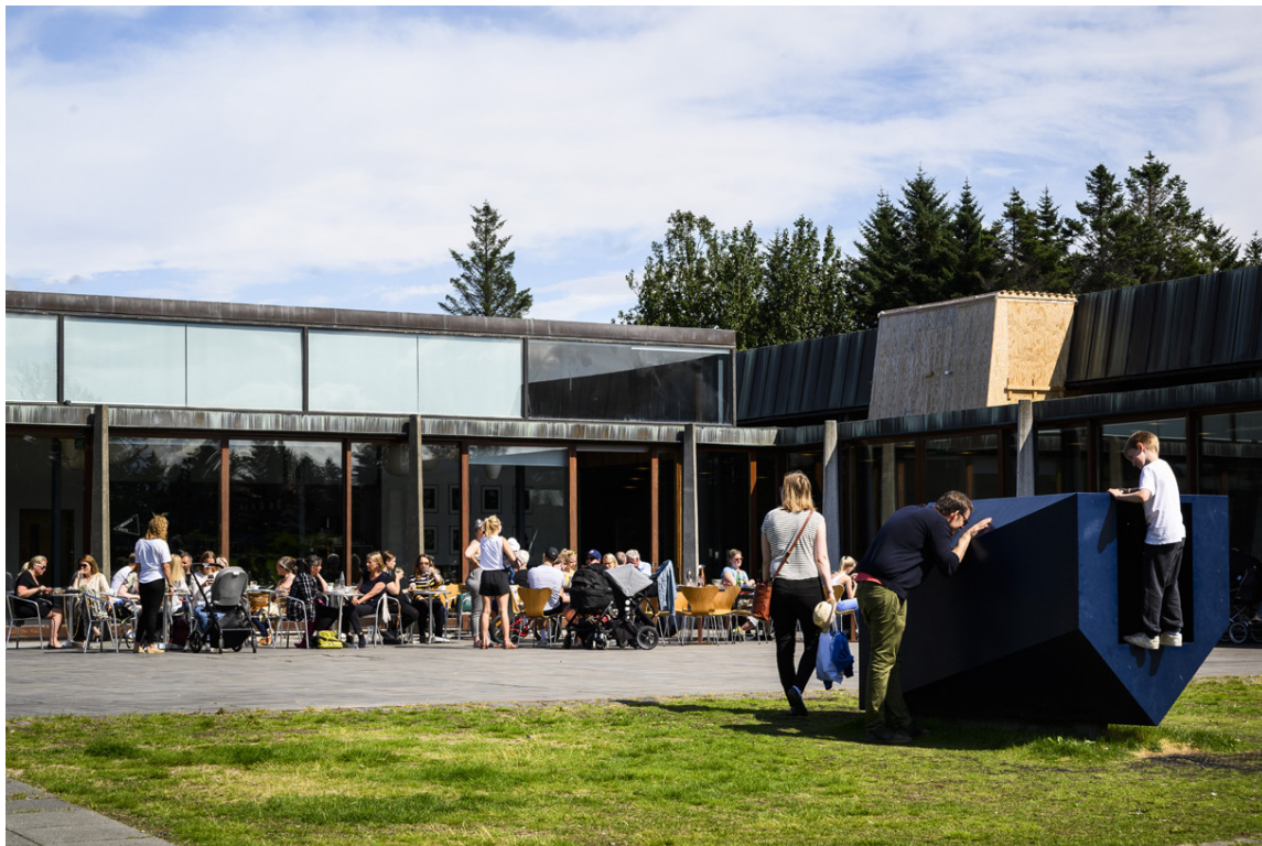
Á Kjarvalsstöðum er vinsælt kaffihús.