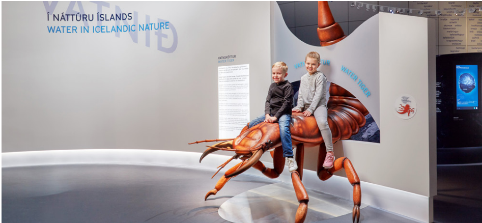
Vatnskötturinn, lirfa fjallaklukkunnar, er einkennisdýr sýningarinnar og tekur á móti börnum og leiðir þau um sýninguna. Krökkunum finnst gaman að setjast á bak.

kallast vistrýnir sem er lýst upp en þar fer maður um með hreyfanlegu stækkunargleri og þá birtast smáatriði til dæmis úr árbotni. Þetta er svakalega skemmtilegt og ég hefði getað verið þarna í klukkutíma," segir hún.