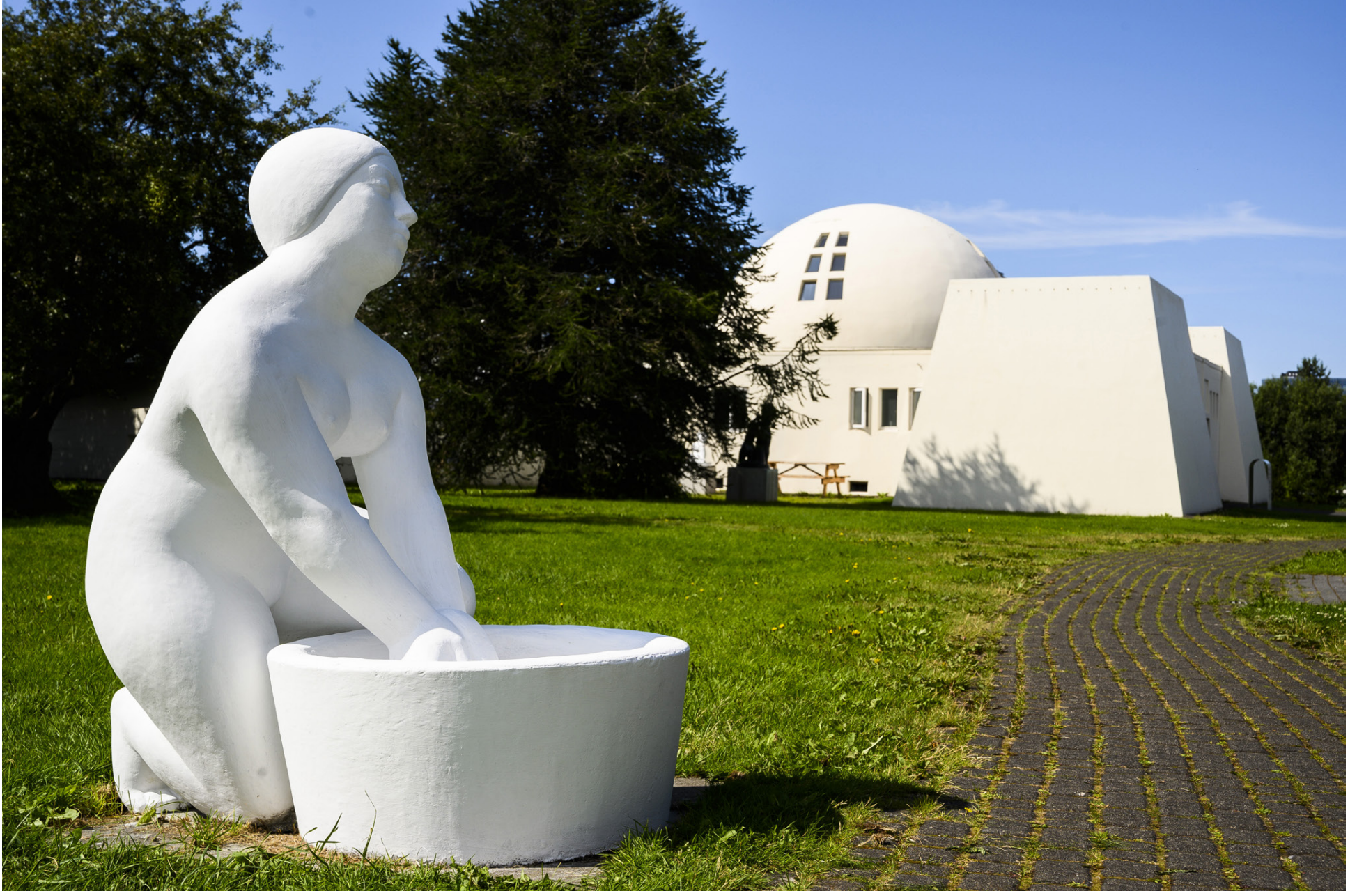
Listasafnið gaf nýlega út snjallsímaforrit til að fræða fólk um listaverk í borginni og listamennina sem gerðu þau.