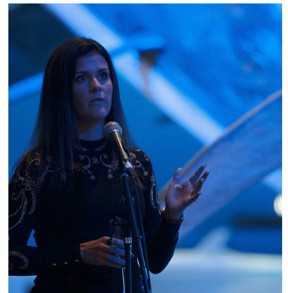
Þórdís Kolbrún Reykfjörð Gylfadóttir opnaði nýtt gagnvirkt sýningarrými á hvalasýningunni.