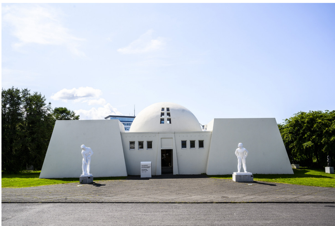
Á Ásmundarsafni eru verk Ásmundar til sýnis ásamt verkum eftir starfandi listamenn sem eiga verk í borgarlandinu. Þar er nú verið að sýna upprunalegar skissur og afsteypur af verkum í borgarlandinu.