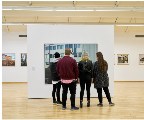
Áhugaverð sýning um sýn átta samtímaljósmyndara á Hafnarfjörð stendur nú yfir í Hafnarborg.

Hafnarfjörður er einstakur bær. Þar eru ævintýri og djúp saga við hvert fót mál, miðbærinn er fullur af lífi og hafnarsvæðið heillandi.