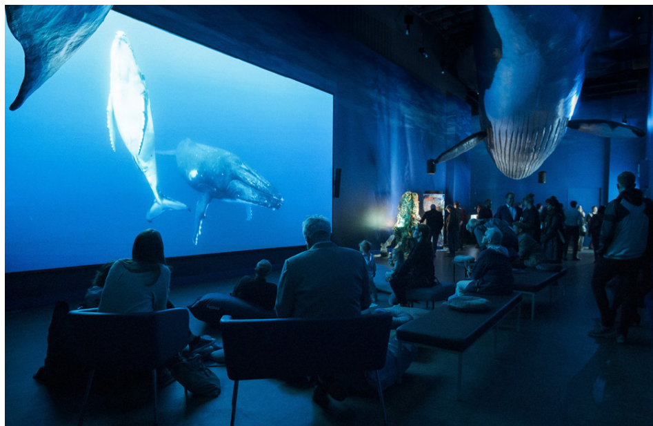
Neðansjávarmyndbönd eru sýnd á risastórum skjá.