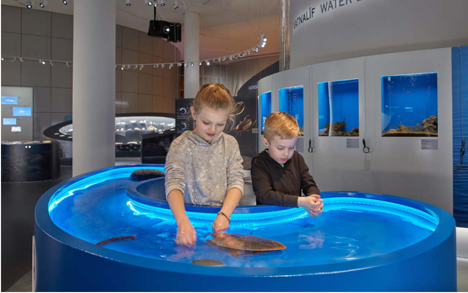
Það er gaman að gefa fiskunum að borða.