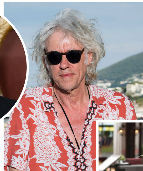
Tónlistarmaðurinn Bob Geldof á kvikmyndahátíð á eyjunni Ischia við Ítalíu.