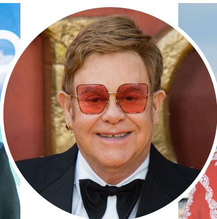
Elton John er auðvitað þekktur fyrir gleraugnasmekk sinn. Hér er hann á frumsýningu á Lion King í London.