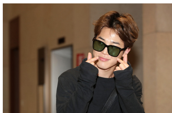
Suðúrkóreska hljómsveitin BTS er að slá í gegn um allan heim. Þetta er strákaband sem hefur verið að troða upp í Bandaríkjunum þar sem hljómsveitin er mjög vinsæl. Hér er einn söngvari sveitarinnar, Jimin. Hljómsveitin hefur hlotið margar viðurkenningar.