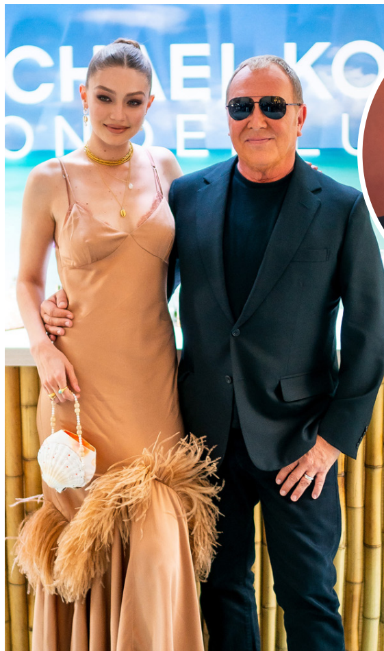
Gigi Hadid er ein þekktasta ofurfyrirsæta í heimi um þessar mundir. Hér er hún með vinsælum handtöskuhönnuði, Michael Kors. Skyldi hann hafa hannað þessi gleraugu sjálfur? Myndin er tekin í Rockefeller Center í New York.

Hér á síðunni má sjá nokkra þekkt einstaklinga með sólgleraugu. Myndirnar eru allar nýjar svo þær ættu að geta lýst sumar-tískunni í ár.