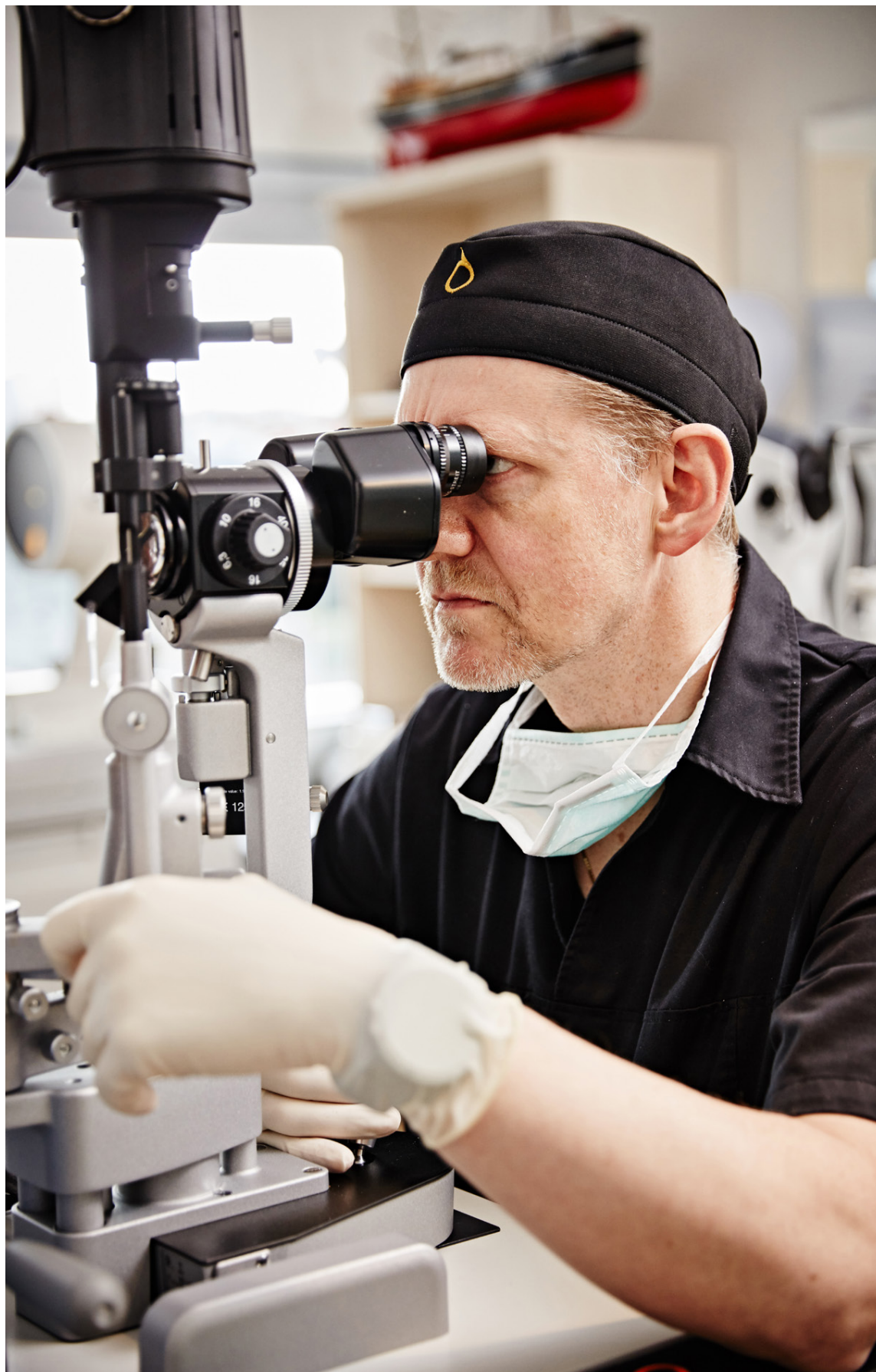
Augljós býður upp á tvenns konar augnaðgerðir.

„Stærsti munurinn á þessum aðgerðum er sá að það tekur lengri tíma að jafna sig eftir transPRK