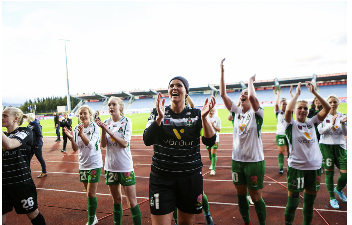
Sonný og liðsfélagar hennar fagna hér bikarmeistaratitlinum í fyrrasumar.

„Að þurfa ekki að byrja alla morgna á því að setja linsurnar í augun er þvilík breyting.“