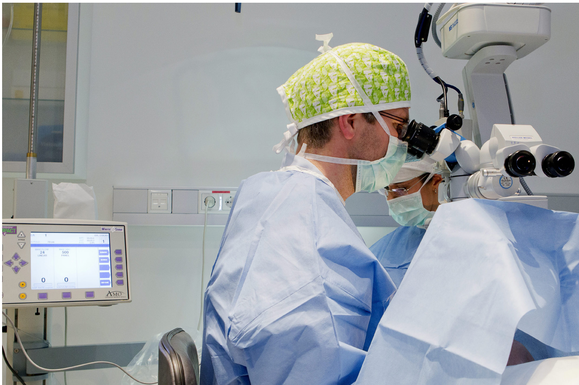
Augnæknar hjá Sjónlagi hafa framkvæmt á annan tug þúsunda laseraðgerða.