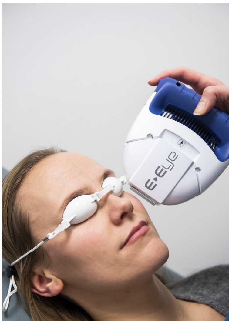
Táralind notar hátækniþúnað í meðferðum sínum.

„Mestu gæðin eru síðan svokallaður Multyfocal augasteinn eða fjölfökus sem gefur þér möguleika á því að vera algjörlega gleraugnalaus, en það er auðvitað einstaklingsbundið. Þetta þarf fólk