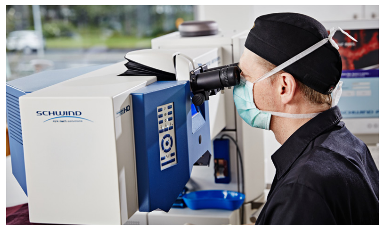
Ekkert lát er á vinsældum augnaðgerða

Jóhannes segir skiljanlegt aðgerðar séu miklar öryggiskröfur þegar nýjar aðgerðir eru annars vegar. „Krafan um öryggi verður ofar öllu. Í upphafi spurði fólk oft hvort aðgerðirnar gætu valdið