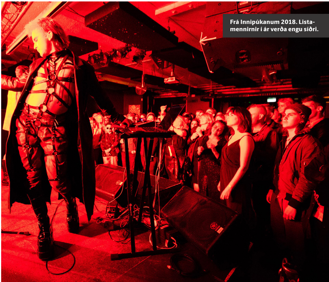
Frá Innipúkanum 2018. Listamennirnir í ár verða engu síðri.

Hann segir að Innipúkinn sé eina tónlistarhátíðin sem fari fram þessa verslunarmannahelgi. „Við viljum meina að útihátíðir séu ekki tónlistarhátíðir. Þannig að það er langskynsamlegast að vera í Reykjavík um helgina, fara á Inni-