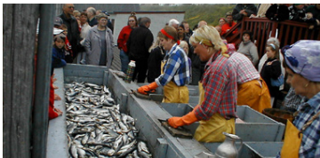
Það verður mikið fjör á Siglufirði um helgina á Síldarævintýrinu.