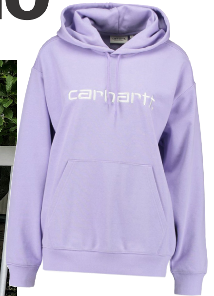
Fjólubláa hettupeysan sem er vinsæl um þessar mundir og hentar vel á Þjóðhátíð.