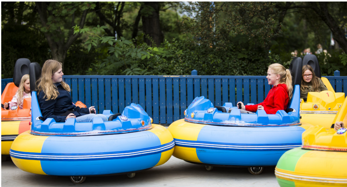
Nýir klessubílar voru teknir í gagnið um síðustu helgi.