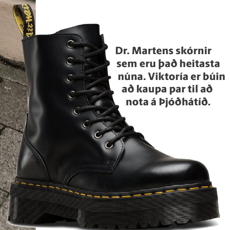
Dr. Martens skórnir sem eru það heitasta núna. Viktoría er búin að kaupa par til að nota á Þjóðhátíð.

Morgundagurinn verður betri með After Party Náttúruleg lausn við timburmönnum