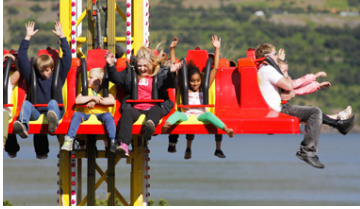
Það er alltaf mikið stuð á Akureyri um verslunarmannahelgina.