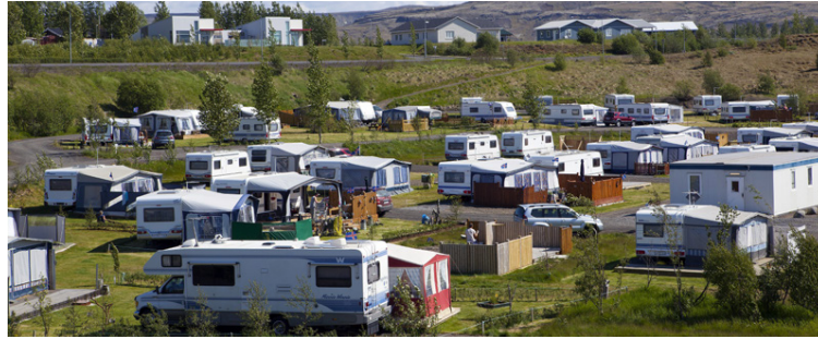
Það er ávallt margt um manninn á Flúðum um verslunarmannahelgina.

Bæjar- og fjölskylduhátíð verður á Flúðum um helgina. Hátíðin er haldin í fimmta sinn og margt skemmtilegt í boði fyrir alla fjölskylduna. Best er að hafa samband við Tjaldmiðstöðina á Flúðum til að tryggja sér aðstöðu. Tjaldsvæðið hefur verið stækkað. Það verður mikið um að vera á föstudagskvöldið því þá kemur hljómsveit Pálma Gunnarssonar og fer yfir feril Pálma í félagsheimilinu. Á eftir koma fram