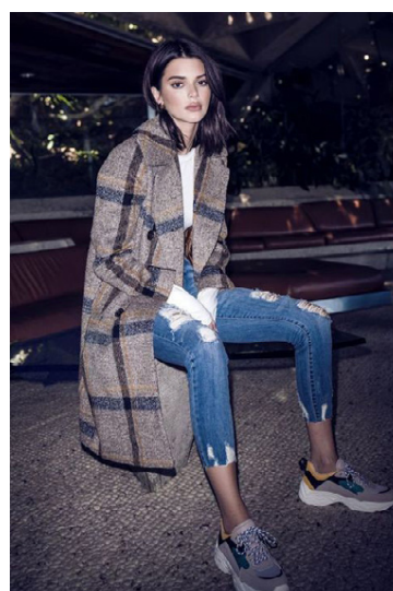
Haust 2019. Nú eru kápur að komast aftur í tísku á kostnað úlpanna.

augu. Svo er nauðsynlegt að hafa mittistösku til að geyma símann og fleira.“