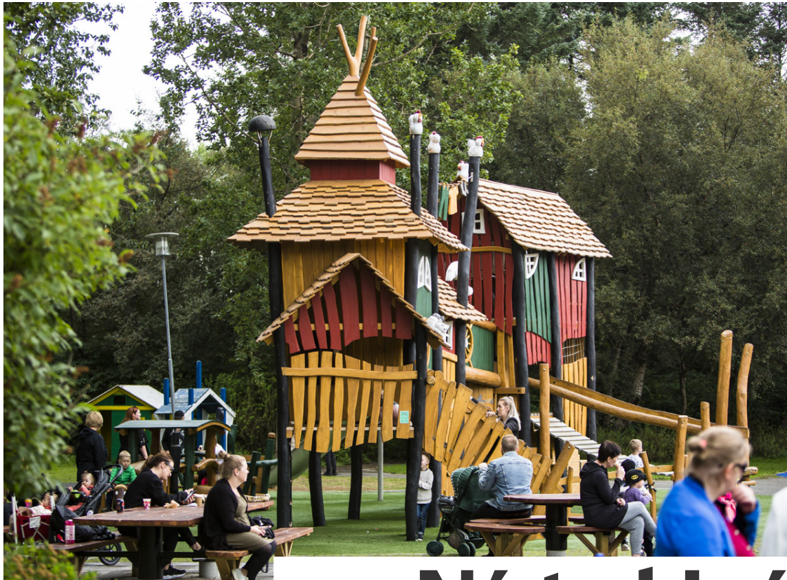
Unnið hefur verið að endurbótum á kastalavæðinu.

Við erum búin að bæta töluvert við nýjungarnar, það allra nýjasta eru klessubílar sem voru teknir í gagnið um helgina. Þeir eru stórskemmtilegir. Svo eru nýlegir bátar á tjörninni og við erum búin að endurgera kastalavæðið og svæðið í kringum grillin. Þetta er búið að taka tíma en það margborgar sig. Gardurinn er orðinn mjög flottur.