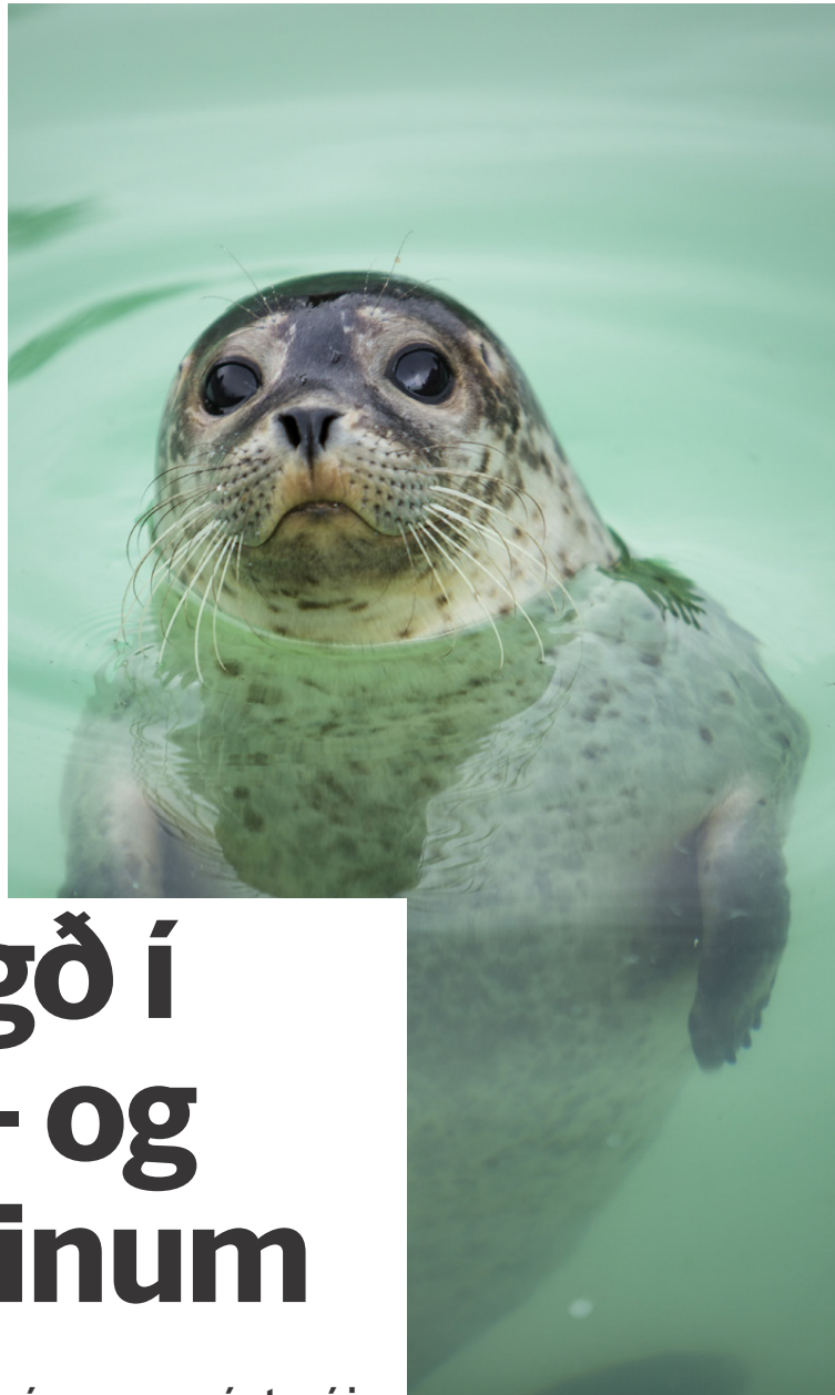
Það er auðvelt að gleyma sér hjá selunum.

Unnur. Í sumar komu tónlistarhópar Hins hússins og spiluðu á tónleikum í garðinum. „Þau komu hingað í þriggja og skemmtu gestum. Okkur finnst ungar og upprennandi hljómsveitir eiga heima í fjölskyldugarði, ef einhvers staðar.“ Unnur vonast til að Fjölskyldu- og húsdýragarðurinn haldi áfram að vera sýningarvettvangur fyrir ungt tónlistarfólk. „Vonandi verður framhald á þessu og að þetta sé komið til að vera.“