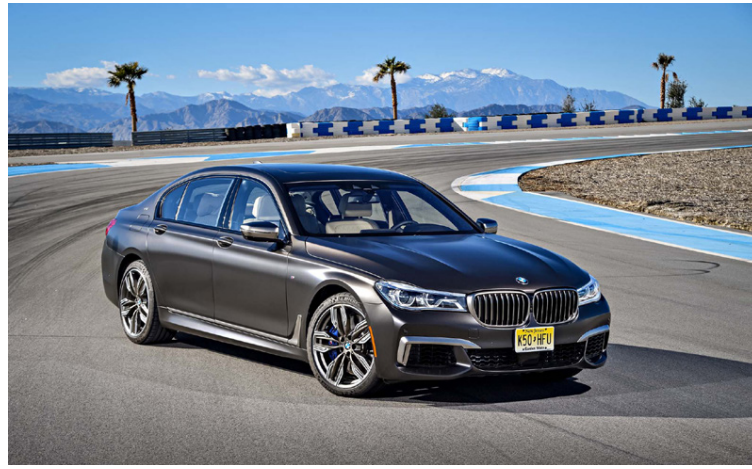
BMW 7-Series með hefðbundnu hjólhafi er ein bílgerðanna sem gætu horfið.

Ónefndir heimildarmenn innan raða BMW hafa látið hafa eftir sér að fækkun bílgerða sé yfirvofandi hjá fyrirtækinu. Yrði það gert til að spara kostnað í framleiðslu. Þær bílgerðir sem eru í mestri hættu á að verða fyrir niðurskurðarhnífnum eru þær sem hægst seljast, svo sem blæjurgerðin af 2-Series bílnum, 7-Series limósínan með hefðbundnu hjólhafi (ekki long-version), X2 jepplingurinn, coupe og convertible gerðirnar af 8-Series og hinn nýi BMW Z4. Það vekur reyndar mikla athygli að bíll sem kom út í fyrri skuli strax vera kominn á niðurskurðarlistann. Það vekur einnig furðu að X2 skuli vera á þessum