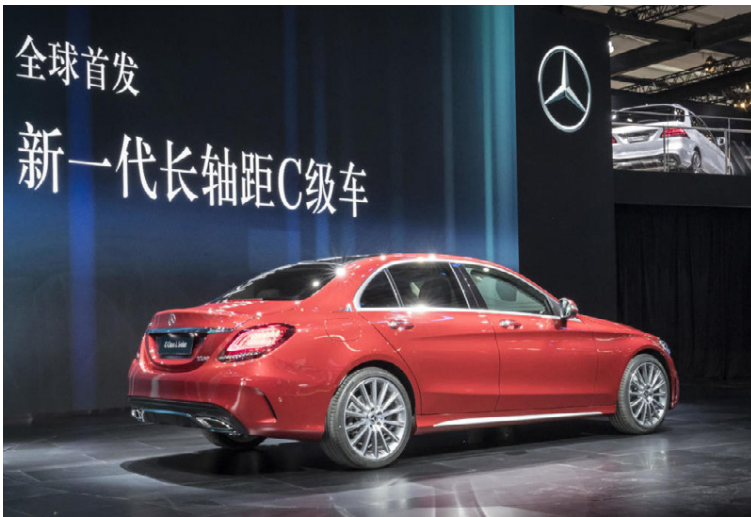
Mercedes-Benz-bíll á pöllunum í Kína.

Það vekur minni furðu að sjá blæjurgerðir bíla vera á útleið en sú þróun hefur verið í gangi í nokkurn tíma og sannast sagna eru þeir fáir eftir. Þó svo að 8-Series limósínan sé í hættu á það ekki við X8-jeppann sem nú er í þróun og það meðal annars í tengiltvinnutögu og sem X8 M sportkerra. BMW hefur þegar gefið upp að smíði tveggja dyra 1-Series bílsins verði hætt, sem og 2-Series Active Tourer fjölskyldubílsins, sem ef til vill er sá bíll sem lengst er frá þekktri hugmyndafræði BMW um sportlega akstursbíla.