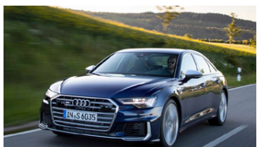
Minni vél en sama afl.

Hagnaðurinn á ársfjórðungnum nam 560 milljónum króna. Sala Volkswagen Group á 2. ársfjórðungi nam 2,75 milljónum bíla og minnkaði um 1,8% á milli ára, en þar sem bílamarkaðurinn í heild hefur skroppið meira saman en það hefur Volkswagen Group aukið við markaðshlutdeild sína. Porsche-merkið gekk best allra merkja innan VW Group og jókst sala Porsche-bíla um 9% á 2. ársfjórðungi.