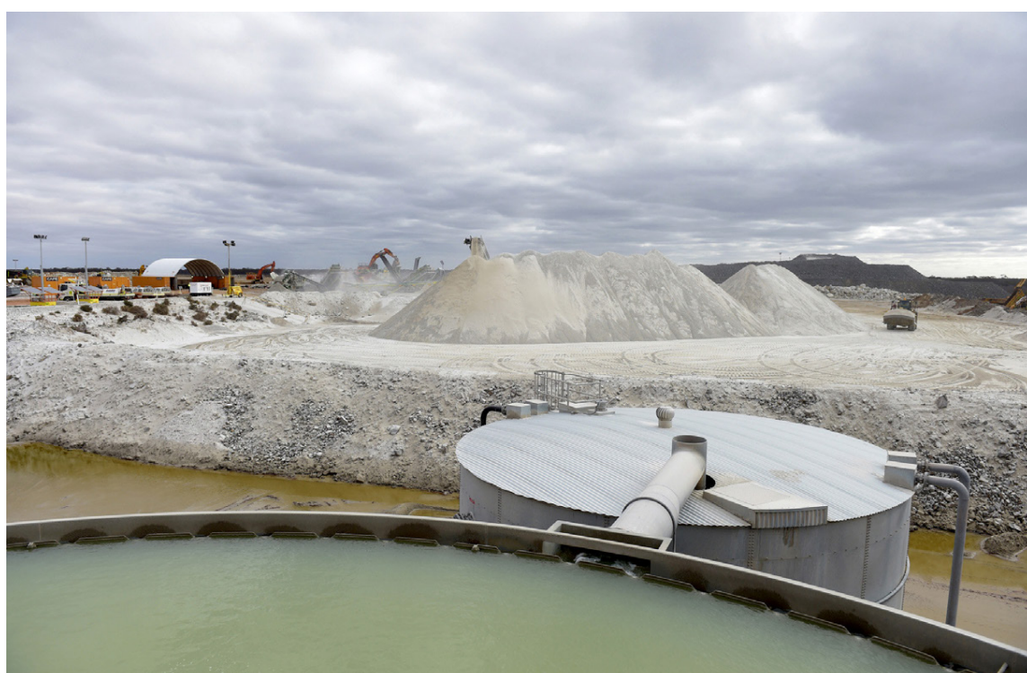
Frá einni af fjölmörgum litíumnámum heimsins, en þeim hefur fjölgað mjög á síðustu árum.

kWh rafhlöðum. Kaupendur geta valið á milli 322, 376, 429 og 600 hestafla útgáfna bílsins. Öflugasta útgáfan fær nafnið Taycan Turbo og mun kosta riflega 18 milljónir í Evrópu en ódýrasta gerðin verður væntanlega á riflega 10 milljónir króna. Með stærri gerðina af rafhlöðum verður drægið 515 km samkvæmt WLTP-staðli, hröðunin 3,2 sek. í 100 og 10 sek. í 200 og hámarkshraðinn 261 km/klst. Taycan bíllinn verður með loftpúðafjöðrun, en er ansi þungur á vigtinni með sínar stóru rafhlöður, eða 2,1 tonn.