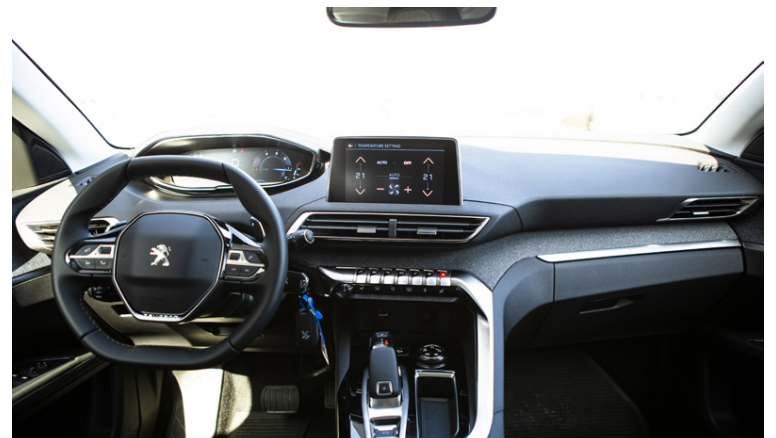
Virkilega huggulegt mælaborð og auðveld stjórn-tæki.

helst hægt að setja útá efnisvalið ef maður vill endilega væla smá, en það má ef til vill ekki gera meiri kröfur fyrir bíl sem ekki fellur í lúxusbílaflokk og kostar undir 5 milljónum króna. Líkindin með Peugeot 5008 og 3008 kristallast líka í sama vélarúrvali. Vélarar sem eru í boði eru 1,2 og 1,6 lítra bensínvélar og 130 og 180 hestafla 1,5 og 2,0 lítra dísilvélar. Fá má bílinn beinskiptan eða með 6 eða 8 gíra sjálfskiptingum, allt eftir vélargerð. Reynsluakstursbillinn var með 1,6 lítra dísilvélinni og 8 gíra sjálfskiptingum.