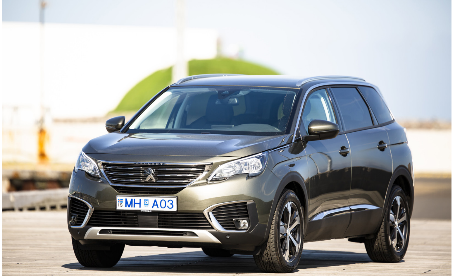
Peugeot 5008 er nú sannarlega fyrir augað, öndvert við forverann. Hér er stór bíll á ferð, enda með rými fyrir 7 manns.

Auðvelt er að læra á öll stjórn-tæki og skipulag gott. Það væri