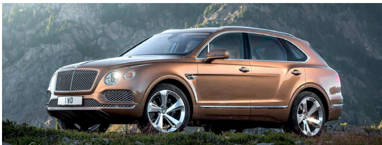
Bentley Bentayga hefur selst eins og heitar lummur frá tilkomu hans.

Þrátt fyrir mikla velgengni í sölu eina og fyrst jeppa breska lúxusbílaframleiðandans Bentley, þ.e. Bentayga, útilokar fyrirtækið í bráð smíði annarra jeppa- eða jeplingagerða. Þess í stað ætlar Bentley að leggja alla áherslu á rafmagnsvæðingu bílgerða sinna og munu þeir allir bjóðast sem tengiltvinnbílur. Á það við um bílgerðirnar Continental GT, Flying Spur og Mulsanne,