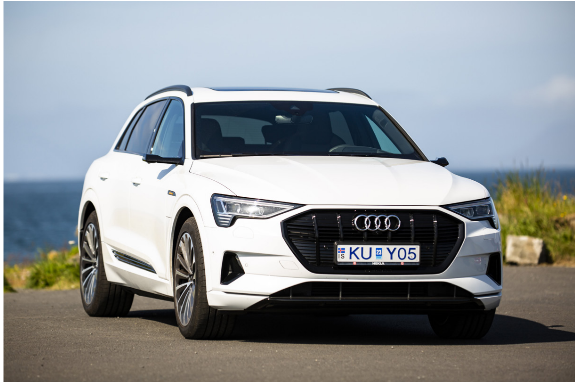
Audi e-tron 55 er friður á velli og slær við Audi Q7 jeppanum að mati greinarritara.

Lagt var að stað þaðan með hleðslu upp á um 200 km akstur. Það reyndist yfir hleðsla og þegar komið var í mark var ennþá 65 km hleðsla á bílnum og því hafði hann eytt nákvæmlega þeirri hleðslu sem vegalengdin milli Blönduóss og Akureyrar sagði til um, enda mótvindurinn enginn á þeirri leið. Því hafði billinn verið hlaðinn samtals um 465 km og hann átti 65 km eftir að lokum. Því munaði ansi litlu að með 400 km hleðslu hefði hann komist þessa 386 km leið. Við betri aðstæður, þ.e. ekki allan þennan mótvind, má því búast við því að hann kæmist þessa leið á einni hleðslu. Hræðsla þeirra sem aka rafmagnsbílum á lengri leiðum leyfir þó seint