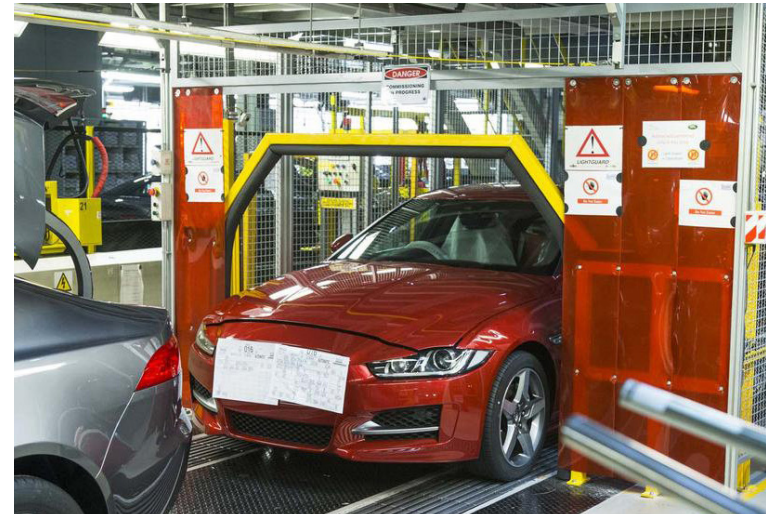
Frá verksmiðju Jaguar í Bretlandi.

Auto Analysis spáir því að ef Bretland gangi úr Evrópusambandinu án sannings muni bílaframleiðsla