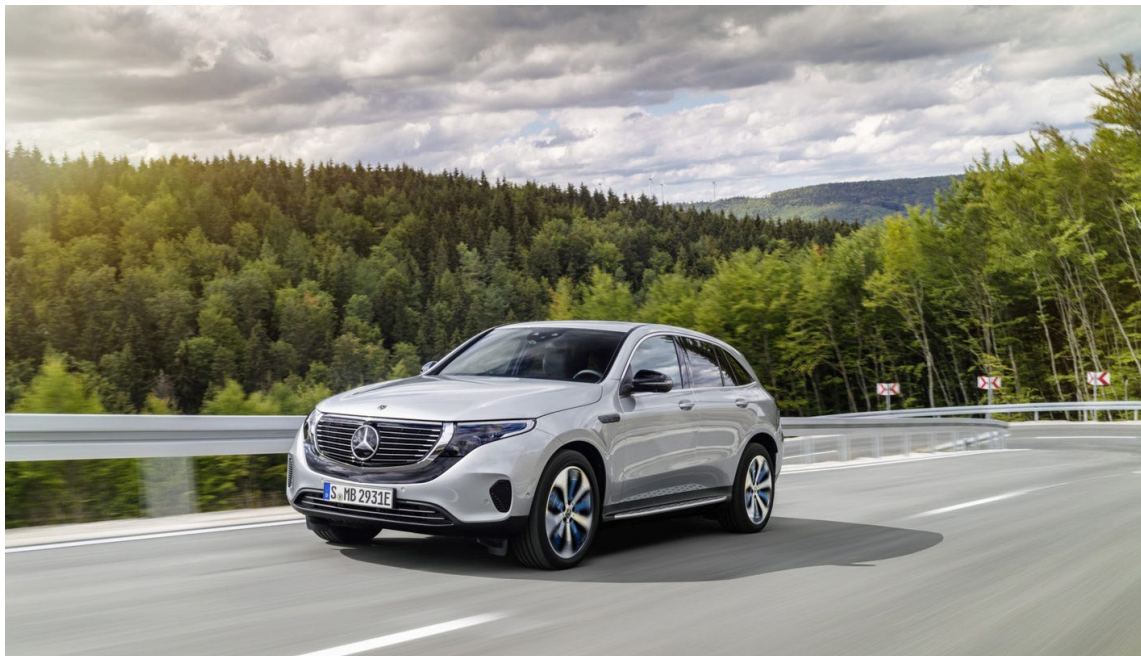
Mercedes Benz hefur á undanförunum árum haldið titlinum söluhæsta lúxusbílamerki heims og hirti hann af BMW.

Mercedes-Benz seldi alls 457.595 bíla í Evrópu á fyrstu sex mánuðum ársins. Mercedes-Benz setti sölumet í Frakklandi, á Spáni, í Póllandi, Kína og Vietnam á fyrri helmingi ársins. Mest seldu bílar Mercedes-Benz á þessu tímabili voru A-Class á heimsvísu og B-Class og nýr CLA í Evrópu. Mikil spennan og eftirvænting ríkir vegna komu rafbílsins EQC en hann verður kynntur á Íslandi nú í september. Ísland er meðal fyrstu markaðssvæða heims sem kynnir þennan hreina rafknúna sportjeppa sem verður með drægiallt að 417 km miðað við nýja WLTP-staðalinn og hröðunin úr kyrrstöðu í hundradíð er aðeins 5,1 sekúnda.