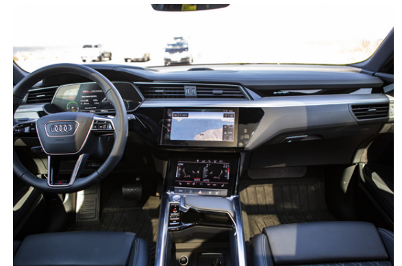
Allt fullt af skjáum í bílnum og sá sem mest kemur á óvart leysir af hliðarspeglana, en í stað þeirra er myndavél.

að taka neina sénsa, því ekki er gaman að vera á rafmagnslausum bíl á þjóðvegnum og ekki hægt að bera rafmagn í brúsum til að tappa á.