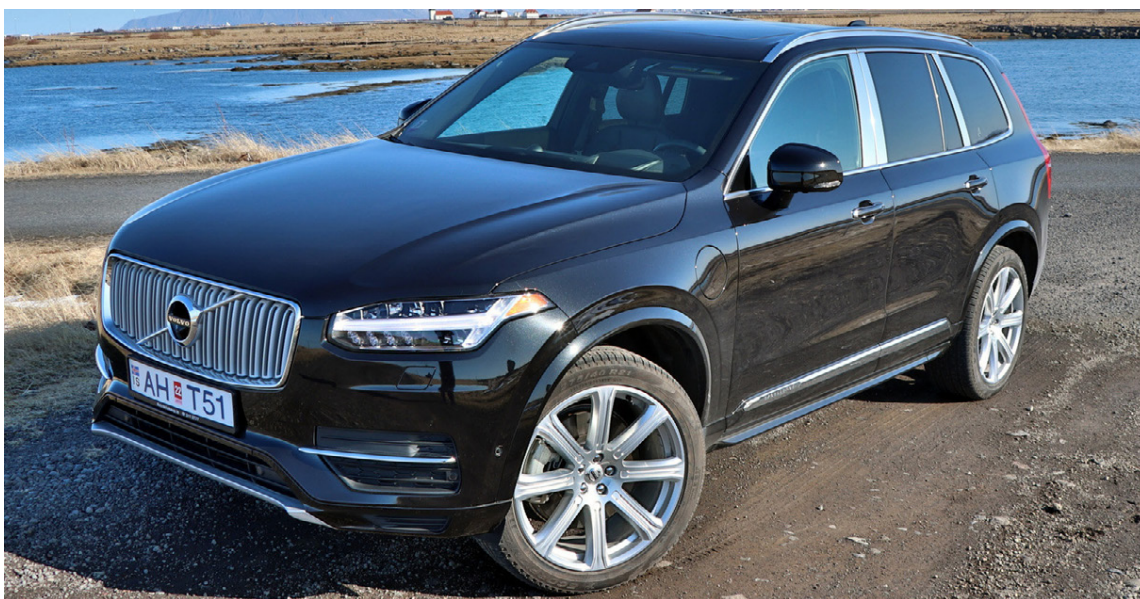
Stærð XC90-jeppans sem fyrst kom á markað árið 2002 var í raun takmörkuð af Ford, sem þá átti Volvo.