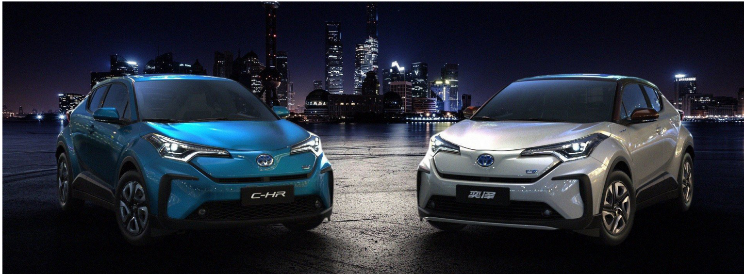
Strax á næsta ári mun fyrsti hreinræktaði rafmagnsbíll Toyota koma á markað í Kína og síðan mun þeim fjölga stórlega.

Toyota ætlar ekki að missa af lestinni hvað framboð á rafmagnsbílum varðar í framtíðinni og hefur bundist samkomulagi við kínverska bílaframleiðandann BYD um þróun og smíði rafmagnsbíla, ekki síst fyrir stærsta bílmarkað heims í Kína. Bæði verður um fólksbíla og jepplinga að ræða sem ganga munu fyrir rafmagn, en bílarnir munu bera nafn Toyota á húddinu. Toyota hefur einnig