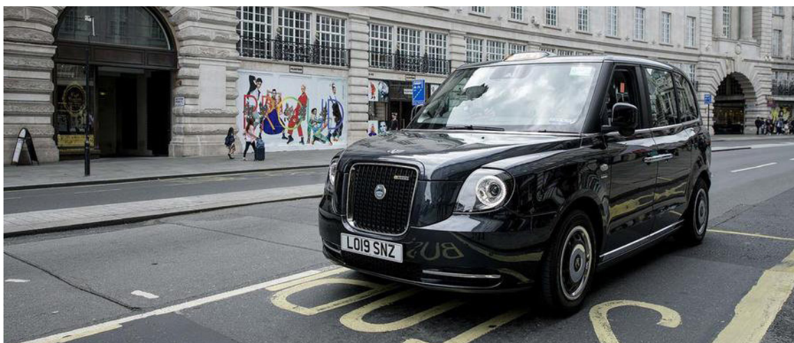
Rafmagnsleigubílar London Electric Vehicle Company eru nú að leysa af hólmi mengandi dísilháka.

Verksmiðja LEVC, sem er í eigu kínverska bílaframleiðandans Geely frá árinu 2013, hefur framleiðslugetu upp á 36.000 bíla á ári og þar vinna nú um 1.000 manns.