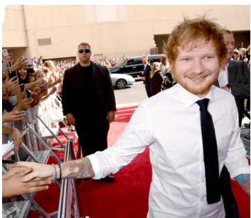
Ed Sheeran heilsar aðdáendum sínum.