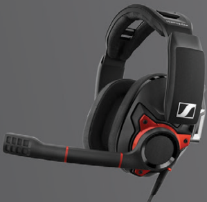
Sennheiser GSP600 SEPCGSP600