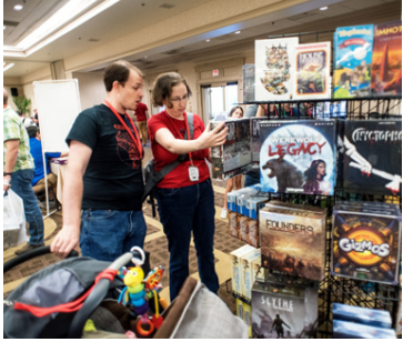
Azmodee hefur keypt upp fjölmargar útgáfur á undanförunum árum.