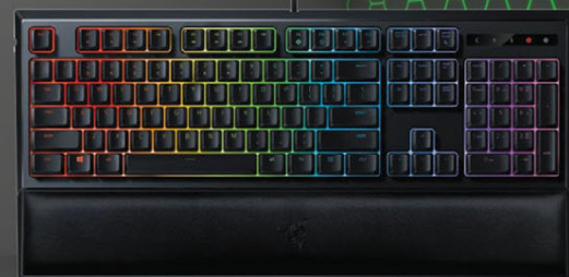
Razer Ornata Chroma RAZORNATACHOM