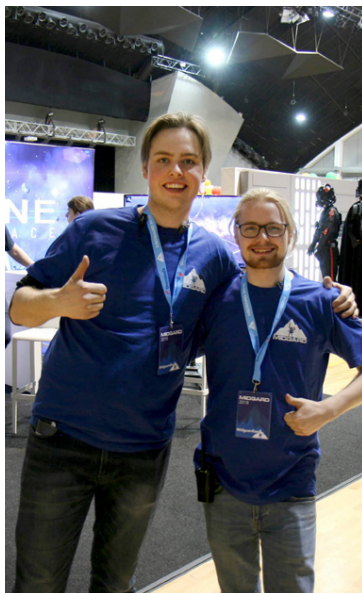
Sjálfbóðaliðar vinna mikið verk.