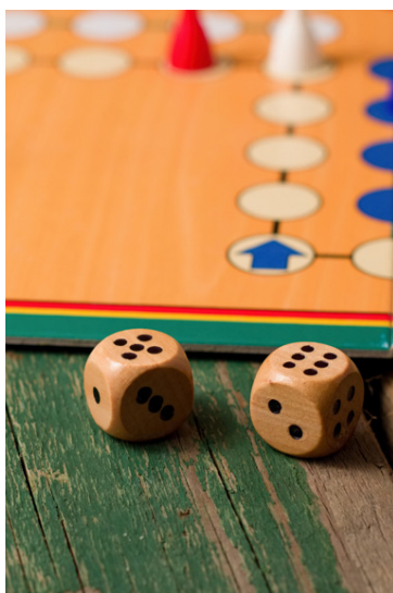
Borðspil verða í boði fyrir börn.