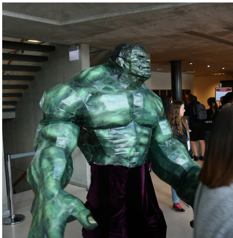
Þátttakendur í fyrra lögðu mikinn metnað í búningana.

LEIKJAVÖRUR FRÁ ÞEKKTUSTU VÖRUMERKJUNUM Í BRANSANUM