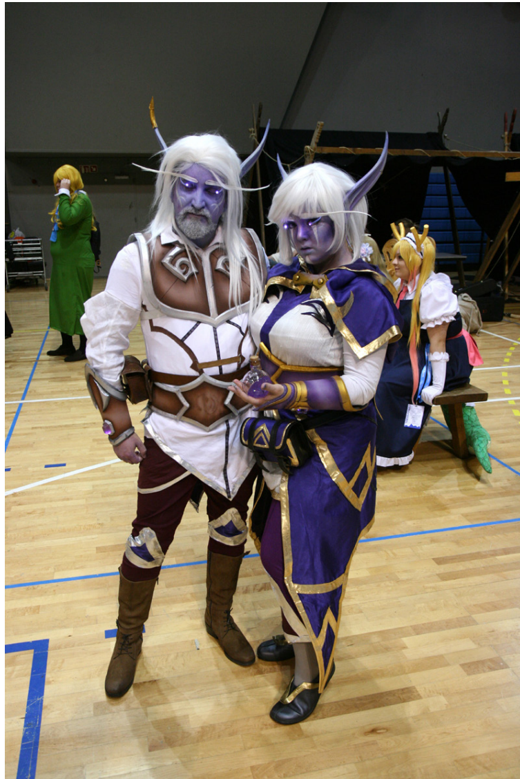
Það mátti sjá ýmsar verur í búningakeppninni í fyrra.

Það er hægt að skrá sig í keppnina fram að miðnætti á föstudag inni á midgardreykjavík.is.