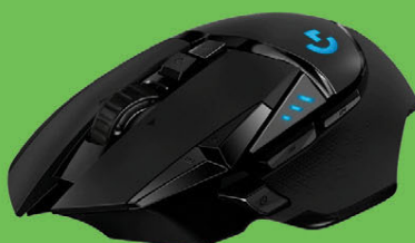
Logitech G502 Lightspeed 31579