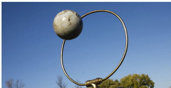
Hægt verður að fræðast um quidditch.

Þá verða einnig pallborðsumræður um framtíð stafrænna miðla og nýja nálgun á stafrænni efnissköpun sem kallast M-Media. Rætt verður hvernig hægt er að tengja notendur með tilfinningum frekar en að treysta einungis á tæknina.