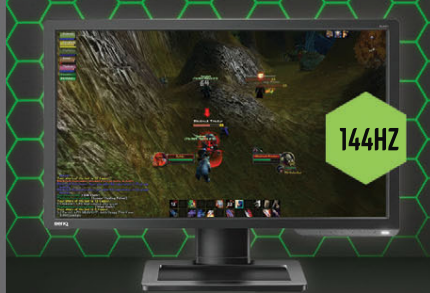
BenQ Zowie 24" skjár BQXL2411P