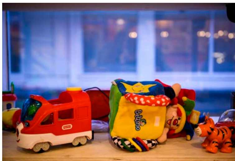
Það þykir göfugt og flott að kaupa notaðar gjafir.