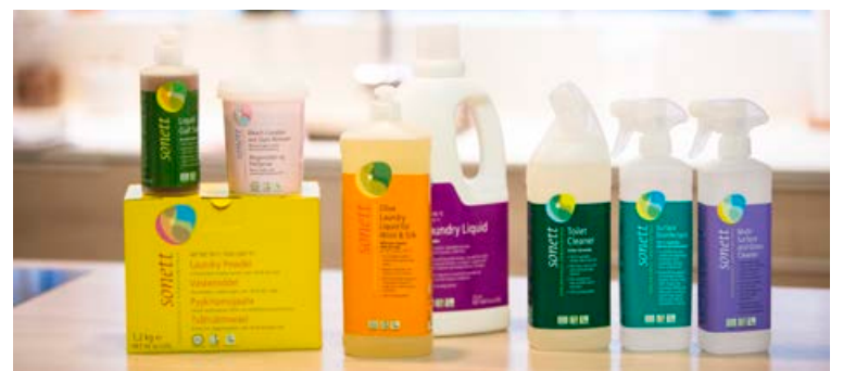
Vörulína Sonett uppfullir allar þarfir heimilisins þegar kemur að þrifum.

Þótt jólahreingerning standi fyrir dyrum í aðdraganda adventu og jóla segist Ebba vera steinhætt að nenna að þrifa allt heimilið í einu.