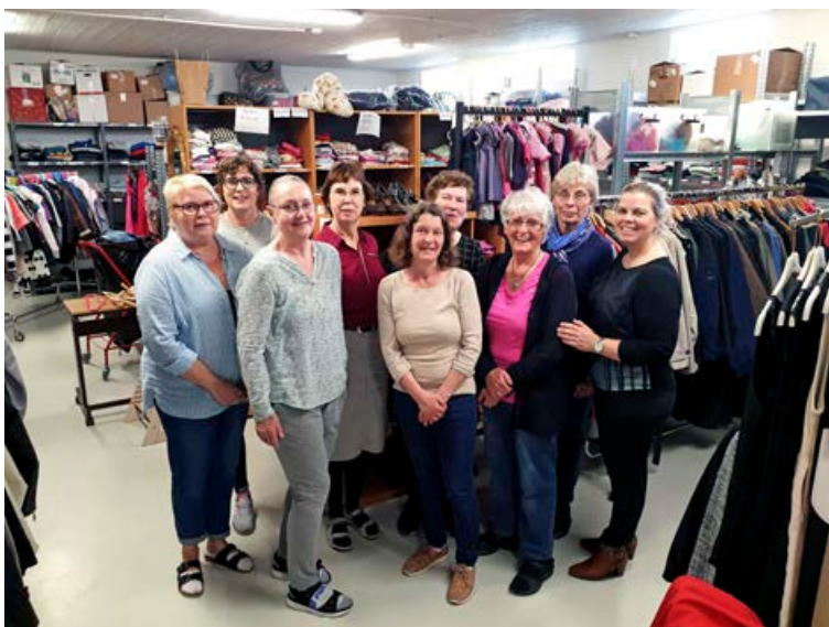
Hluti sjálfbóðaliða sem vinna óeigingjarnt starf í viku hverri.

“Fólkið sem fær gjafabréfin að gjöf fær tækifæri til að hjálpa náunga sínum til sjálfs-hjálpar og það er dýrmæt gjöf.”