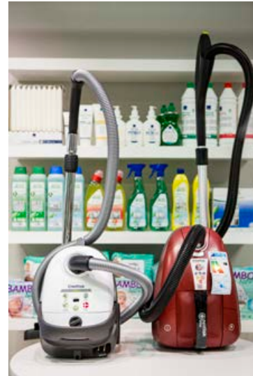
Hjá Rekstrarlandi er gott úrval af umhverfisvænum vörum fyrir jólin.

Evrópublómíð er notað í allri Evrópu en Umhverfisstofnun hefur umsjón með blóminu á Íslandi. „Til þess að uppfylla kröfur blómsins