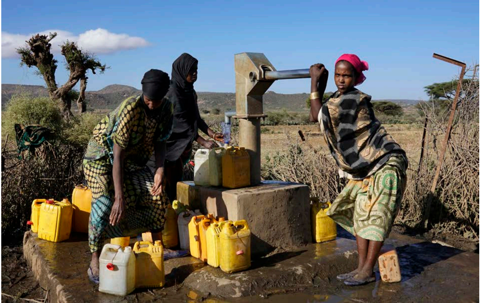
Stærsta verkefni Hjálparstarfs kirkjunnar er í þróunarsamvinnu í Eþíópíu þar sem áhersla er lögð á að tryggja aðgengi að vatni.

Í Sómalífylki í Eþíópíu búa milljónir íbúa við fæðuskort af völdum þurrka og aukinnar óreglu í veðurkerfum sem er rakin til loftslagsbreytinga. Þegar lítið sem ekkert rignir á regntímanum verður uppskeran rýr og fátæktin þar af leiðandi enn sárari. Stór þáttur í aðstoð Hjálparstarfsins á svæðinu er því að tryggja fólkinu aðgang að vatni. Bændur á svæðinu fá aðstoð til að efla jarðyrkju og búfjárrækt