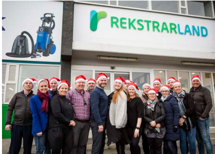
Starfsfólk Rekstrarlands tekur vel á móti þér og aðstoðar þig við að verða grænni og vænni. Starfsfólkið er þegar komið í jólaskap.

„Til að vara fái merki Svansins þarf hún að vera betri fyrir umhverfið og heilsuna en mis-