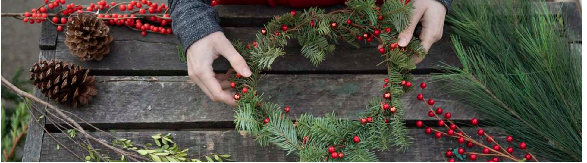
Þeir sem hafa öðruvísi jólatré geta fengið grenilykt í húsið með grenikrans.