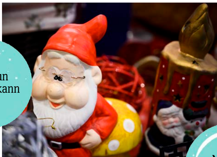
Notað jólaskraut er ekkert síðra en nýtt.

skápana af dýrindis kræsingum. Gott ráð til að koma í veg fyrir matarsóun er að skipuleggja innkaupin, gera innkaupalista og taka stöðuna heima áður en haldið er út í búð.