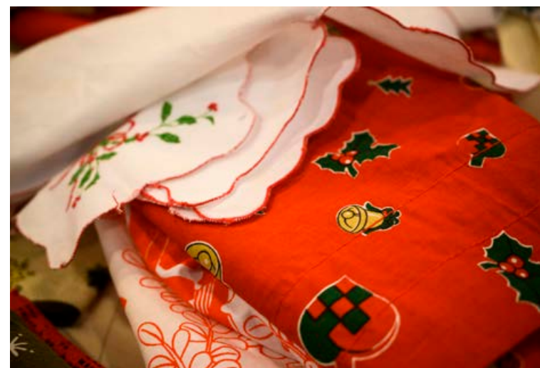
Kaupa má notaðan jólavarning á nytjamörkuðum.

Matarsóun er líka sóun á fjármunum, og því er gott að hafa í huga að Best fyrir dagsetningin er ekki heilög og því ættu allir að til-