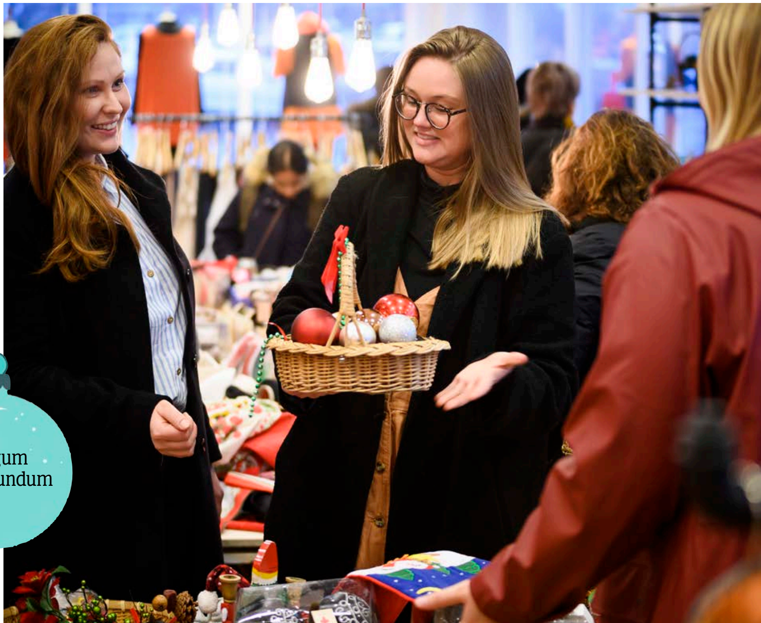
Í nytjamörkuðum er hægt að kaupa notaðar jólagjafir og jólaföt sem gleðja.