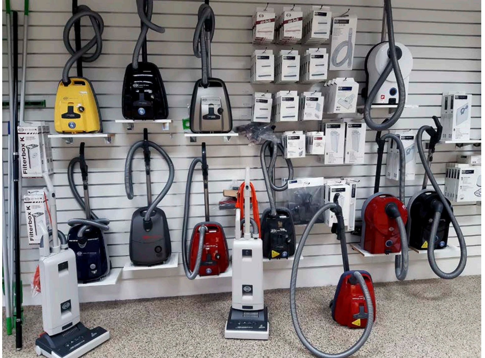
Þýsku Sebo-ryksugurnar þykja einstaklega vandaðar og fást í mörgum útgáfum, þar á meðal með hefðbundnu lagi en líka uppréttar með skafti.