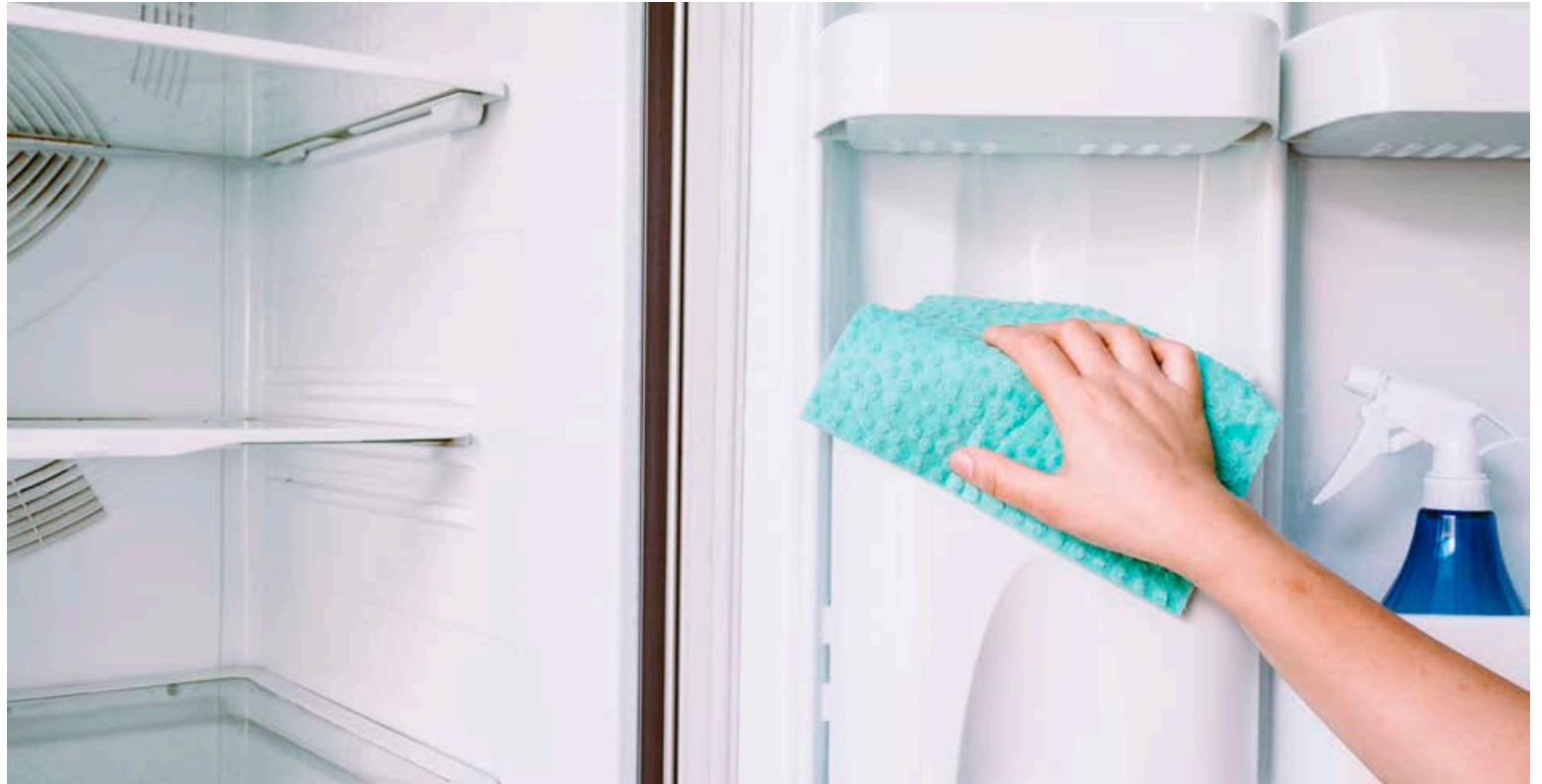
Gott er að þrifa ísskápinn með matarsóða svo það komi ekki sápolykt í matinn.

Leiðbeiningastöð heimilanna mælir með því að fólki kaupir svansvottuð hreingerningarefni. Svansvottunin er norrænt umhverfismerki sem gerir strangar kröfur um lágmörkun umhverfisáhrifa. Merkið er auðveldlega hægt að sjá á umbúðunum. „Mild sápa og vatn er best