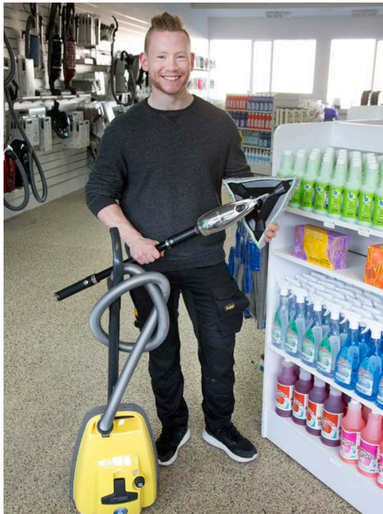
Hallgrímur með gluggaþvottagræjuna Stingray frá Unger; sem þvær glugga að innan og nær einstaklega vel í öll horn á gluggum.

bónvörum frá Pioneer Eclipse, þar á meðal grænu, umhverfisvænu línuna EnviroStar sem Valþór segir að standi sig frábælega.