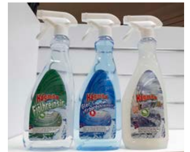
Hágæða er framleiðsla frá Marpól.

„Gölfþvottavélar spara mörg handtök og árangurinn er svo miklu betri en með moppuþrifum. Þegar salt og snjór er úti og óhreinindi berast inn skiptir öllu máli að skúra með gölfþvottavél sem