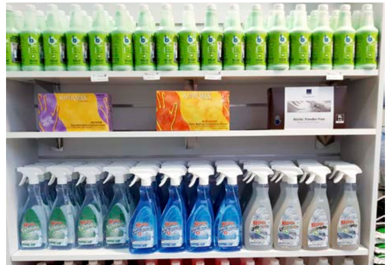
Hreinsiefnin BioClean og Hágæða eru fræg fyrir einstakan árangur og gæði.

Marpól er með umboð fyrir þýsku hágæðaryksugurnar frá Sebo. „Sebo-ryksugurnar eru fram-