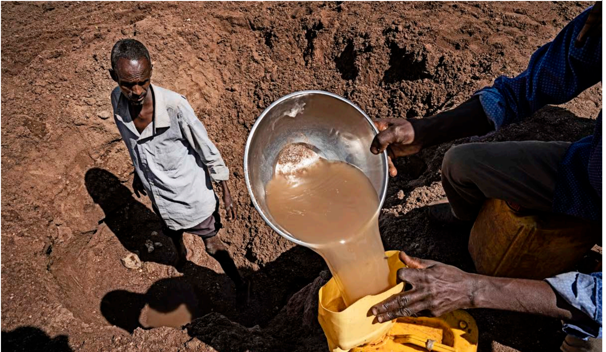
Í Kebri Beyah í Eþíópíu þarf fólk um langan veg eftir drykkjarhæfu vatni. Vatnsskorturinn viðheldur sárafatækt á svæðinu. Hjálparstarf kirkjunnar vinnur að því að bæta aðgengi að drykkjarhæfu vatni, að fólkið geti tryggt fæðuöryggi sitt með umhverfisvernd og bættum aðferðum í landbúnaði og að styrkja stöðu kvenna, samfélaginu öllu til farsældar.