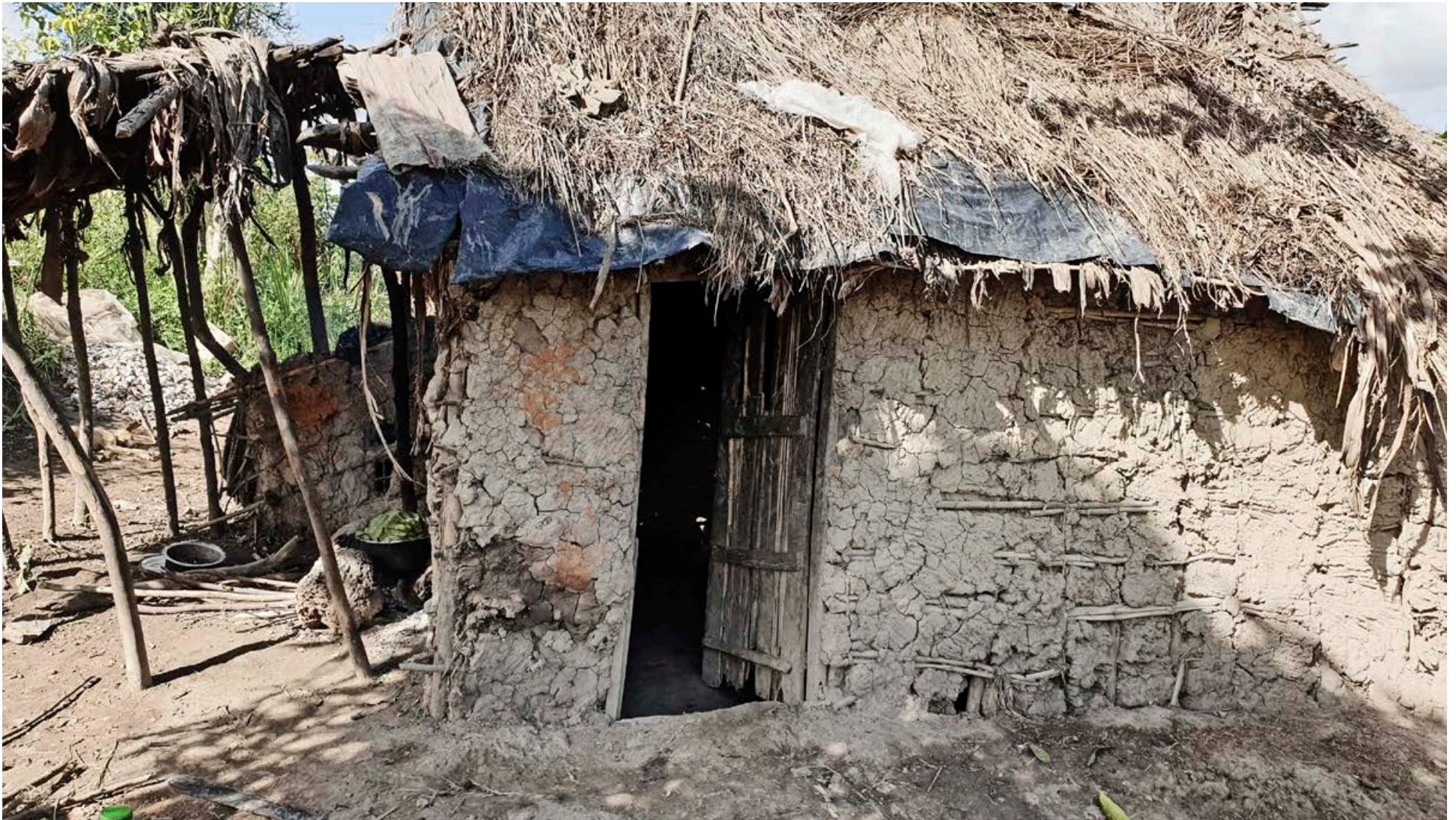
Börnin sem Hjálparstarf kirkjunnar aðstoðar í sveitahéruðum í Úganda búa við örbirgð af völdum alnæmis. Foreldrarnir eru látnir úr sjúkdómnum eða mjög veikburða og geta ekki séð börnum sínum farborða. Fjölskyldurnar búa í hreysum og hafa hvorki nægan aðgang að vatni né hreinlætisaðstöðu.