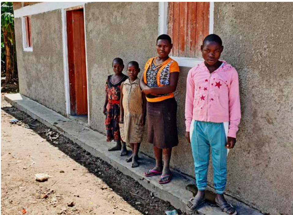
Móðir barnanna á myndinni, sem eru 10, 12, 15 og 18 ára gömul, lést af völdum alnæmis í maí síðastliðnum og eru þau nú munaðarlaus. Þau njóta aðstoðar Hjálparstarfs kirkjunnar en auk múrsteinshúss, kamars og vatnstanks hafa þau fengið geitur til að tryggja fæðuöryggi sitt með ræktun þeirra. Börnin fá rúm, dýnur, moskitónet og eldhúshöld með húsinu. Þau fá fræðslu um mikilvægi hreinlætis til að koma í veg fyrir sjúkdóma og njóta salræns stuðnings starfsfólks RACOBAA.