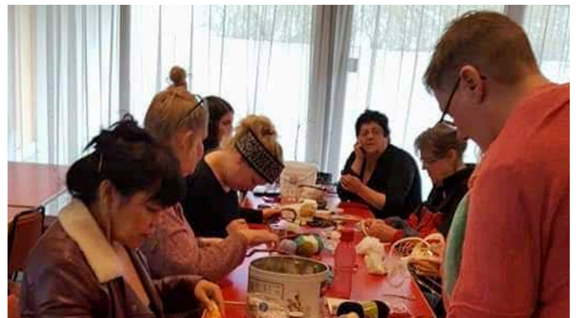
Markmið Hjálparstarfs kirkjunnar er að aðstoða fólk við að finna styrk sinn og getu til að takast á við erfiðar aðstæður og til þess að komast út úr félagslegri einangrun sem oft er fylgifiskur efnaleysis.