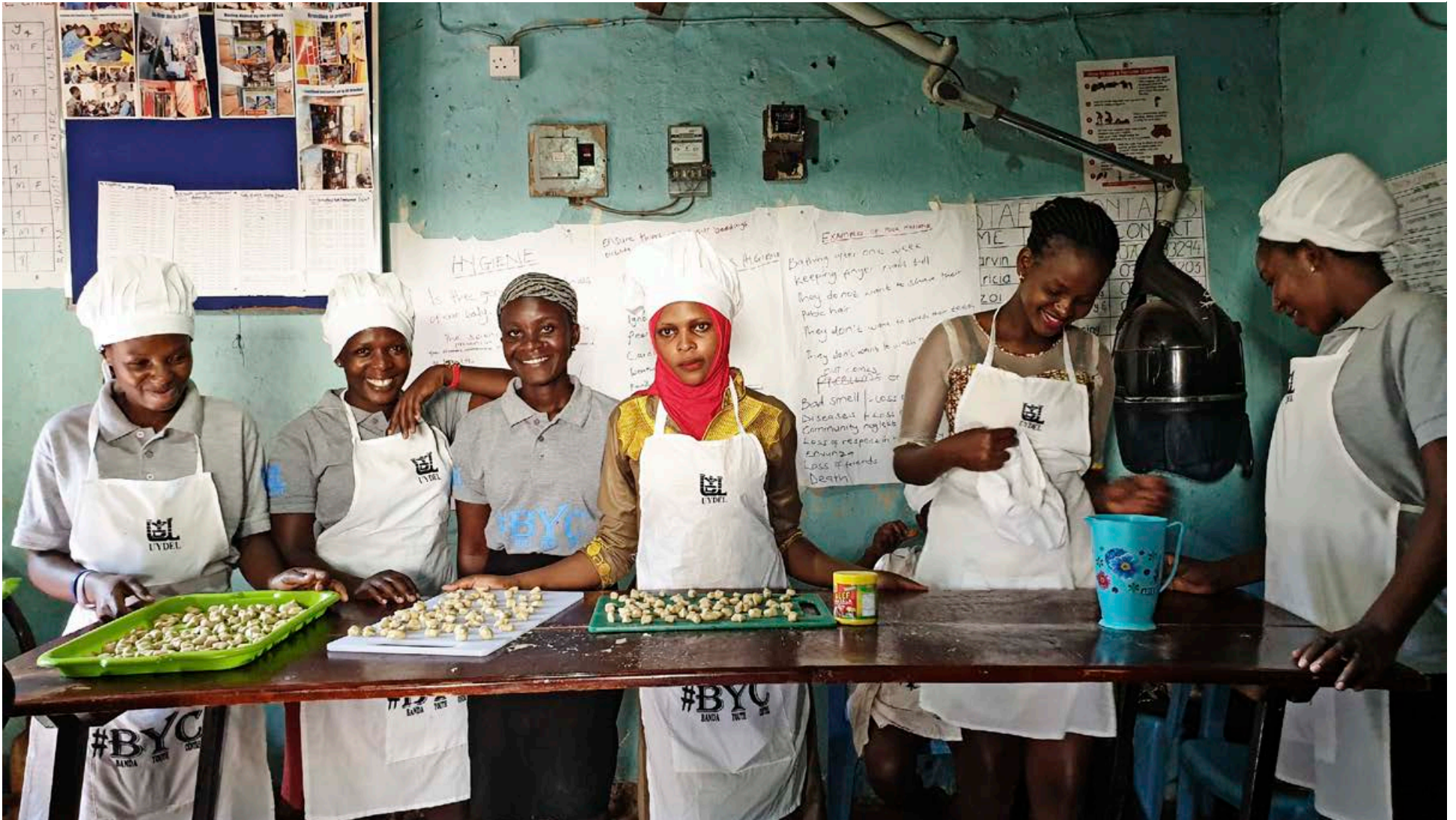
Í smiðjum UYDEL, sem Hjálparstarf kirkjunnar fjármagnar, læra unglingarnir iðn svo þau geti séð sér farborða á sómasamlegan hátt. Stúlkurnar á myndinni eru að læra að búa til ástarpunga í smiðju UYDEL í Bandahverfi í Kampala. Félagráðgjafar vinna að því að koma stúlkunum á starfsmemasamning í iðn sem þær velja að sérhæfa sig í að námi loknu.