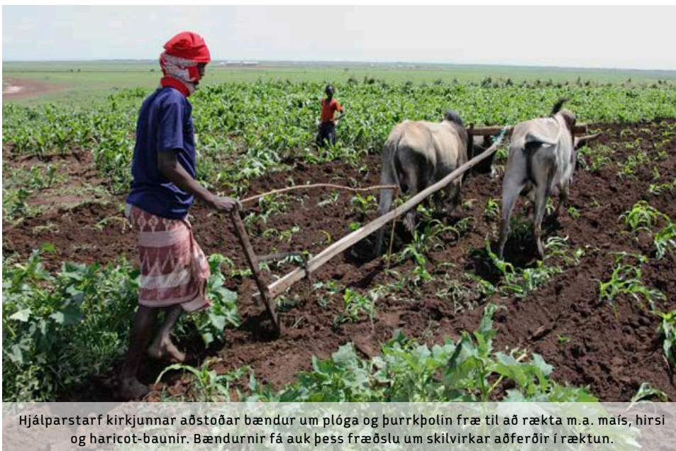
Hjálparstarf kirkjunnar aðstoðar bændur um plóga og þurrkþolin frá til að rækta m.a. maís, hirsí og haricot-baunir. Bændurnir fá auk þess fræðslu um skilvirkar aðferðir í ræktun.