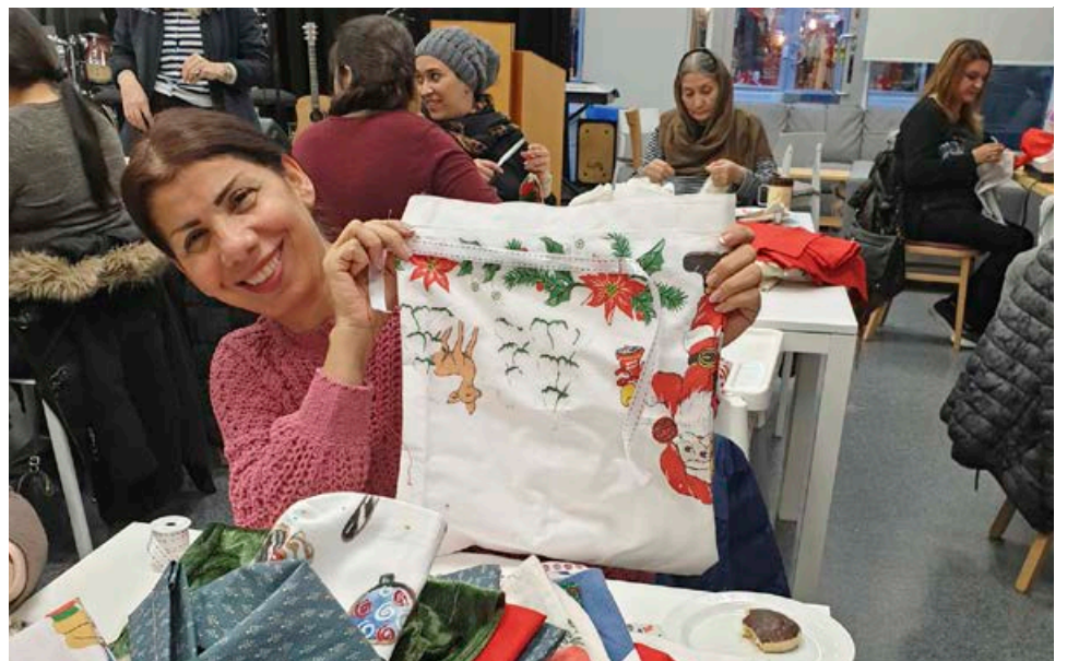
Verkefnið „Taupokar með tilgang“ hefur heldur betur undið upp á sig. Fyrst mættu fimm konur til að njóta samverunnar og gera gagn um leið en nú eru þær orðnar 55 og komast ekki fleiri að sem stendur. Konurnar sauma nú meðal annars jólagjafapoka úr endurnýttu efni sem má nota aftur og aftur.