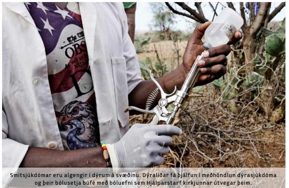
Smitsjúkdómar eru algengir í dýrum á svæðinu. Dýraliðar fá þjálfun í meðhöndlun dýrasjúkdóma og þeir bólusetja búfé með bóluefni sem Hjálparstarf kirkjunnar útvegar þeim.