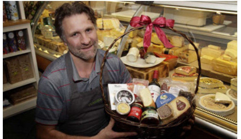
Jói í Ostabúðinni með eina girnilega sælkerakörfu.