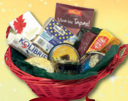
Karfa nr. 3

Camembert Royal, Coeur de Lion - franskur Brie, Jóla gráðaostur, Castello svartur, Trio Espanol hráskinka, bláberjasulta, Carr's kex, belgískt gæðasúkkulaði, karfa og skreyting kr. 4.900