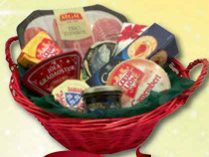
Karfa nr. 2

Castello ananas-ostur, Jóla Yrja, Jóla gráðaostur, Serrano hráskinka, hindberjasulta, belgískt gæðasúkkulaði, Carr's kex, karfa og skreyting kr. 3.900