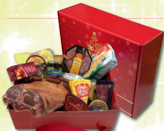
Kassi nr. 1

Castello ananasostur, Castello hvítur, Coeur de Lion - franskur brie, Castello Blue, Kolibrie geitaostur, Serrano hráskinka, bláberjasulta, Mini toasts, Snillingur, belgískt gæðasúkkulaði, karfa og skreyting kr. 7.890