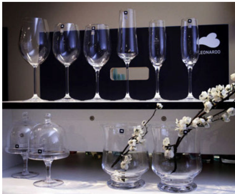
Í versluninni er mikið úrval af alls kyns glervöru sem er vinsæl í jólapakkann.

eru að leita að gjöfum með notagildi en aðrir vilja gefa skrautmuni. Hvort heldur sem er erum við uppfull af hugmyndum fyrir þá sem þurfa aðstoð og getum útbúið pakkana frá a-ö eftir óskum