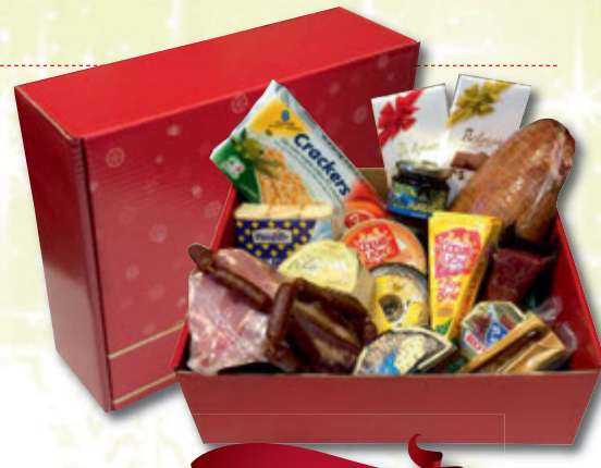
Kassi nr. 2

Dalahringur, bláberjasulta, Urta Svartkex (Black Lava), Jóla gráðaostur, Jóla Yrja, Höfðingi blár, Camembert, Villisveppaostur, Kastali hvítur, karfa og skreyting kr. 6.800