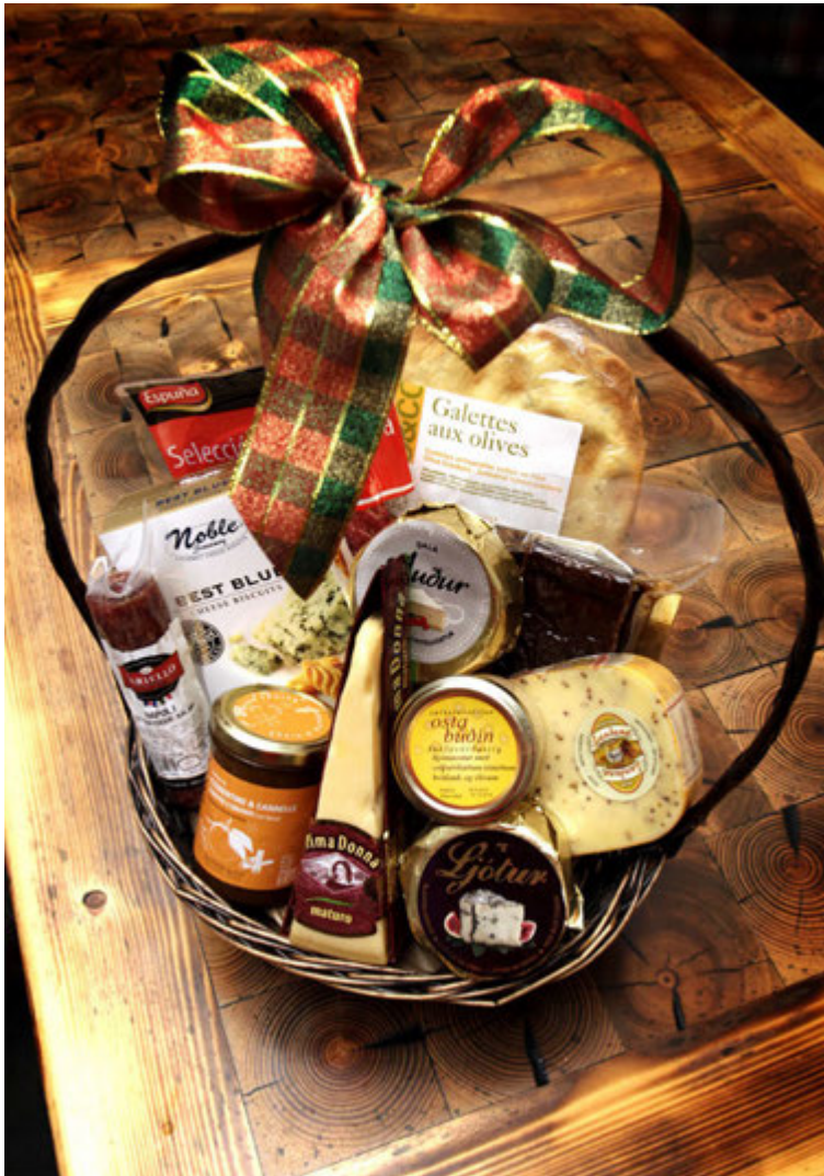
Hátiðarkarfa sem gleður hinn sanna sækera.

Algengustu körfurnar kosta á bilinu 10.-20.000 krónur en þær stærstu fara gjarnan í talsvert hærri upphæðir. „Þessar sælkerakörfur eru