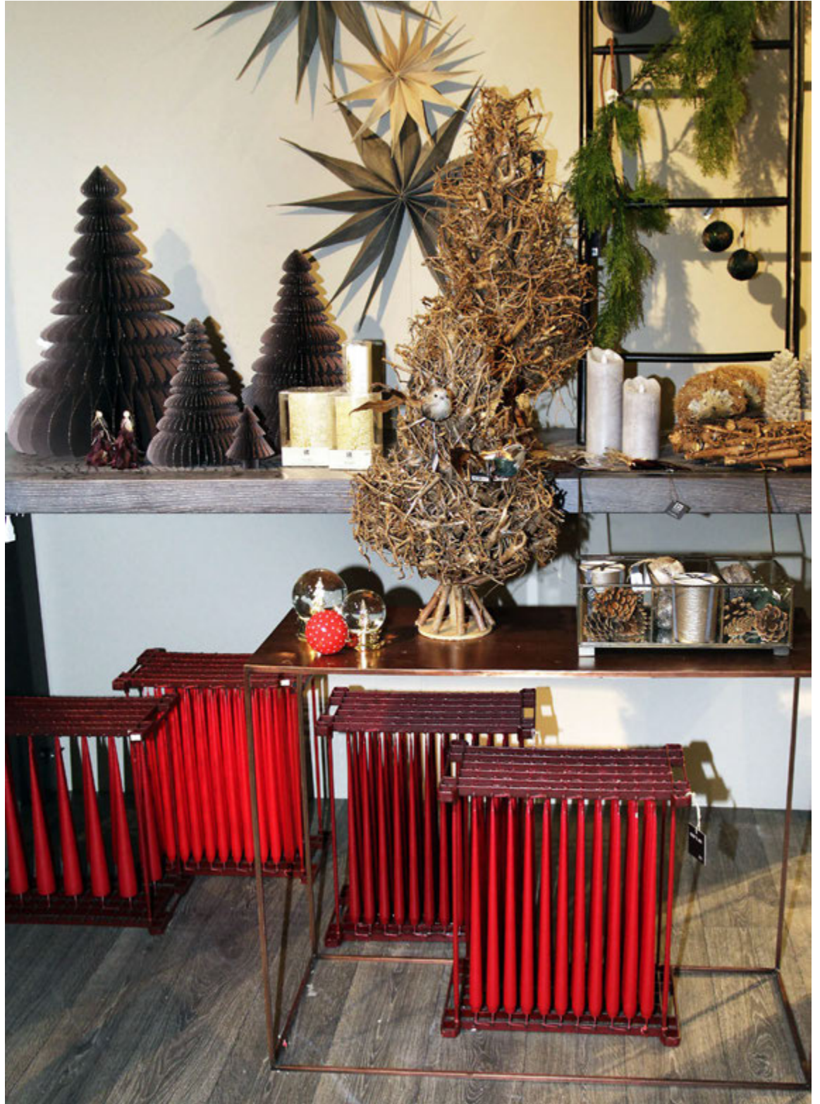
Hvers kyns jólavara fæst í úrvali.