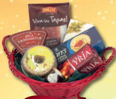
Karfa nr. 1

GERÐU VEL VIÐ STARFSFÓLK OG VIÐSKIPTAVINI Láttu okkur sjá um fyrirtækjagjafirnar - einfalt og þægilegt