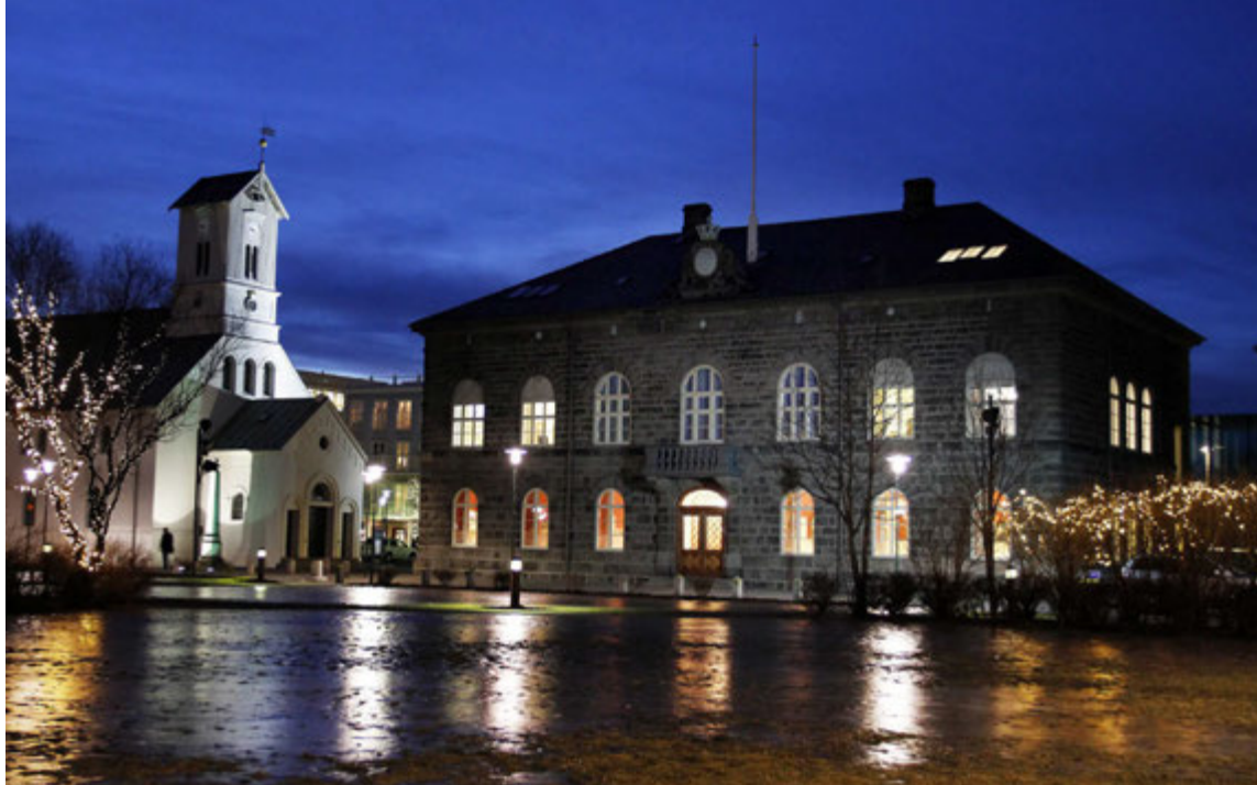
Vikurnar fyrir jól eru oftast mikill annatími fyrir þingmenn en þrátt fyrir það ríkir yfirleitt góður jólaandi innanhúss.

Andinn utan þingsalarins breyttist einnig mikið að sögn Sturlu og var þess gætt í þinghúsinu að helgi jólanna birtist með skrauti og nota-