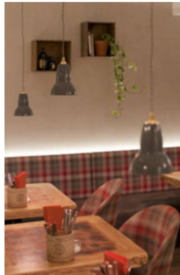
Huggulegheitin eru allsráðandi á veitingastað Ostabúðarinnar.

mjög heppilegar gjafir því að fólk á meira og minna allt heima hjá sér í dag. Því er svo sniðugt að gefa sælkeramat fyrir jólin sem hægt er að njóta á adventunni og fram yfir áramót.“