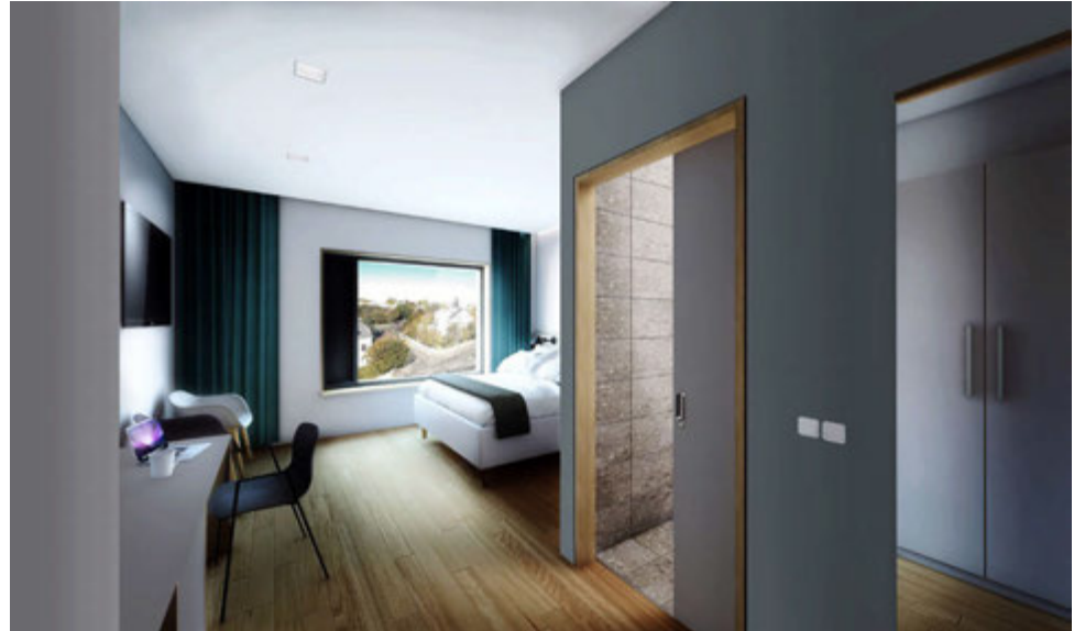
Við hönnunina verða tryggð hótélherbergi með góðri dagsbirtu og er stærð og staðsetning glugga þannig háttáð að allir njóti góðrar dagsbirtu og útsýnis hvort sem er úr rúmi eða stólum innan herbergja. Setustofur er staðsettar þannig að sólar og skjóls njóti.