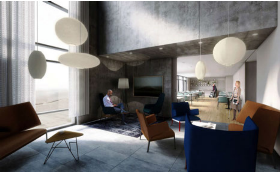
Efnisval innandyra tekur mið af starfsemi og þeirri staðreynd að dvalartími hótélgesta verður lengri en almennt gerist á hótélum. Reynt er að koma til móts við fjölbreyttar þarfir þeirra sem hótelið nota.