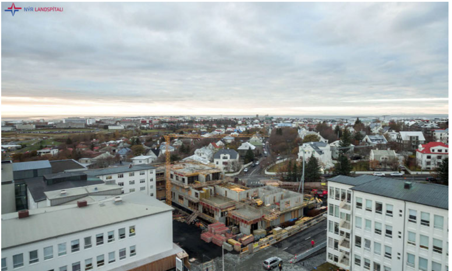
Stefnt er að því að byggingaframkvæmdum við nýjan spítala ljúki í árslok 2023. Hér er mynd af framkvæmdum við sjúkrahótel sem nú eru í fullum gangi.

Ráðherra segir að ef horfið verði frá núverandi verkáætlun og gera ætti ráð fyrir framtíðaruppbyggingu Landspítala annars staðar þyrfti að taka tillit til þess að skipulagsferli og útfærslu byggðar þurfi ávallt að