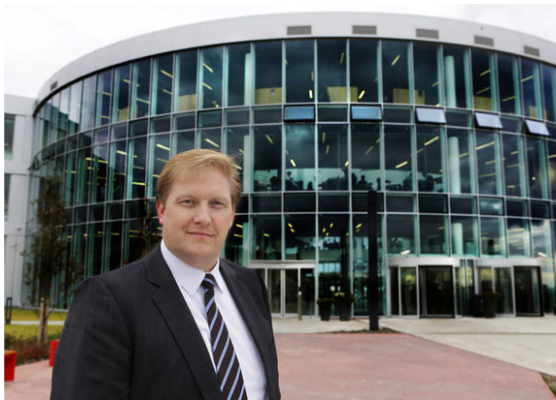
Landspítalinn og Háskólinn í Reykjavík reka saman sérstaka rannsóknarstofu til að vinna að þróun nýrrar tækni og samnýta sérfræðinga á báðum stöðum í þeim verkefnum.