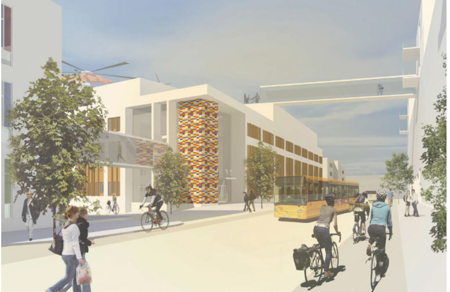
Rannsóknarhúsið er hluti af fyrsta áfanga uppbyggingar Nýs Landspítala og verður á fjórum hæðum, auk kjallara.

Starfsmenn deildanna veita einnig sérfræðiálit og stuðningsþjónustu við aðrar sérgreinar, utan og innan stofnunar. „Sumar þessara deilda eru þær einu sinn-