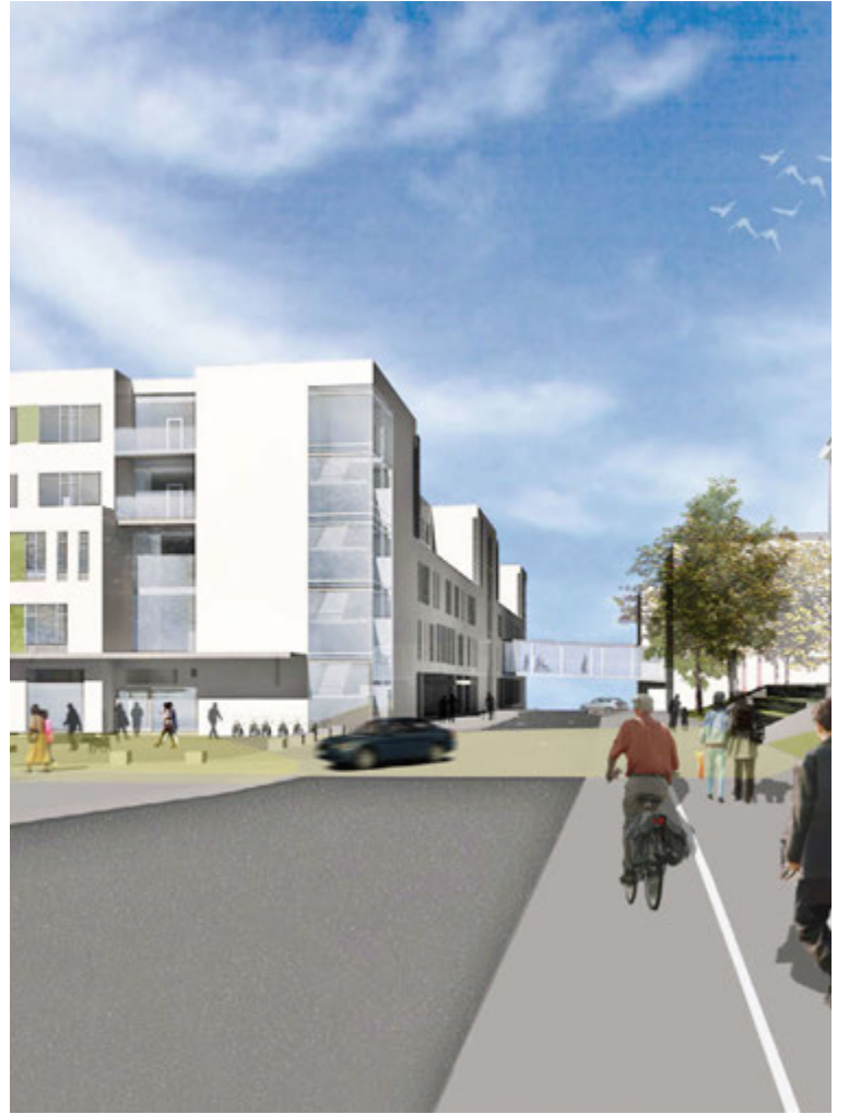
Í hópnum sem kemur að hönnunarverkefninu eru um 60 manns frá íslenskum arkitekta- og verkfræðistofum auk sérfræðinga frá Hollandi, Danmörku, Noregi og Englandi.