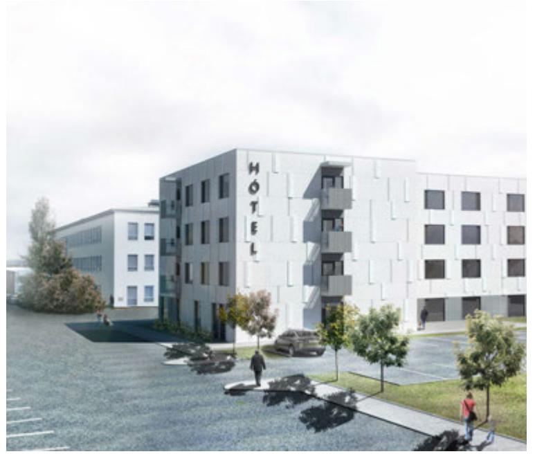
Hönnun sjúkrahótelsins var unnin með nýrri aðferðafræði þar sem sett var upp rafrænt, þrívítt og hlutbundið líkan af mannvirkinu.