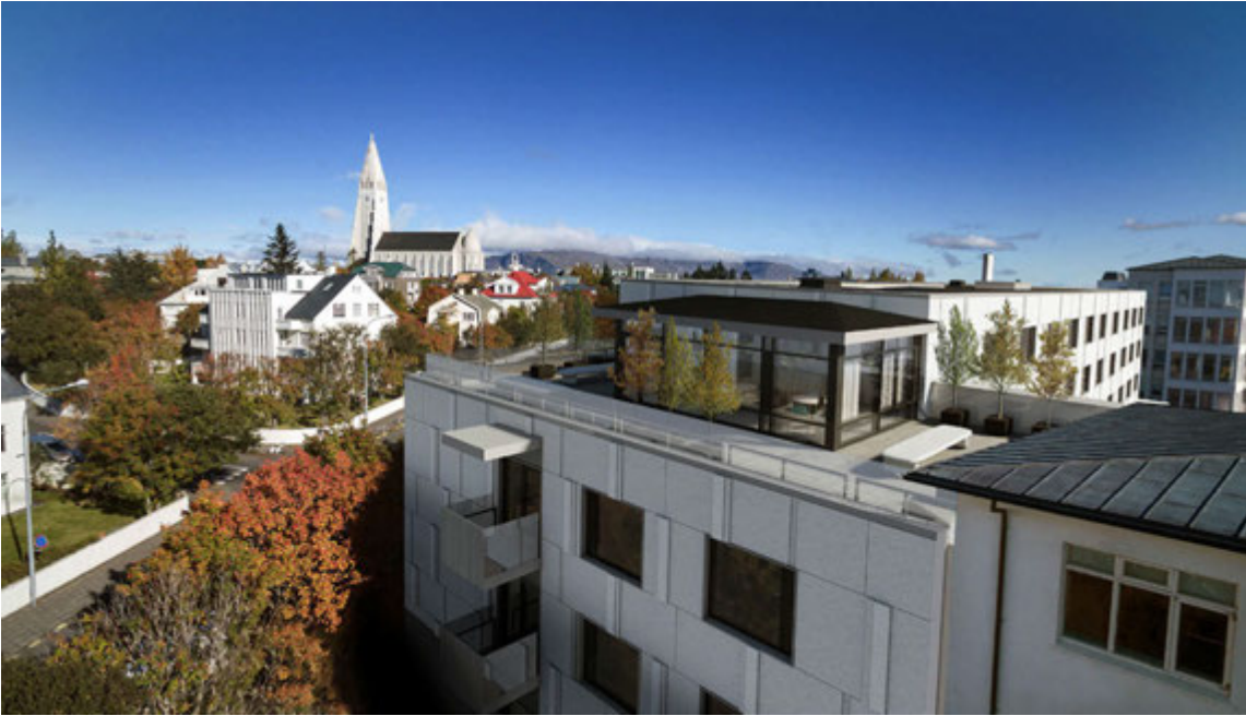
Á fjórðu hæð sjúkrahótelsins er rúmgóður glerskáli og þakverönd með útsýni yfir borgina í vestur.