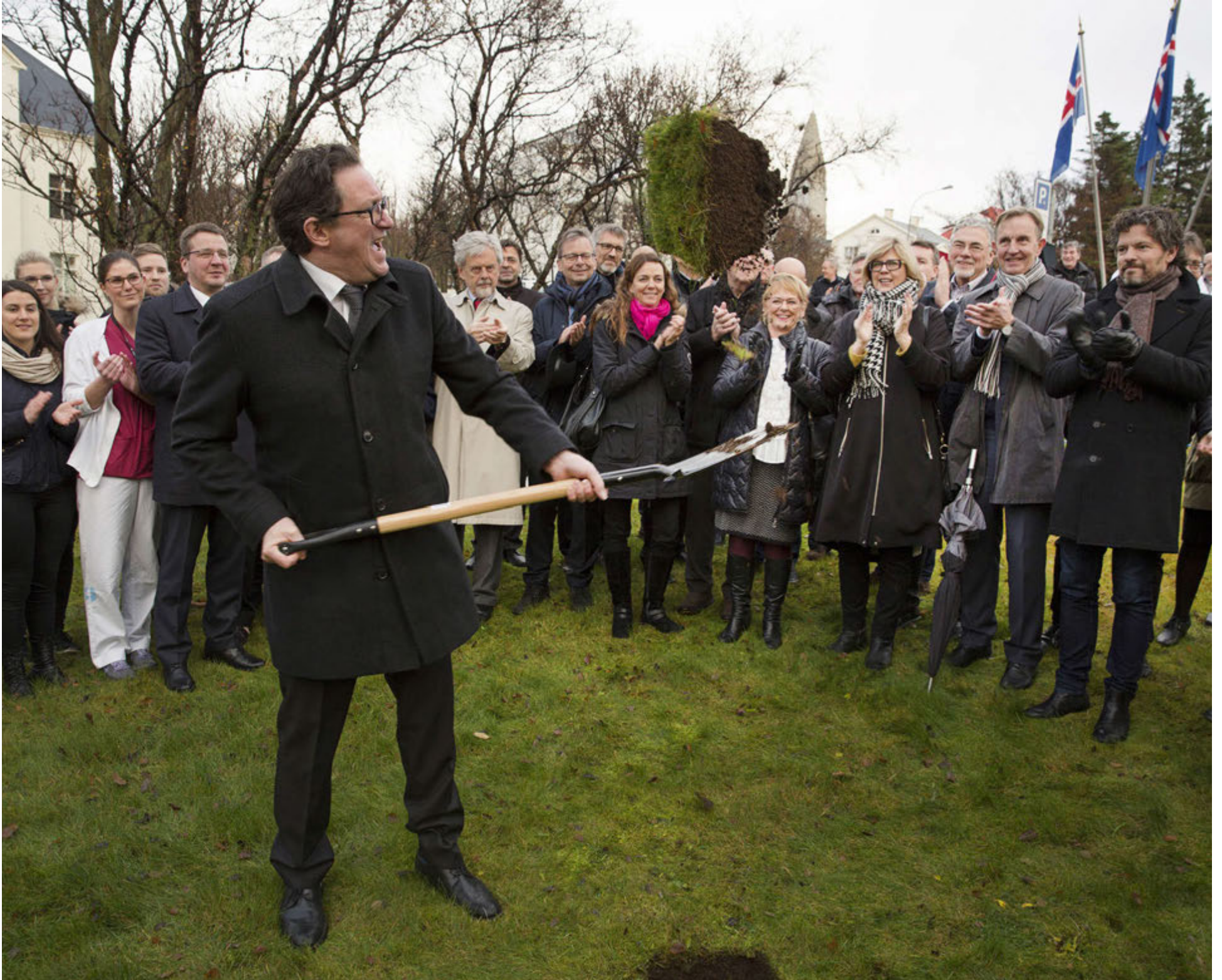
Kristján Þór Júlíusson, heilbrigðisráðherra, tók fyrstu skóflustunguna að nýju sjúkrahótelu fyrir tæpu ári. Fjármálaáætlun 2017-2021 gerir ráð fyrir að uppbyggingu verði haldið áfram af krafti við Hringbraut.