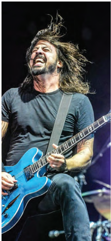
Foo Fighters hefur tvisvar sinnum áður haldið tónleika hér á landi.

Foo Fighters hefur tvisvar sinnum áður haldið tónleika hér á landi. Þeir mættu fyrst hingað árið 2003, ári eftir útgáfu fjórðu plötu sinnar en á þeim tíma var sveitin ein vinsælasta rokksveit heims. Tveimur árum síðar mætti hún aftur til landsins og þá með rokkurum í Queens of the Stone Age. Saman héldu þær eftirminnilega tónleika í Egilshöll sem var hluti af Reykjavík Rock tónlistarhátíðinni. Sveitin sendi frá sér nýtt lag fyrir stuttu og ný plata kemur væntanlega út síðar á árinu eða því næsta.