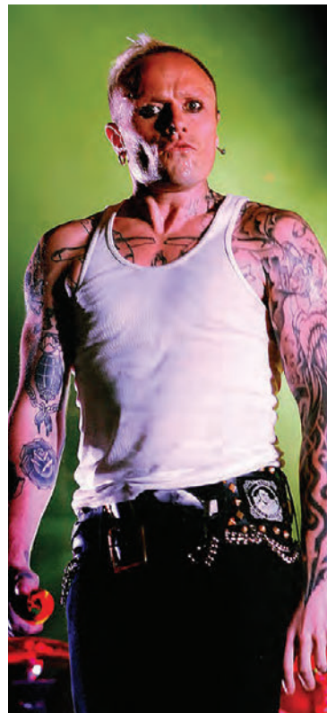
The Prodigy mætti fyrst til landsins árið 1994.