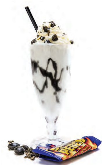
Á shake-matseðlinum eru yfir 22 tegundir af mismunandi hristingi.