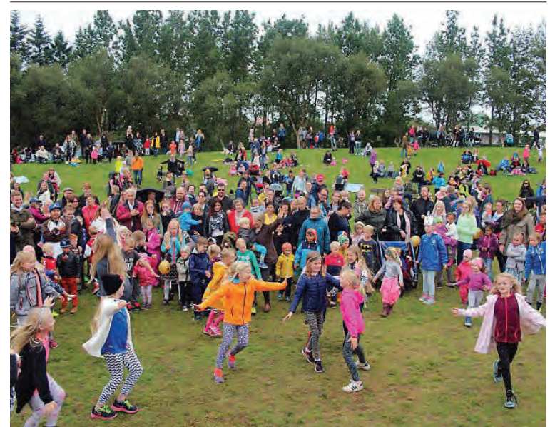
Hátíðin Kátt á Klambra tókst mjög vel í fyrra en Kátt á Solstice byggir á sömu hugmyndafræði.

13.00 Barnajóga 14.00 Listasmíðja 15.00 Beatbox 16.00 Brettakennsla 17.00 Barnadiskó