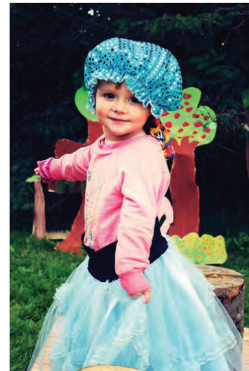
Gleðin ríkir hjá yngstu kynslóðinni.