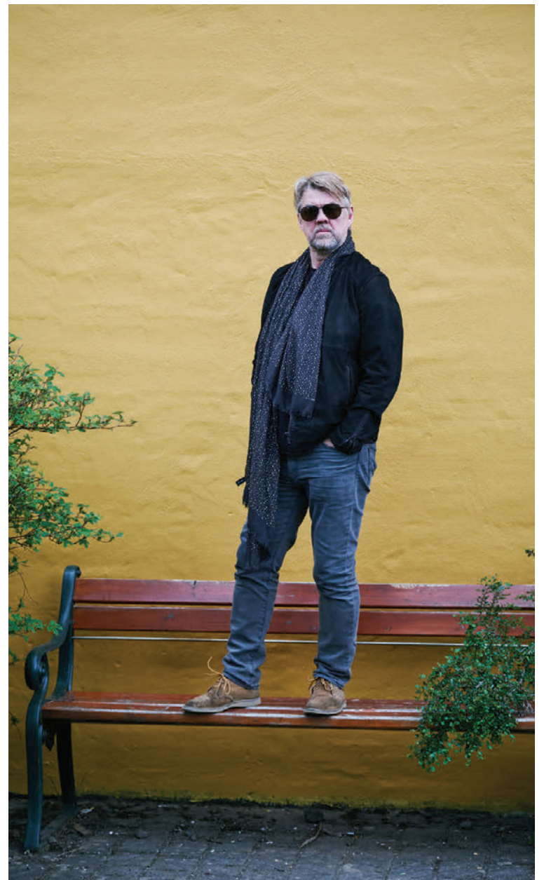
„Það verður nú ekki leiðinlegt að hita upp fyrir sjálfa Chaka Khan,“ segir Helgi.

og það gefur hátíðinni skemmtilegt yfirbragð. Allir geta skemmt sér saman,“ segir Helgi sem ætlar síðan að taka sér gott frí í sumar. „Við í Síðan skein sól munum koma fram á fleiri stórvíðburðum í sumar en um verslunarmannahelgina ætla ég að fara til Ísafjarðar og vera á mýraboltanum. Ég hef aldrei gert það áður.“