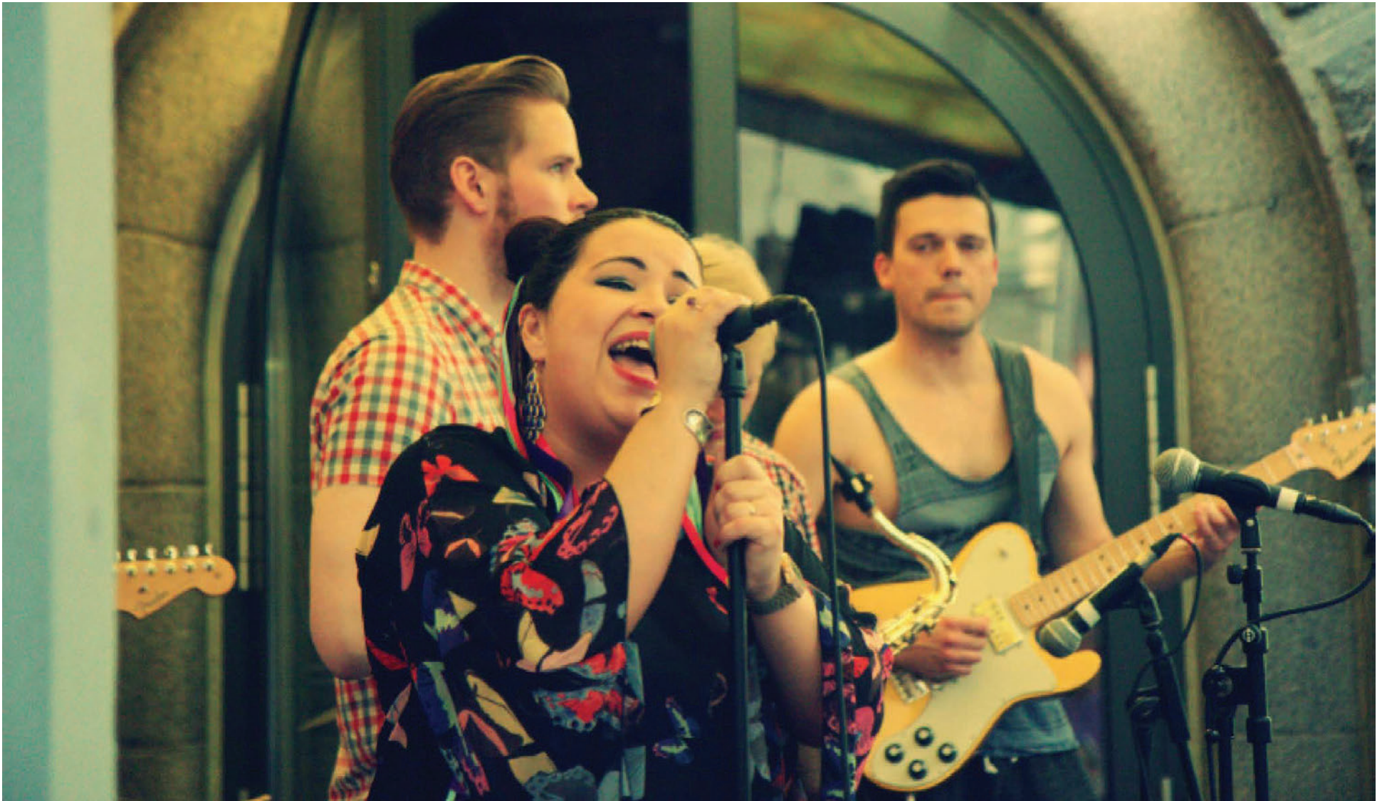
Fox Train Safari var stofnuð árið 2008 en gaf út sína fyrstu plötu í fyrra. Sveitin kemur fram næsta fimmtudag á Secret Solstice.