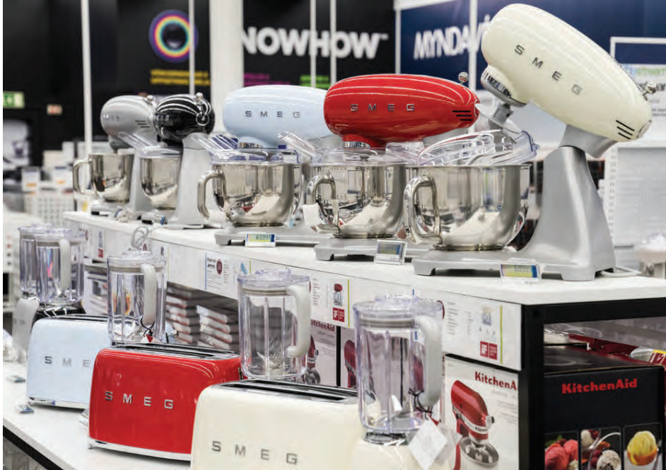
Í ELKO fæst allt sem þarf til heimilishalds; gæðavörur á góðu verði.

„Við erum einfaldlega með öll raftæki fyrir heimilið; eldhúsið, þvottahúsið, stofuna, sjónvarpsherbergið, baðherbergið og meira til, og hreinlega gaman fyrir fólk í hreiðurgerð að koma til okkar í ELKO til að velja liti, útlit og gæði sem passa við húsbúnað og stílinn heima. Einnig er notalegt og sparar tíma að skoða vefverslun ELKO, elko.is, heima í stofu til að ákveða hvað næst skal kaupa sér í búið.“