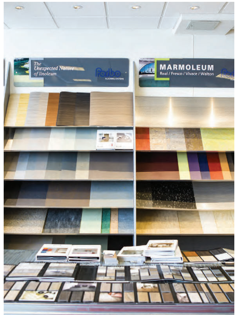
Möguleikar á mynstrum og útfærslu eru endalausir með Marmoleum Click.