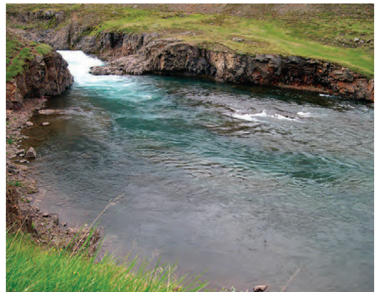
Kolbeinspollur, Brúarlagshylur og Hellan.