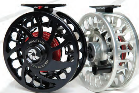
NAUTILUS CCF Mögnuð tvíhenduhjól Verð frá 95.900 kr.