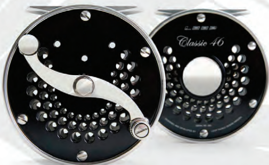
LOOP CLASSIC Gamli skólinn Verð frá 99.900 kr.