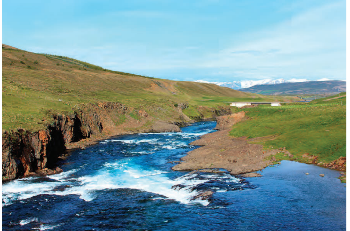
Horft frá Kolbeinspolli niður gilið á 1. svæði.