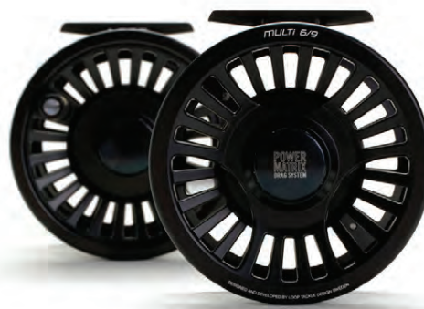
LOOP MULTI Alvöru hjól á betra verði Verð frá 31.900 kr.