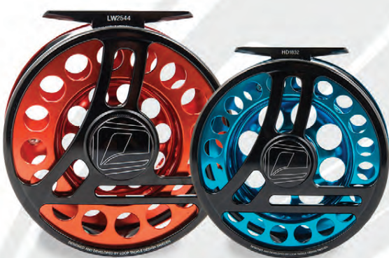
LOOP EVOTEC Allir þekkja Loop-gæði Verð frá 56.900 kr.