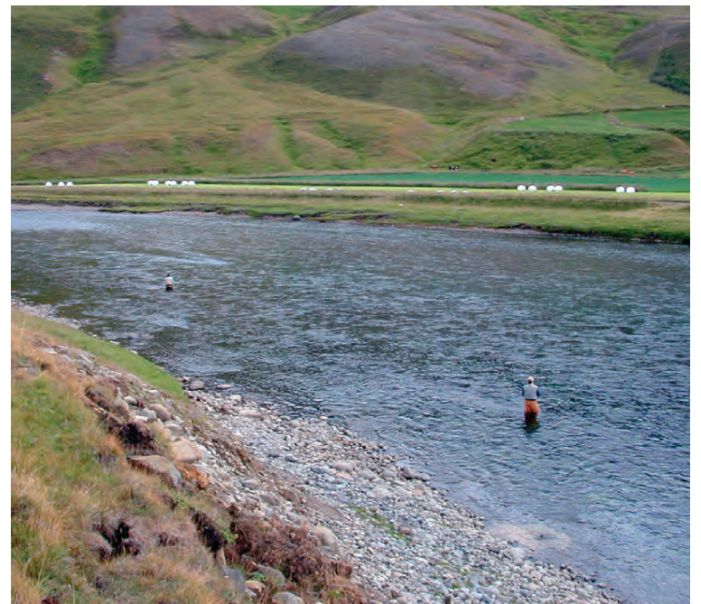
Ferjupollur á 2. svæði.