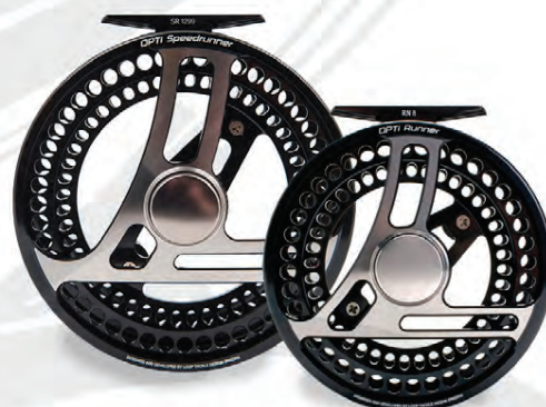
LOOP OPTI Sjálfsagt besta hjólið í laxinn Verð frá 64.900 kr.