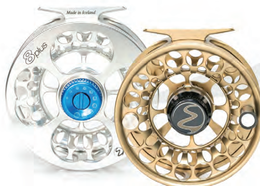
EINARSSON PLUS Íslensk framleiðsla á heimsælikvarða Verð frá 59.900 kr.