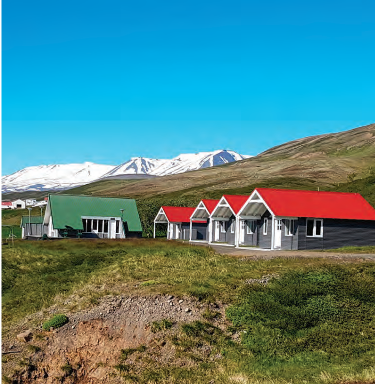
Veidihúsin að Flúðaseli