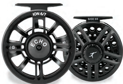
ECHO ION OG ECHO BASE Ódýr en áreiðanleg Verð frá 7.300 kr.