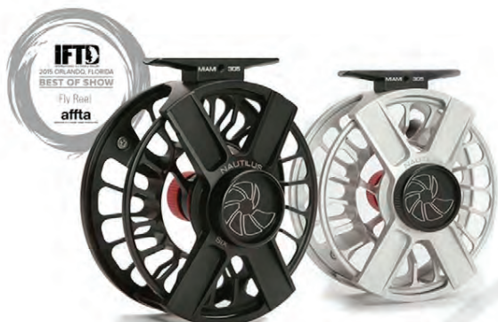
NAUTILUS X Sennilega langbestu kaupin Verð frá 39.900 kr.

EITT MESTA ÚRVAL LANDSINS AF FLUGUVEIÐIHJÓLUM