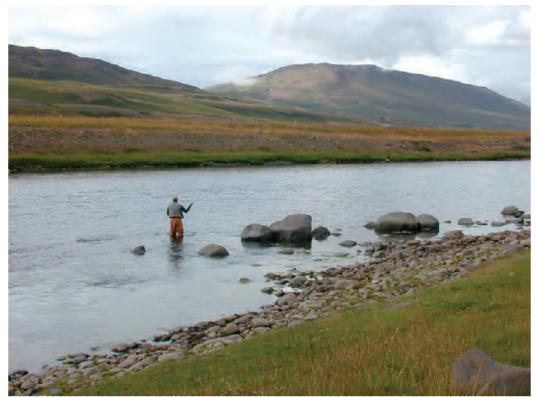
Þvergarðsbreiða á 3. svæði.

Veidiðeyfi og frekari upplýsingar. www.fnjoska.is netfang: fludir@fnjoska.is