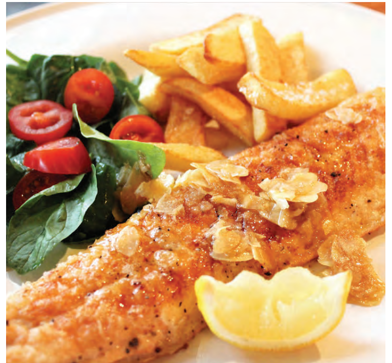
Þönnusteikt er bleikjan ávallt mjög góð.

ellidason@strengir.is /// strengir.is /// 660 6890