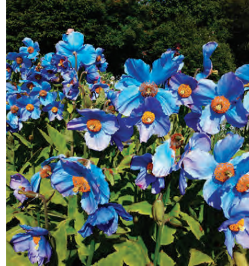
Bærinn er þekktur fyrir gróðuræld.

hjá Akureyrarbæ og er að setja sig inn í starfið eins og stendur. Hún hlakkar til að sinna nýju starfi og kynnast nýju samstarfsfólki og verkefnum. „Í sumar var ég hins vegar svo ljónheppin að vinna sem leiðsögumaður hjá SBA og fara með fólk af skemmtiferðaskipum í dagsferðir í rútum. Það eru forréttindi að kynna fyrir erlendum gestum þessa fallegu staði á Norðurlandi og fólk var hrifin af þeirri stórkostlegu náttúru sem við höfum hér allt í kring. Jarðfræðin hér er heillandi og hefur kveikt áhuga minn og ég geri mitt besta til að útskýra hana frekar. Mývatnssvæðið, Dimmuborgir, Hveraröndin við Námskarð og Jarðböðin, svo eitthvað sé nefnt. Godafoss og torfbærinn í Laufási, þetta eru allt staðir með aðdráttarafl. Skemmtilegast þótti