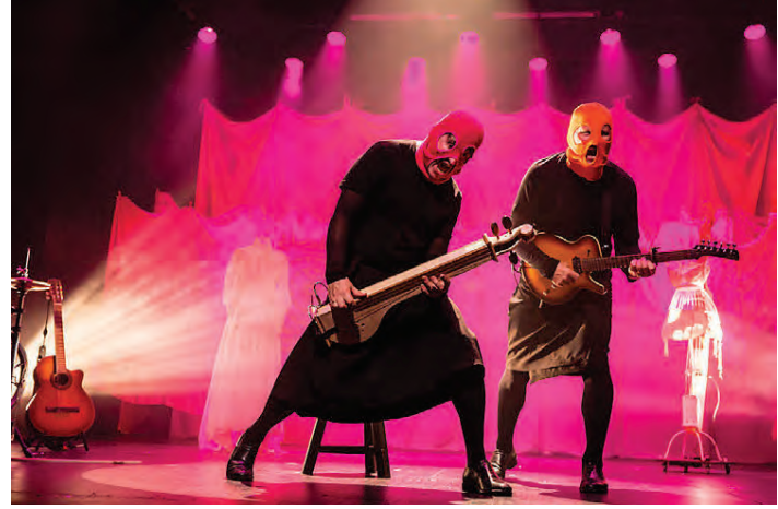
Hundur í óskilum sér um pönkið í sýningunni Kvenfólk hjá Leikfélagi Akureyrar, hér í gervi Pussy Riot.

M enningarferðir til Akureyrar verða æ vinsælli enda býður Akureyri bæði upp á fallegt umhverfi, skemmtilega verslun og afbragðsgóða veitingastaði. Og þá er menningin sjálf ótalin. Menningarfélag Akureyrar stendur fyrir blómlegu menningarlífi í hinu margrómaða menningarhúsi Hofi þar sem eru bæði haldnar myndlistarsýningar, tónleikar og leiksýningar. Myndlistin er einnig við völd í Listagilinu þar sem oft eru skemmtilegar og óvenjulegar myndlistarsýningar. Leikfélag Akureyrar á svo heima í hinu fornfræga Samkomuhúsi og stendur nú fyrir leiksýningunni Kvenfólk þar sem leikhópurinn tvímennti Hundur í óskilum fer yfir sögu kvenna og kvenna-baráttu og grefur upp ýmislegt óvænt. Sýningin hefur fengið afbragðsdóma áhorfenda og gagnrýnenda. Það eru því nægar ástæður til að bregða sér norður í menninguna.