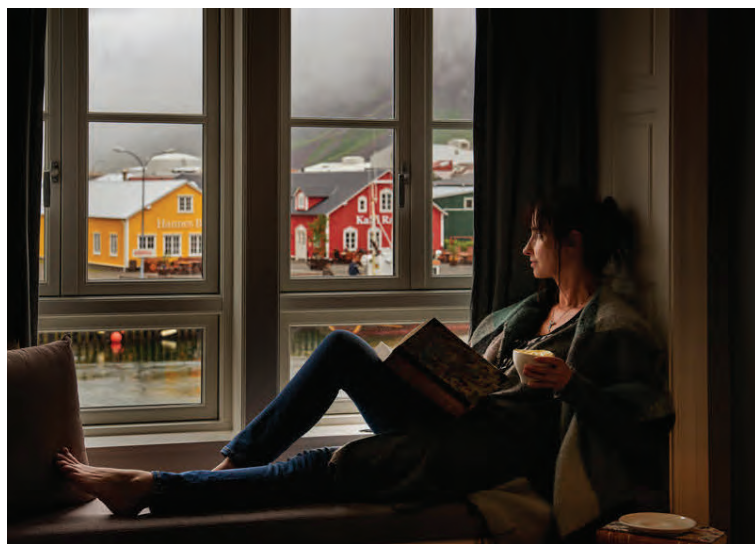
Kósýheit einkenna alla umgjörð og hönnun Sigló hótels.

Heildaryfirbragðið á öllu vinnur að því að toga fólk inn í ákveðna menningu og notalegheit sem ríkja hér á staðnum.