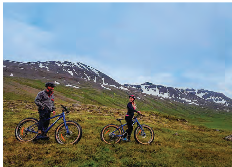
Möguleikar eru á fjölbreyttri útivist, meðal annars Fat-bike hjólaferðum.

„Heildaryfirbragðið á öllu vinnur að því að toga fólk inn í ákveðna menningu og notalegheit sem ríkja hér á staðnum,“ útskýrir