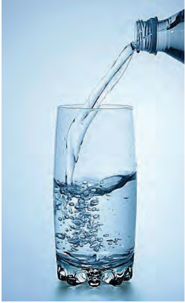
Vatn er hollt, frískandi og ókeypis.