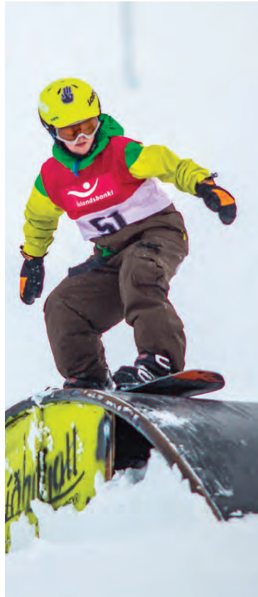
Snjóbrettin eiga vaxandi vinsældum að fagna í Hlíðarfjalli.