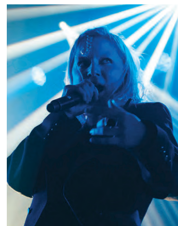
Fjórða plata Mammút kom út sumarið 2017.

Sjálfur hefur hann nokkrum sinnum spilað á Airwaves, bæði