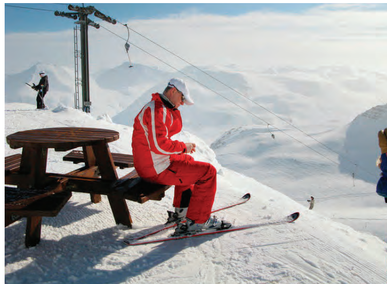
Framkvæmdir standa yfir á skíðasvæði Siglufjarðar.