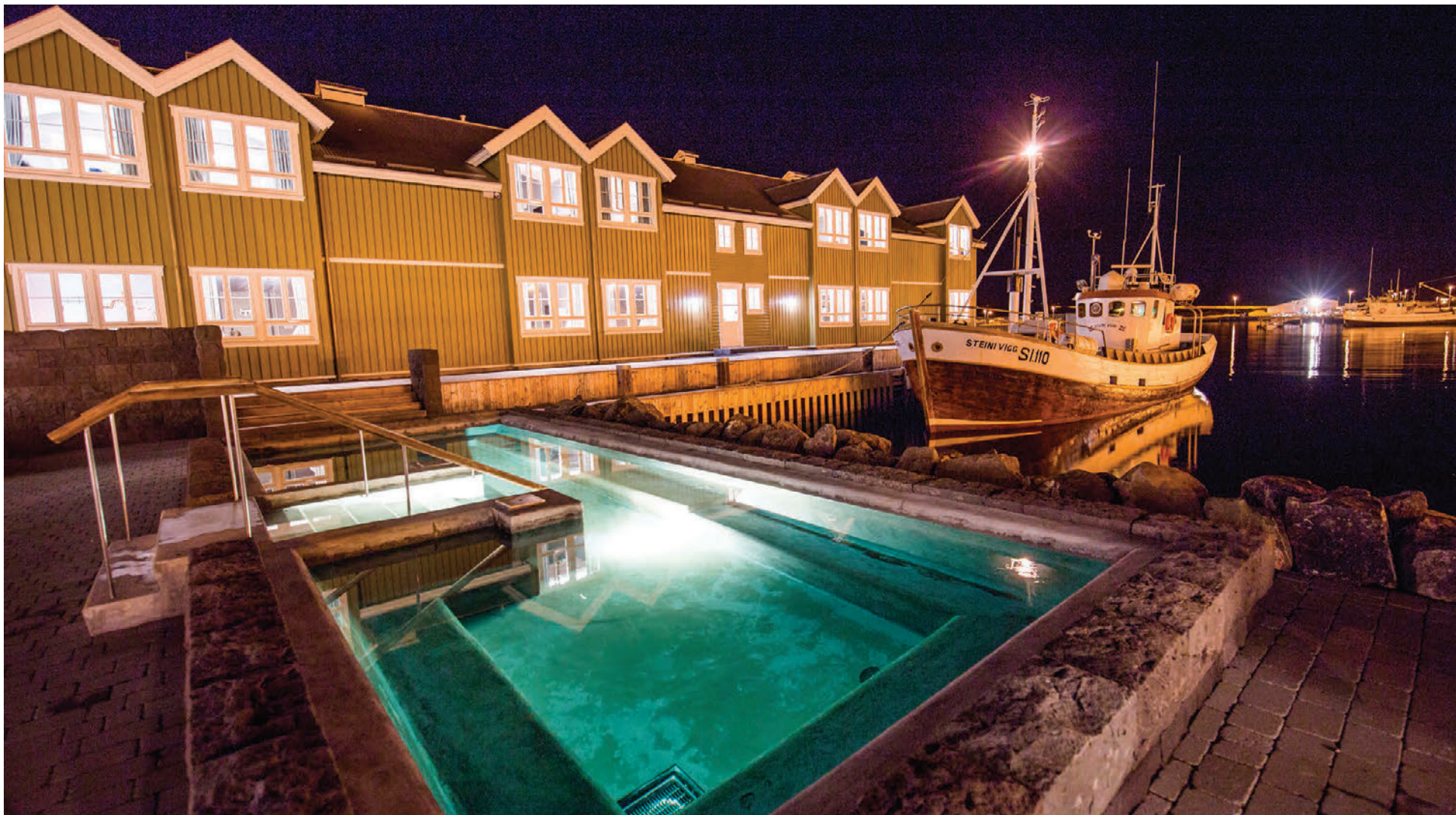
Útsýni er yfir smábáthöfnina, hjarta bæjarinnar. Gestir hótelsins geta látið líða úr sér í heitum potti og gufubaði eftir ánægjulegan dag á útivistarsvæðum Siglufjarðar.