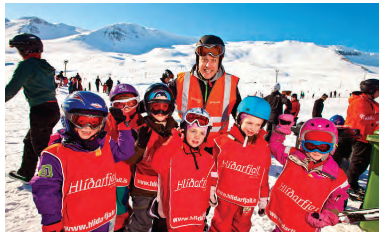
Skíðaskóli barnanna nýtur stöðugra vinsælda en áætlað er að um 3000 börn stundi þar nám ár hvert undir leiðsögn reyndra skíðakennara.

Hann bendir líka á starfsemi skíðakennara í fjallinu. „Við erum með skíðaskóla fyrir börnin og þar rúlla í gegn svona þriðju þúsund krakkar á ári. Svo er annað námskeið sem við köllum það er aldrei of seint að byrja og það er ætlað byrjendum og þeim sem fóru síðast á skíði um og í kringum síðustu öld. Það eru margir sem koma á það námskeið sem hafa ekki farið á skíði í 15-20 ár. Svo geturðu líka pantað þér einkakennslu.“