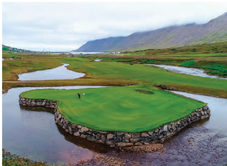
Glæsilegur níu holu golfvöllur verður opnaður næsta sumar.

Framkvæmdir standa yfir á skíðasvæði Siglufjarðar og frekari uppbygging á því svæði. Þeim verður lokið næsta sumar. Veturinn 2019-2020 er því stefnt á að bjóða upp á nýtt og stórendurbætt svæði.