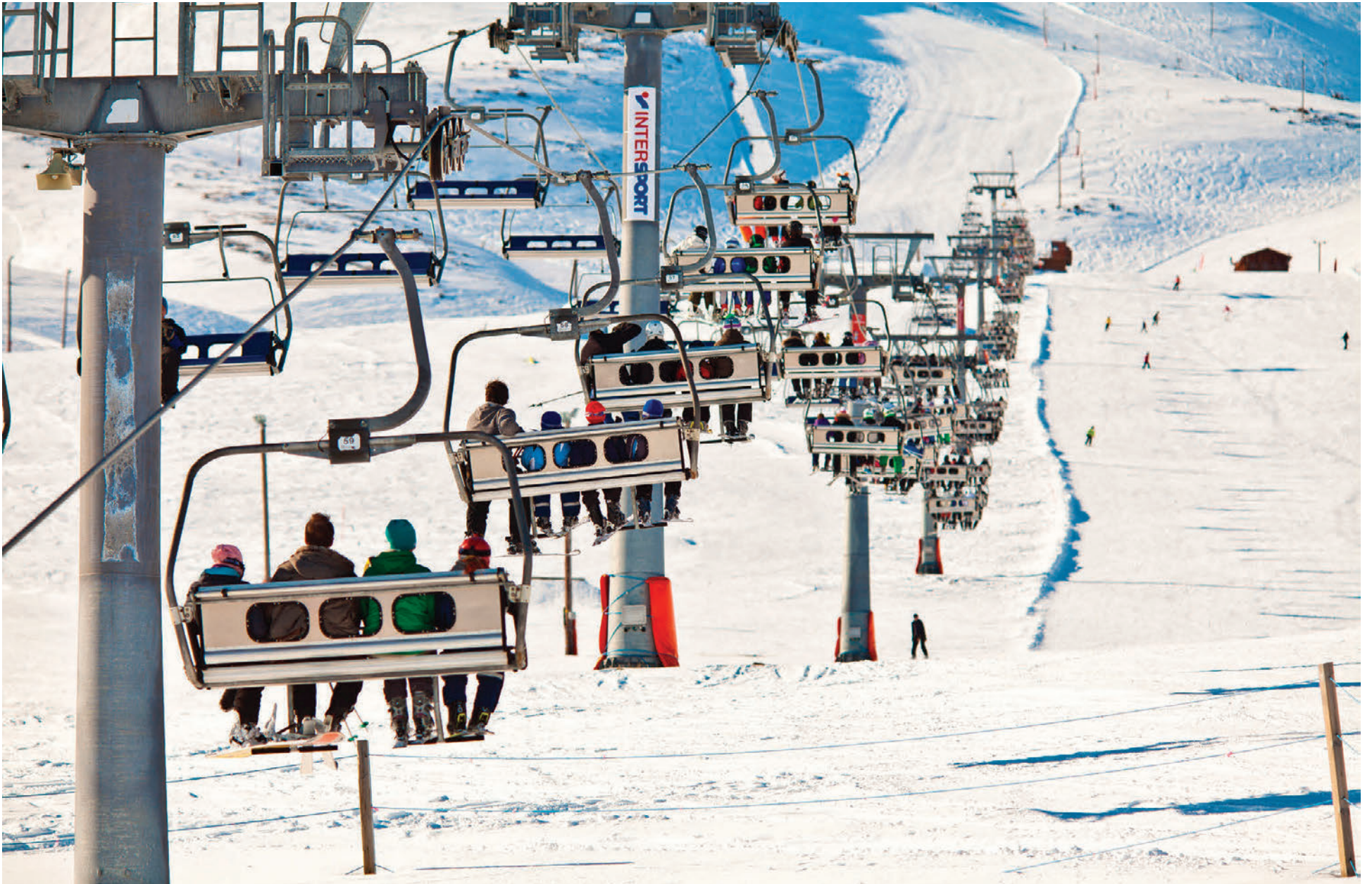
Skíðalyftan Fjarkinn er ein sjö skíðalyfta sem fara upp á Hlíðarfjall með ánægða skíðaiðkendum, en áætlað er að skíðalyfturnar flytji tæplega 5000 manns ár hvert á áfangastað efst í skíðabrekku.