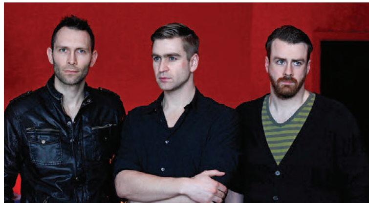
200.000 Naglbítar heimsækja heimabæ sinn á Airwaves.