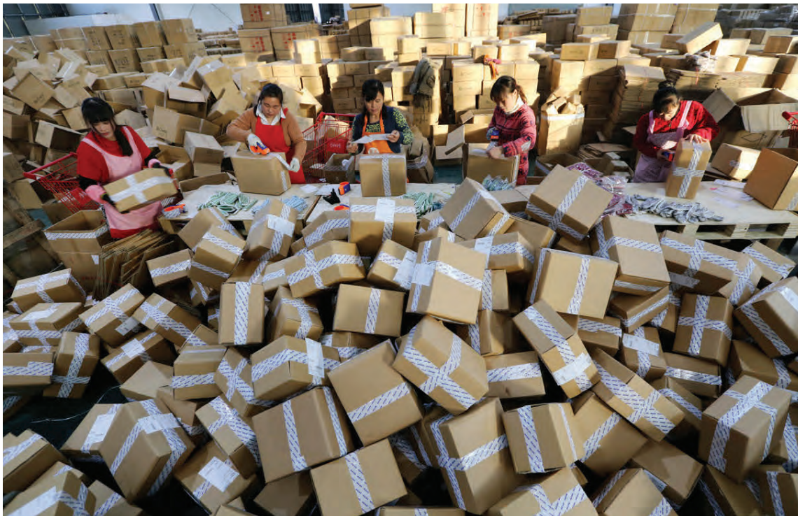
Hlutabréf í Alibaba hafa tvöfaldast í verði á árinu.

Sérfræðingar segja að Asía, sérstaklega Kína, sé í þungamiðju alþjóðlegra breytinga á verslun, sem sé sífellt meira að færast yfir á netið. Árið 2015 tóku Kínverjar fram úr Bandaríkjamönnum og varð sú þjóð sem eyðir mestu á netinu og í dag eru Kínverjar