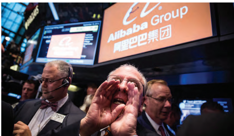
Það er nóg að gera hjá póstafræðslumönnum í Kína á degi einhleypra.

miklar framfarir í tækni og póst-flutningum í Asíu, sem ýtir enn frekar undir þróunina.