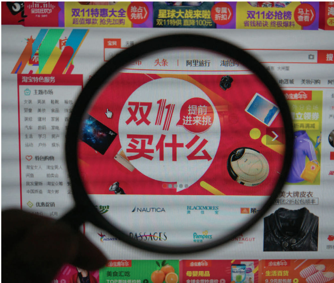
Netverslun á kínverskum vefsíðum eins og Tmall.com hefur margfaldast á örfáum árum.