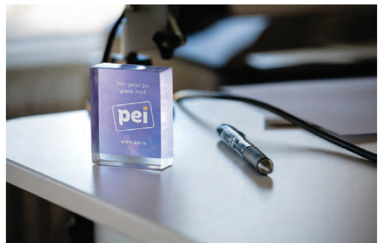
Pei – greiðsluþjónusta hefur verið starfrækt frá árinu 2016.

„Þessi þjónusta hefur fengið frábærar viðtökur. Viðskiptavinir eru almennt sammála um að þessi kostur sé frábær,“ segir Guðni og bætir við að fyrirtækið sé alltaf að bæta þjónustuna. „Á næstu dögum förum við af stað með þá nýjung að viðskiptavinir geta fengið aukinn greiðslufrest í 30 eða 60 daga eftir óskum. Fólk getur keypt jólagjafirnar núna og greitt fyrir þær 30 til 60 dögum seinna, að viðbættum þeim 14 daga fresti sem innifalinn er í þjónustu okkar. Dæmi má nefna að ef jólaínkaupin hefjast í