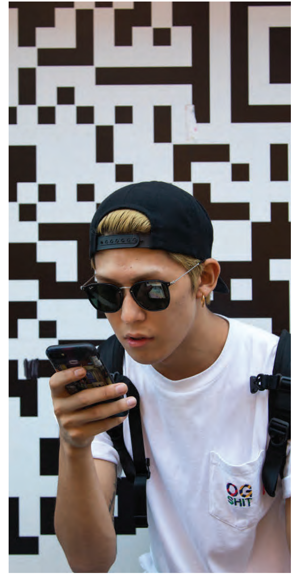
Ungt fólk í Asíu verslar mjög mikið á netinu.