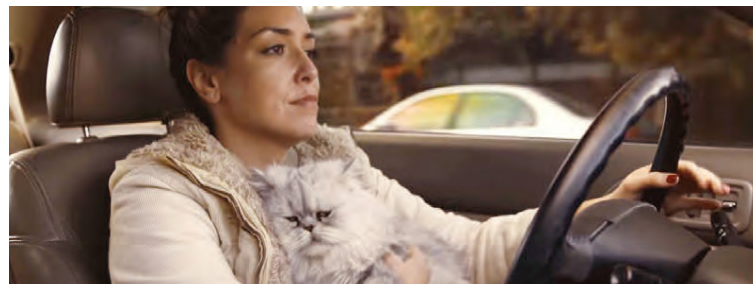
Skjáskot úr auglýsingunni um gömlu Honduna.

Billinn er til sölu á eBay og boð í hann voru komin í um 15 og hálf milljón króna þegar eBay aflýsti uppboðinu vegna gruns um að boðin væru ekki öll raunveruleg. Fyrirtækið ákvað því að hefja nýtt upp-