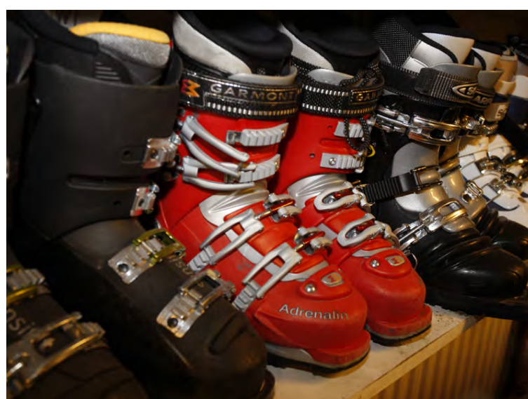
Síðan Notaður skíðamarkaður leggur áherslu á að fagmenn votti um notagildi þess sem þar er til sölu.

Meðlimir eru um 24.000 og þar eru eingöngu til sölu notaðar vörur þekktara hönnuða. Skylda er að tilgreina hönnuð og ástand hlutarins og oft er óskað eftir tilboðum því hlutir geta haft allt annað vægi í huga þess sem safnar en þess sem vill losna við.