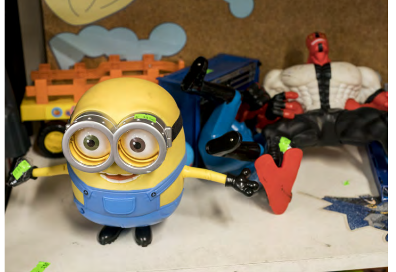
Leikfang sem einhver er vaxinn upp úr getur verið öðrum til ómældrar gleði.