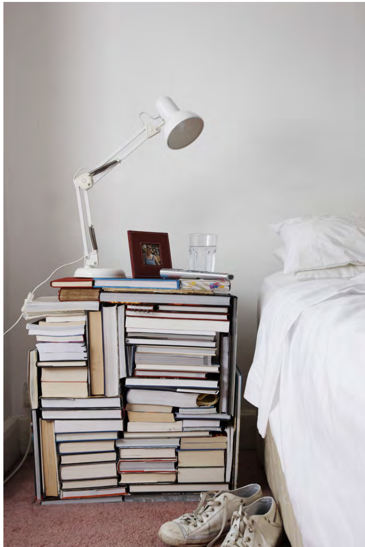
Bókanáttborð fyrir þá sem ekki geta ákveðið hvað þeir eru að lesa.

» Ef það er áhugi á að nýta lök, gardínur, sokkabuxur eða bara slitin uppáhaldsföt er kjörið að grípa heklunálina og ráðast til atlögu.