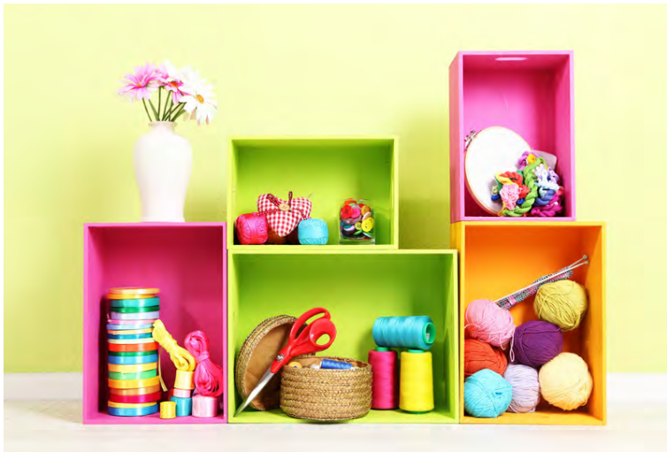
Trékassa undan mandarinum má mála og búa til skemmtilegar smáhillur, jafnvel raða mörgum saman.

Eftir aðventuna og jólin fyrirfinnst mandarinukassar á hverju heimili í töluverðu magni og enginn veit almennilega hvað er hægt að gera við þá. En örventið ekki. Mandarinukassa er hægt að nýta sem skemmtilegar umbúðir utan um gjafir ef þú ætlar til dæmis að gefa einhverjum marga litla pakka eða eitthvað huggulegt matarkyns. Það