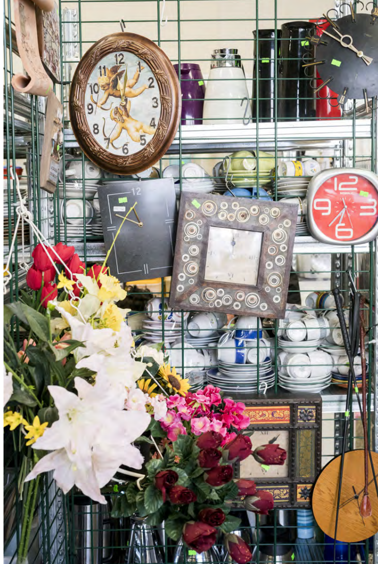
Þau sem hafa auga fyrir skemmtilegum uppstillingum geta búið til afskaplega fallega veggj með ólíklegasta dóti.