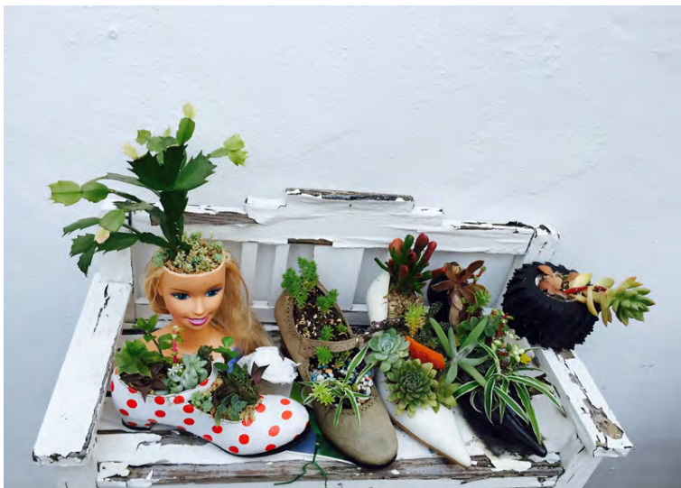
Úr sér gengnir spariskór verða eins og nýir þegar lífið fer að blómstra í þeim.

er einnig skemmtilegt að mála þá í fallegum litum og festa á vegg sem smádotahillu, jafnvel raða mörgum saman.