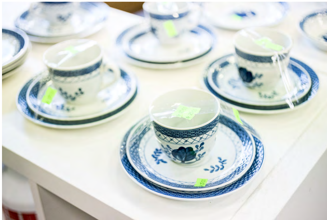
Í hópnum Notuð matar- og bollastell má finna falleg stell sem er kjörið að kaupa til dæmis fyrir veisluna frekar en pappa- eða plastdíska. Góð hugmynd er til dæmis fyrir stórfjölskylduna að fjárfesta í stelli fyrir árlegan ættarhitting.

Á Facebook eru fjölmargir hópar sem bjóða upp á notaða hluti ýmist til sölu eða gefins. Íslendingar reynast drjúgir þegar kemur að því að nýta það sem til er frekar en að kaupa nýtt.