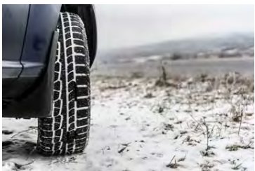
Ef það ferst fyrir að setja sumar-dekkinn undir bílinn getur það kostað 20 þúsund á dekk.

Á meðan á hjólbarðaskiptum stendur getur eigandi bílsins setið á kaffistofunni og slappað af. Verkstæðismennirnir finna dekkinn, setja þau undir, athuga með loft og gæði og setja vetrardekkinn í geysluna. Mynstur í dekkjum eru háð reglum og fagmennirnir á verkstæðinu athuga hvort þau eru lögleg. Dekkjahótel eru því óeitanlega þægilegur kostur þegar maður hefur fundið „sitt“ hjólbarðaverkstæði.