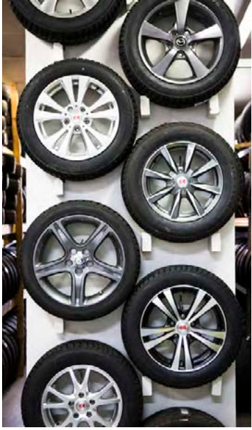
Gæði dekkjanna skipta miklu máli.