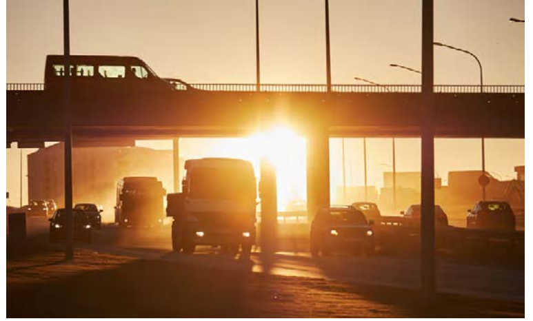
Svifryk er skaðlegar agnir sem eiga greiða leið ofan í öndunarfæri manna.

Svifryk (PM10) er agnir, minni en 10 mikrómetrar ( \mu\text{m} ) að stærð sem eiga greiða leið ofan í öndunarfærin. Svifryksmengun er ein af helstu ástæðum heilbrigðisvandans sem rekja má til mengunar í borgum. Svifryk er mælt reglulega í tveimur föstum mælistöðvum í Reykjavík, á Grensásvegi og í Fjölskyldu- og húsdýragarðinum og auk þess eru í notkun tvær færarlegar mælistöðvar.