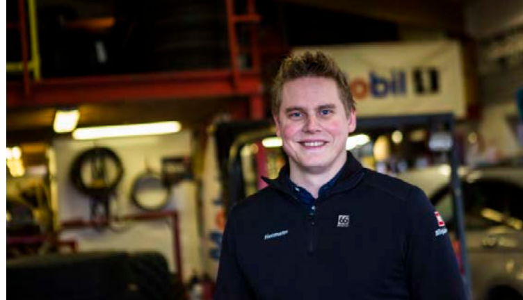
Hermann segir að Michelin sé annt um að viðskiptavinir finni fyrir öryggi á hjólbörðunum þeirra.

„Þetta má sjá glögg í nýju sumardekki frá þeim sem heitir Michelin Cross Climate+. Það er sumardekk fyrir norðlægar slóðir