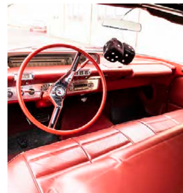
Rauði liturinn vekur alltaf athygli.